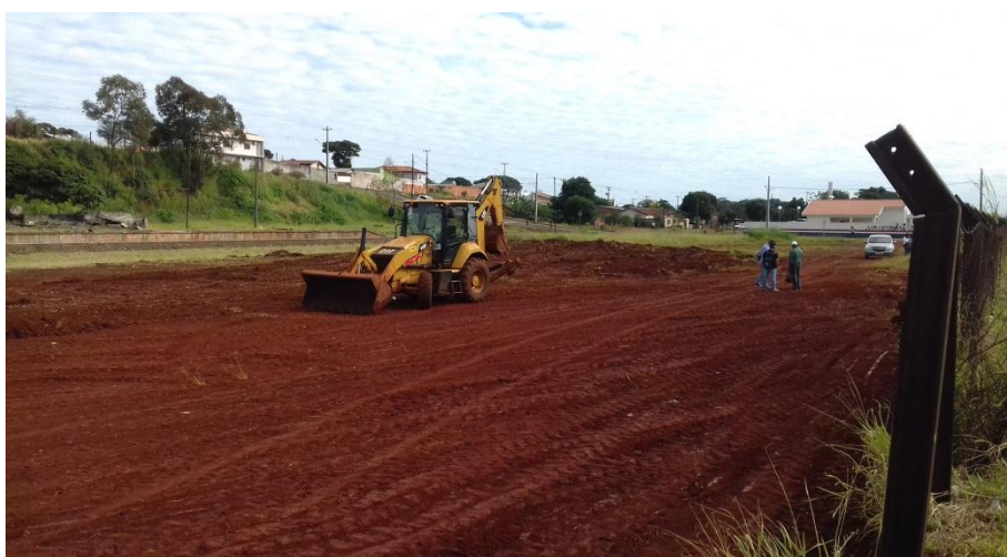
Figura 3.1 - Serviço de remoção da camada vegetal e terraplenagem, com uso de motoniveladora e retroescavadeira