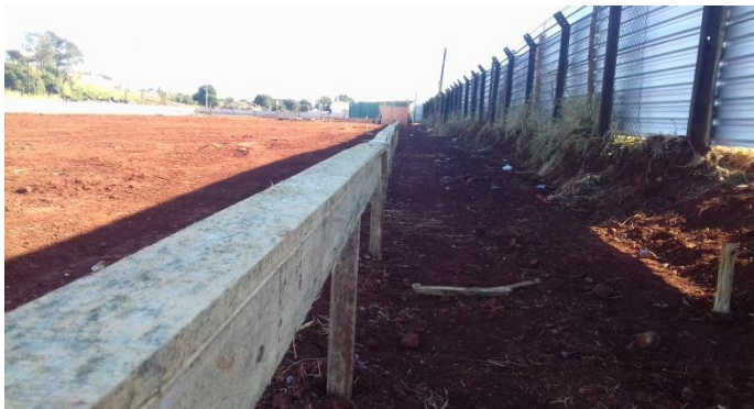
Figura 2.15: Detalhe do gabarito em madeira, fixado em pontaletes cravados no solo