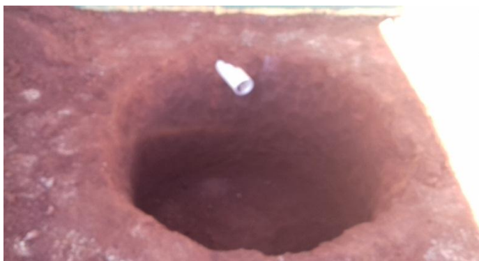
Figura 2.5: Fossa séptica sendo construída