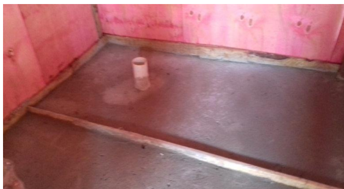
Figura 2.6: Ponto de esgoto primário