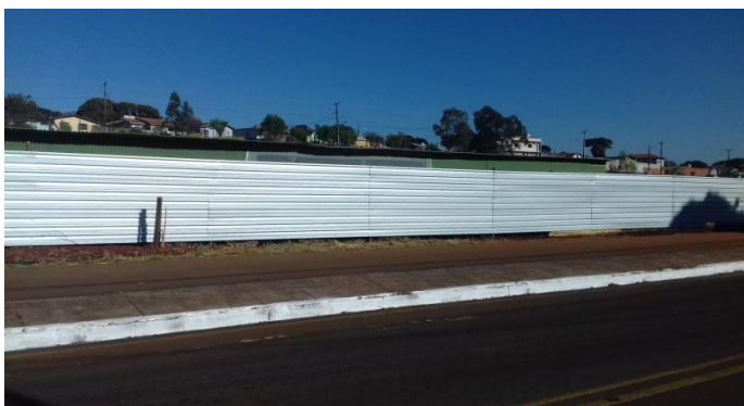
Figura 2.19: Vista externa de tapume instalado defronte à Avenida Central do Paraná