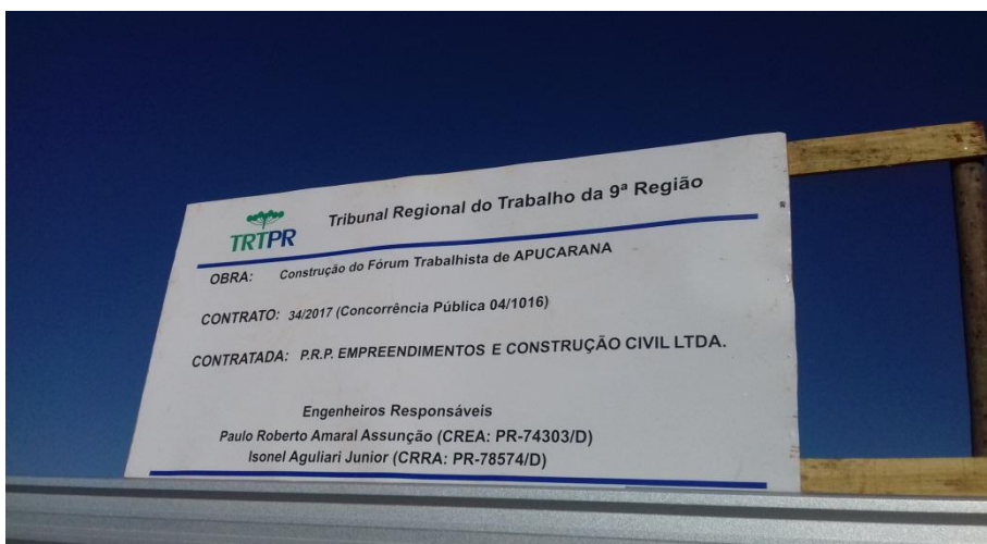
Figura 1.1 - Placa de obra, instalada defronte à avenida Central do Paraná, no número 1380. Além dos serviços relacionados em planilha, a contratada também realizou o pedido de demarcação, junto à Prefeitura, da numeração do lote e, também o pedido do alvará de construção.