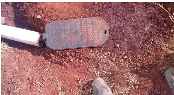
Figura 2.1: Detalhe da caixa de proteção do hidrômetro