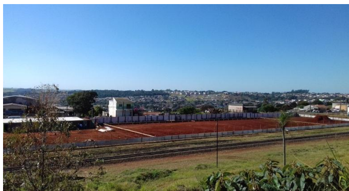
Figura 2.18: Vista panorâmica de gabarito e tapumes, tomada a partir da avenida paralela à avenida Central do Paraná