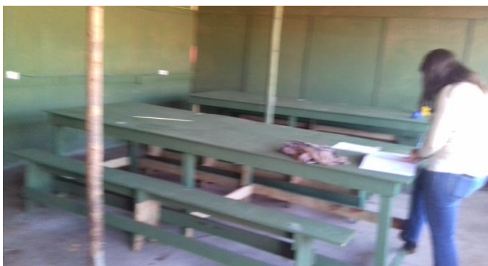
Figura 2.9: Refeitório