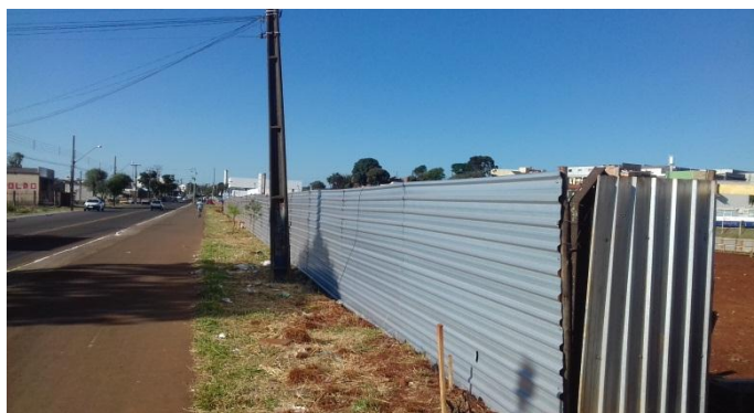
Figura 2.22: Tapume próximo à porta de acesso de pedestre à obra