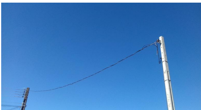
Figura 22.1: Poste padrão Copel