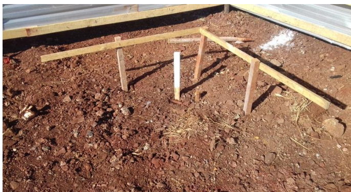
Figura 2.23: Estaca demarcando limite do terreno