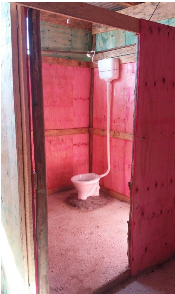
Figura 2.7: Unidade sanitária com bacia e caixa acoplada