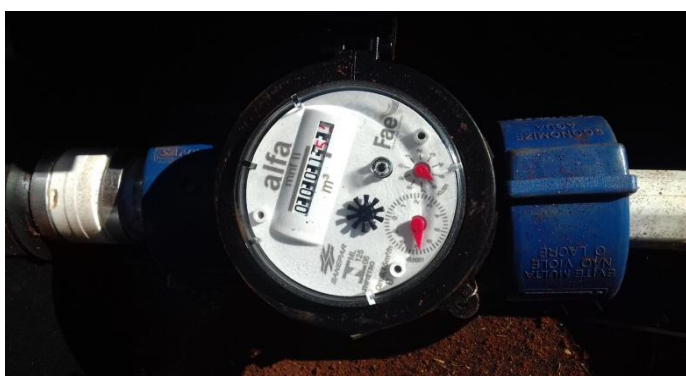
Figura 2.3: Detalhe do hidrômetro