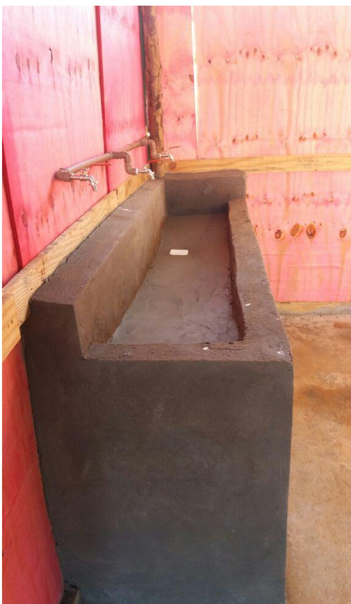
Figura 2.11: Lavatório executado nos sanitários