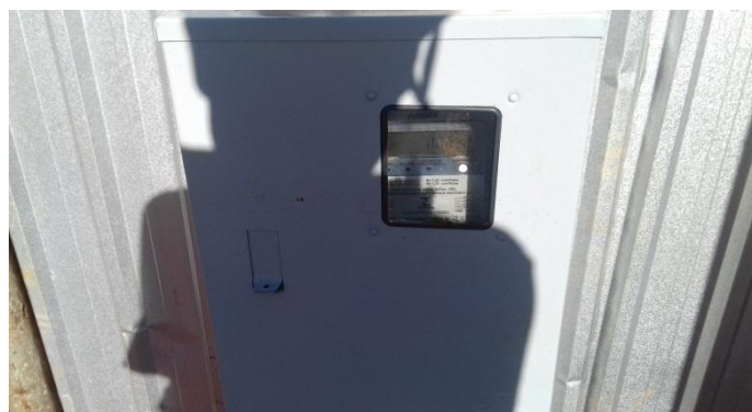
Figura 22.2: Caixa com medidor