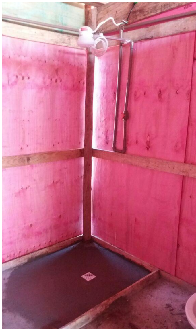
Figura 2.8: Chuveiro elétrico para banho