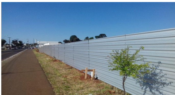
Figura 2.21: Tapumes em telhas metálicas