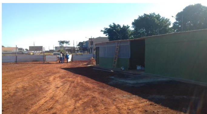
Figuras 2.12 a 2.14 (de cima para baixo): Container para ferramentas; Externa do refeitório e externa dos sanitários