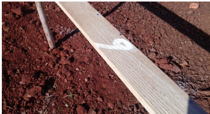
Figura 2.16: Marcação de eixo no gabarito de locação