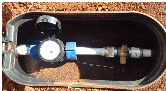
Figura 2.2: Caixa com hidrômetro e registro