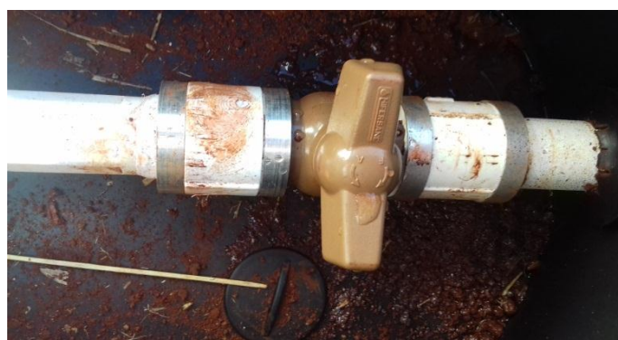
Figura 2.4: Registro de entrada