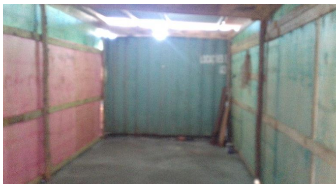
Figura 2.10: Depósito em madeira