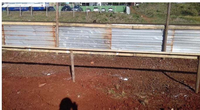
Figura 2.24: Marcas de cal, indicando locação das estacas do muro dos fundos do terreno