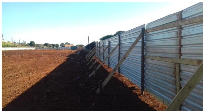
Figura 2.20: Vista interna de tapume instalado defronte à Avenida Central do Paraná