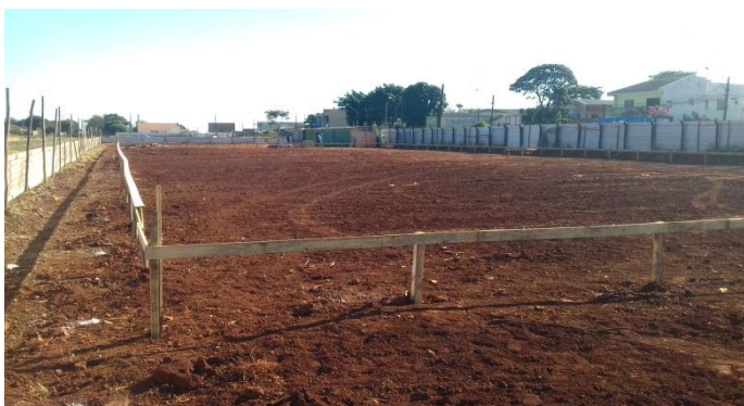
Figura 2.17: Vista parcial da locação da obra (porção sul do terreno)