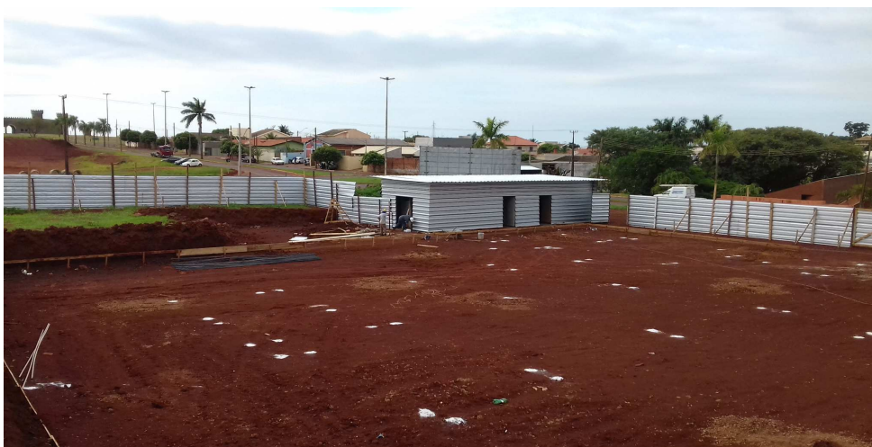
Figura 13: Posição do barraco de obra e, ao lado (esquerda), tapume executado nesta etapa.