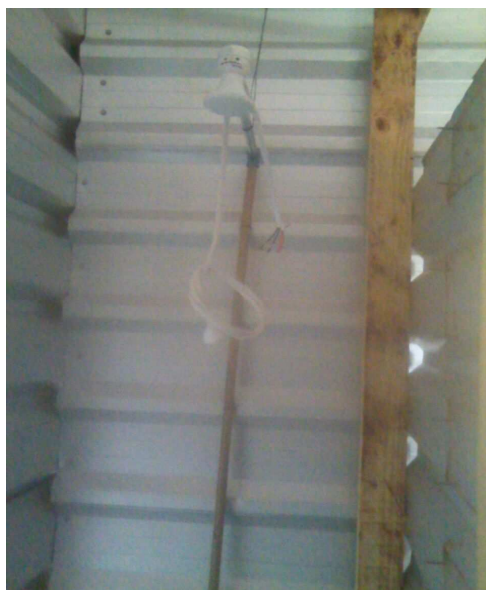
Figuras 7 e 8: unidades com chuveiros