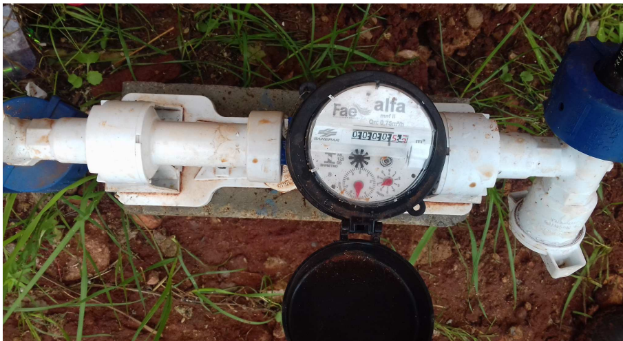
Figura 1: hidrômetro