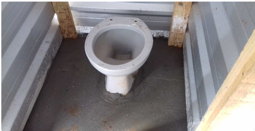
Figura 4: Vaso sanitário sendo instalado