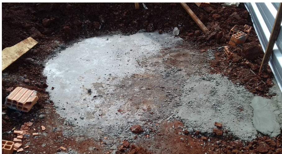
Figura 2: Fossa séptica para destinação do esgoto sanitário