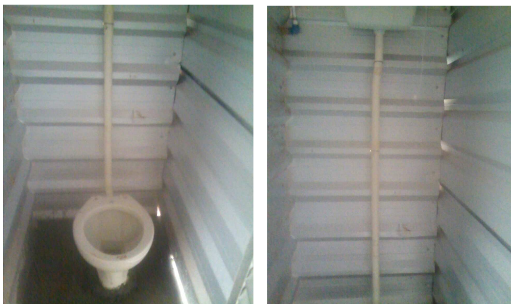
Figuras 5 e 6: Unidade sanitária já com caixa suspensa instalada