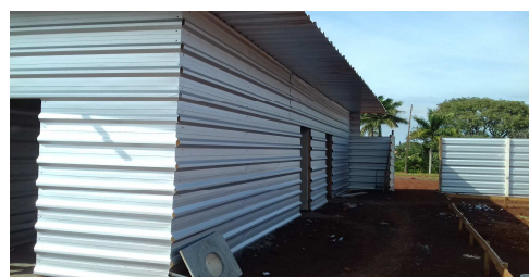
Figuras 9, 10 e 11: Lavatório (imagem a esquerda) e visão geral do barraco de obra (imagens a direita).