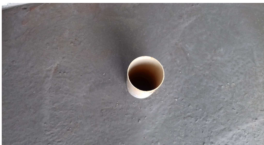
Figura 3: Ponto de esgoto sanitário para instalação de vaso