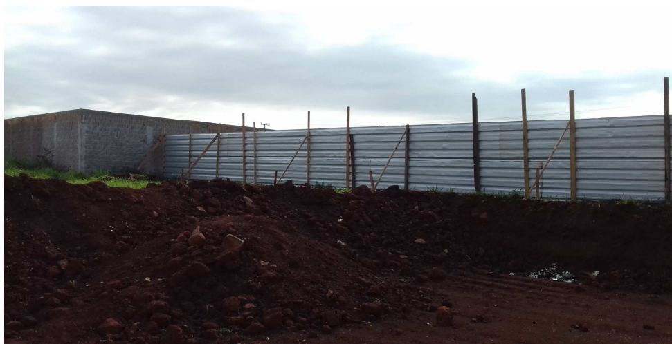
Figura 14: Trecho de tapume executado nesta etapa