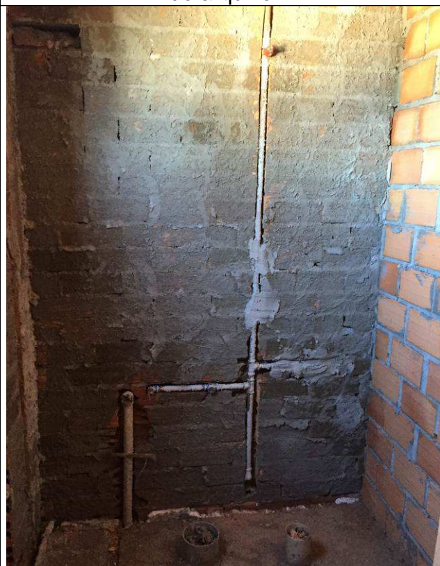
Figura 64C: Pontos de água fria - banheiros públicos.