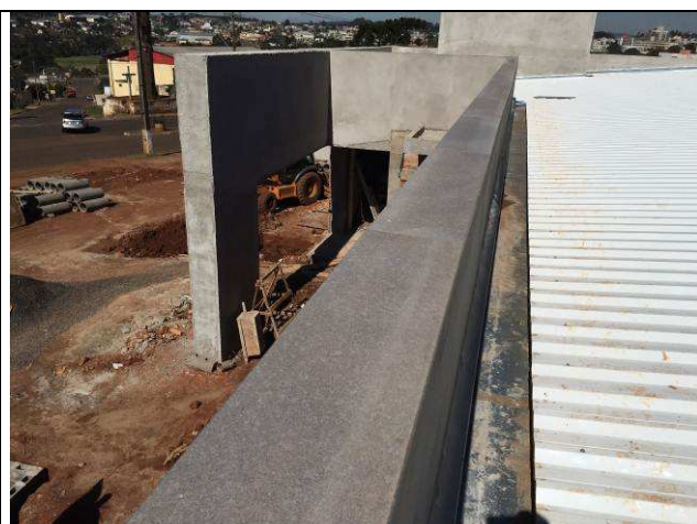
Figura 25C: Capeamento das platibandas.