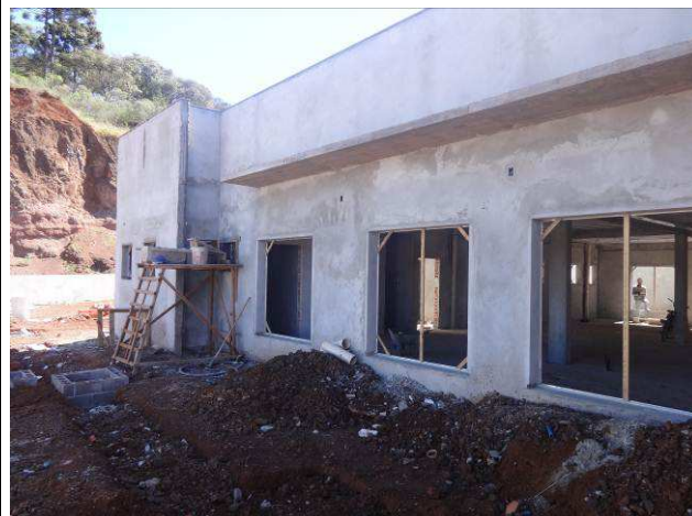
Figura 12E: caixas iluminação externa.