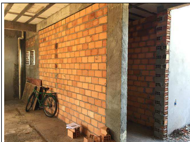
Figura 11C: Paredes internas.