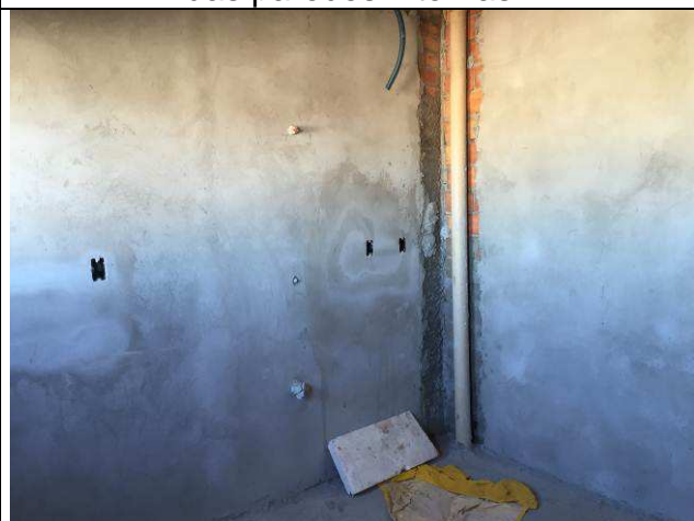
Figura 42C: Revestimento argamassado das paredes internas.