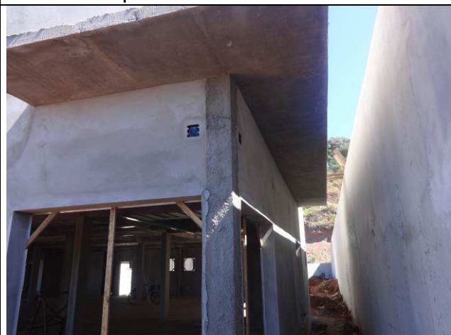
Figura 17E: caixas para CFTV e alarme patrimonial - externo.