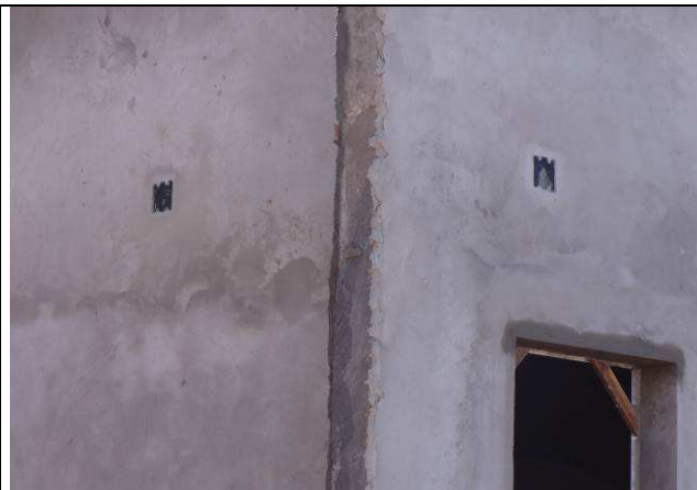
Figura 16E: caixas para CFTV e alarme patrimonial - externo.