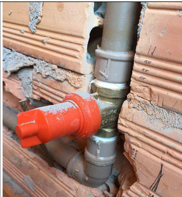
Figura 62C: Registro de pressão - banheiro do arquivo.