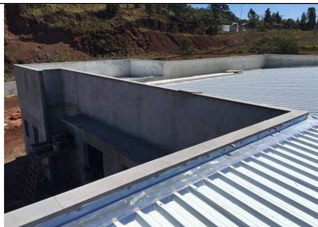
Figura 29C: Capeamento das platibandas e rufos.