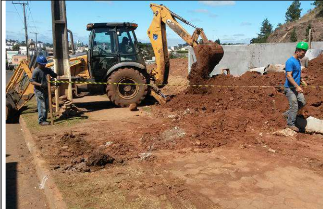
Figura 03C: Escavação de valas - redes de esgoto e águas pluviais.