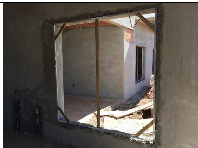
Figura 21C: Contramarcos instalados.