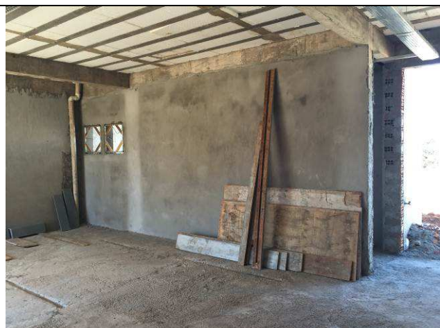
Figura 37C: Revestimento argamassado das paredes internas.