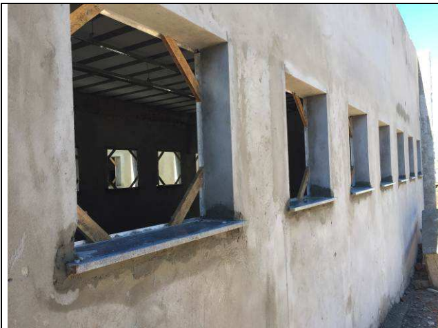
Figura 15C: Contramarcos instalados.