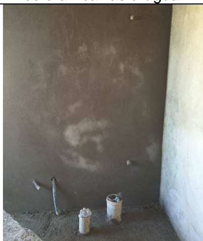
Figura 59C: Registro de gaveta - sala da OAB.