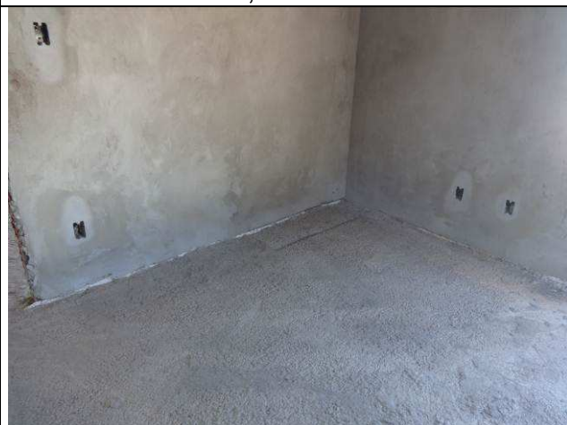
Figura 10E: caixas 2x4" embutidas em alvenaria, eletrodutos 1".