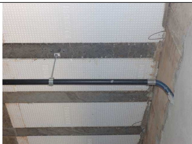
Figura 05E: eletrodutos 1" entre eletrocalhas, perfilados e as descidas.