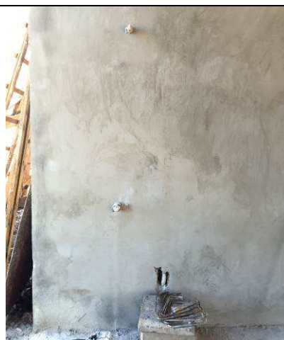
Figura 60C: Registro de gaveta - bebedouro do hall público.