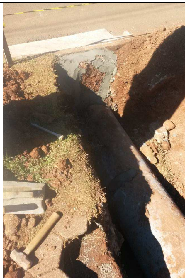
Figura 68C: Interligação da tubulação de águas pluviais na rede pública.