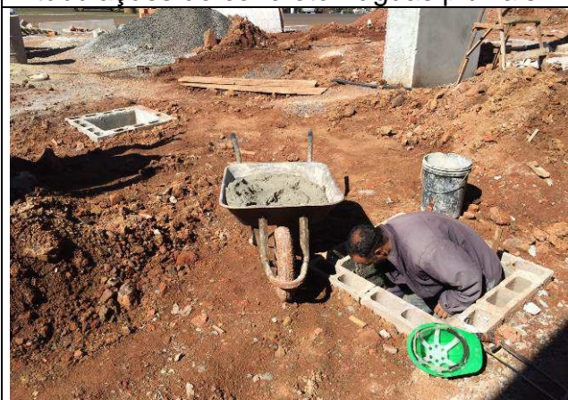
Figura 73C: Caixa de inspeção de águas pluviais - execução do revestimento.