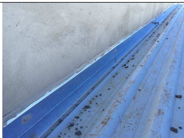
Figura 33C: Rufos.