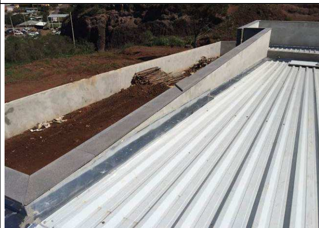
Figura 30C: Capeamento das platibandas e rufos.