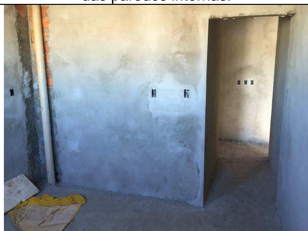
Figura 43C: Revestimento argamassado das paredes internas.