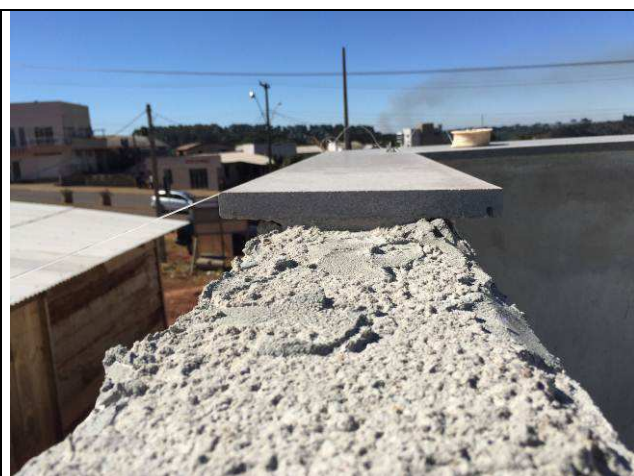
Figura 26C: Capeamento das platibandas.