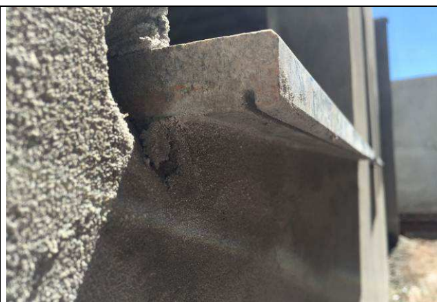
Figura 52C: Peitoris em granito.