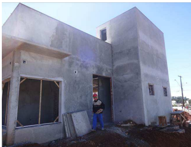
Figura 13E: caixas iluminação externa.