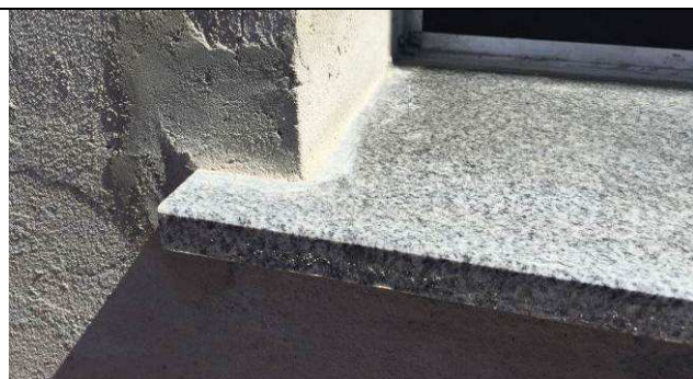
Figura 55C: Peitoris em granito.