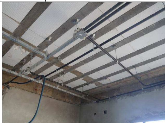
Figura 18E: perfilados, eletrodutos e caixas rede lógica.