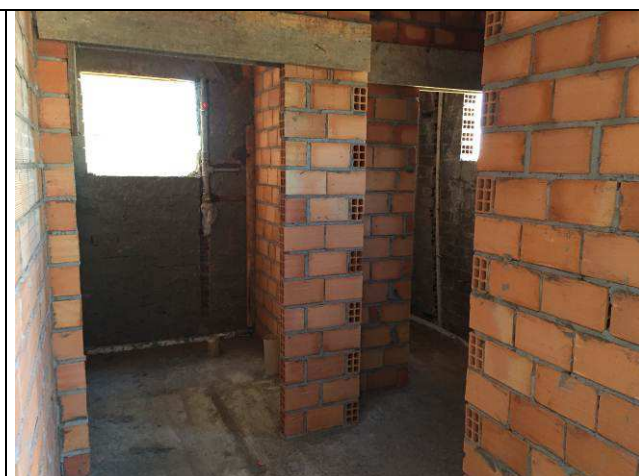
Figura 12C: Paredes internas.