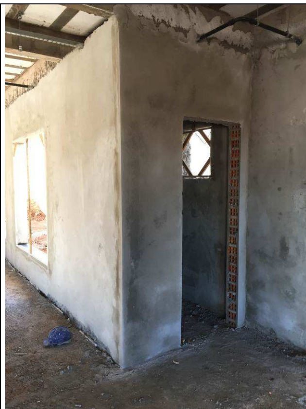
Figura 46C: Revestimento argamassado das paredes internas.