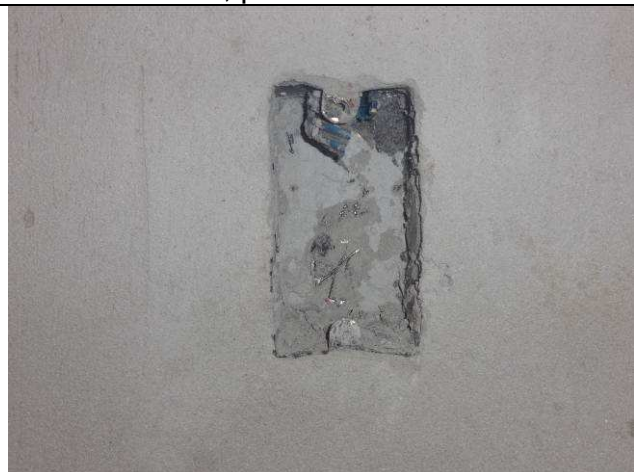
Figura 07E: caixas 2x4" embutidas em alvenaria, eletrodutos 1".