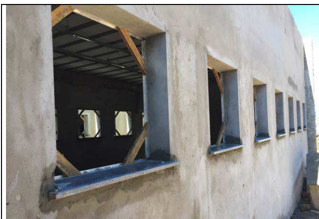
Figura 51C: Peitoris em granito.