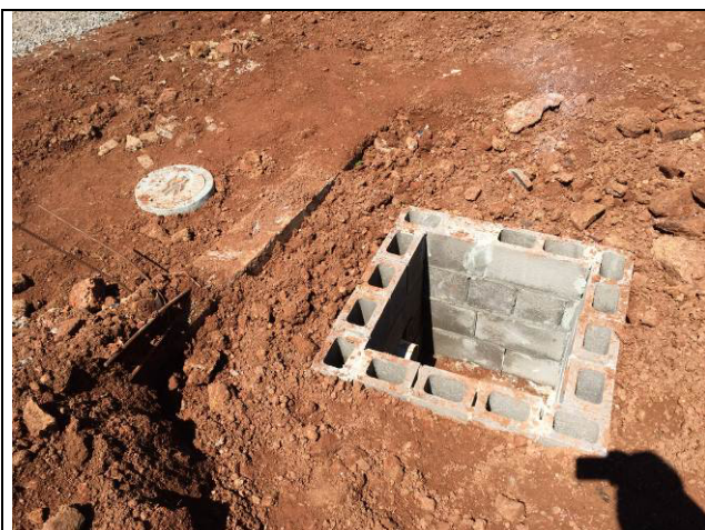
Figura 01C: Ligeira definitiva de esgoto com a rede pública.