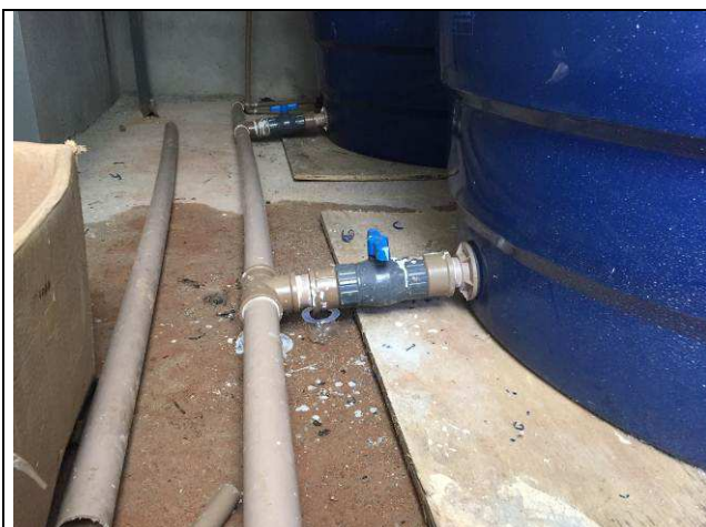
Figura 57C: Tubulações e registros de esfera - caixas d' água.