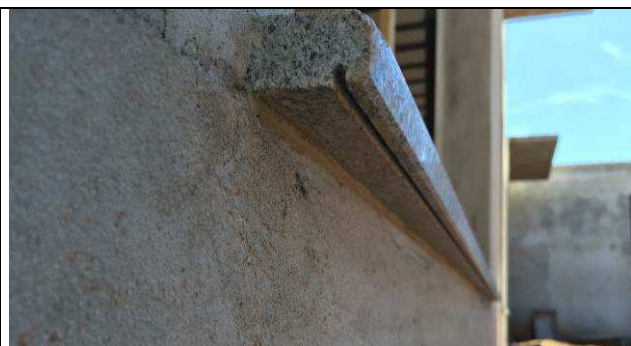
Figura 56C: Peitoris em granito.