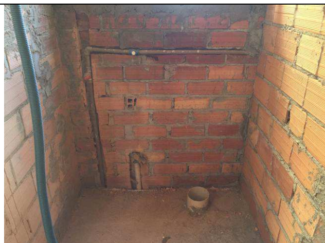
Figura 65C: Pontos de água fria - área de serviço do arquivo.