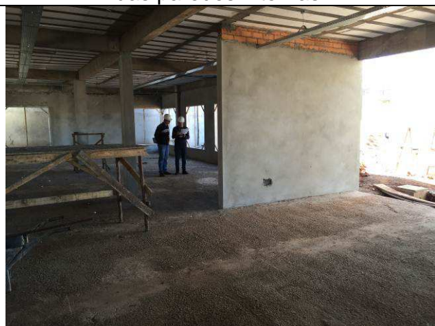
Figura 41C: Revestimento argamassado das paredes internas.