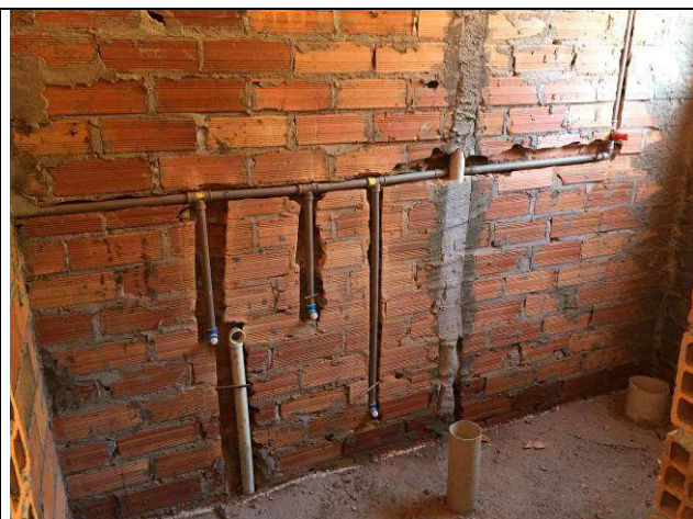
Figura 66C: Pontos de água fria - banheiro do arquivo.