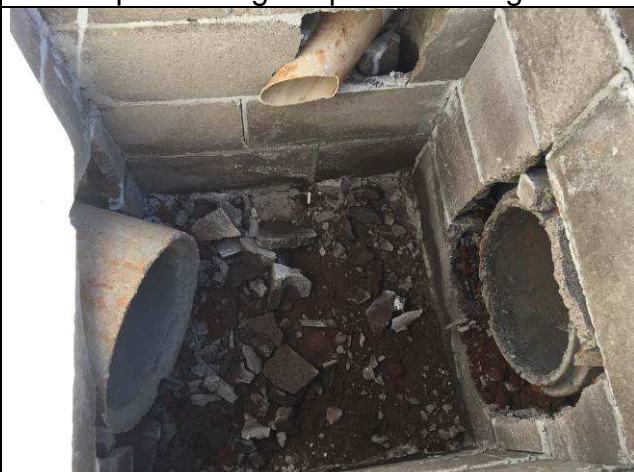
Figura 72C: Caixa de inspeção e tubulações de concreto - águas pluviais.