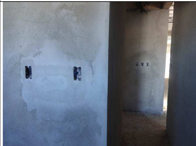
Figura 08E: caixas 2x4" embutidas em alvenaria, eletrodutos 1".