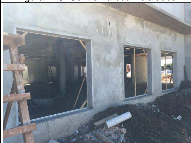
Figura 19C: Contramarcos instalados.