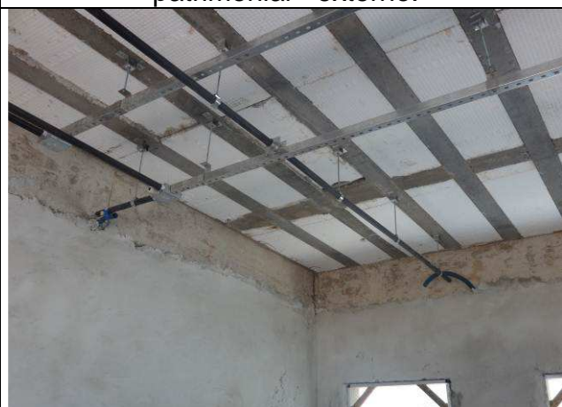
Figura 19E: perfilados, eletrodutos e caixas rede lógica.