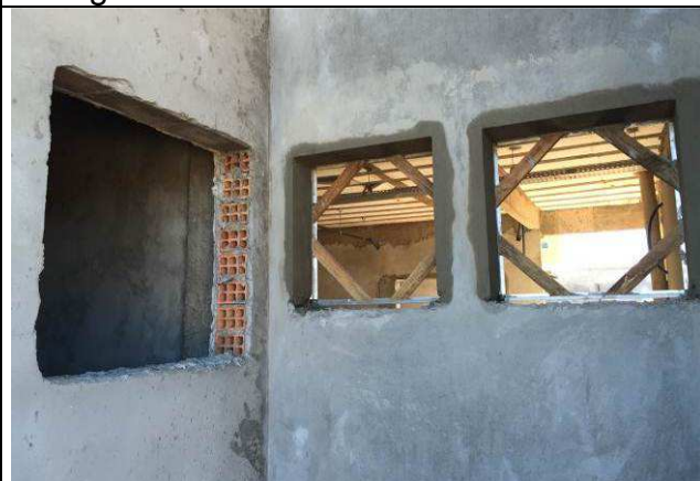
Figura 24C: Contramarcos instalados.