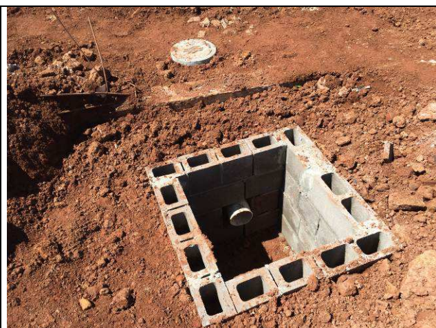
Figura 02C: Ligeira definitiva de esgoto com a rede pública.