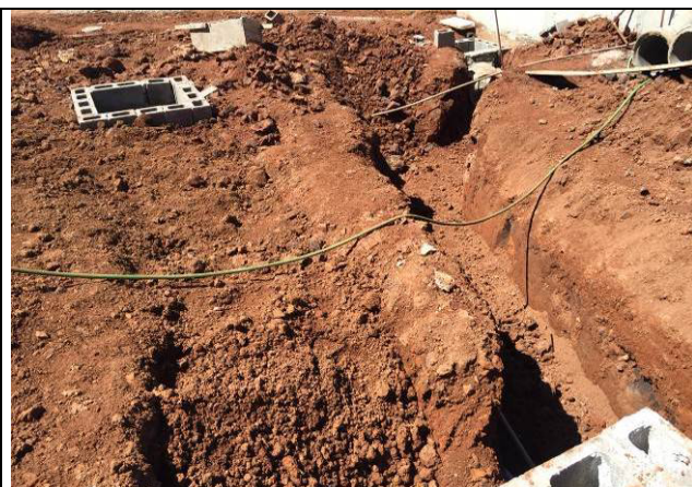
Figura 10C: Valas aterradas.