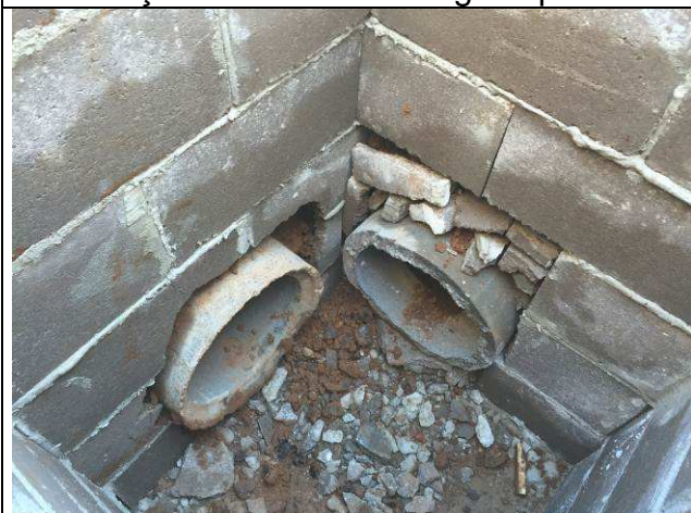
Figura 71C: Caixa de inspeção e tubulações de concreto - águas pluviais.