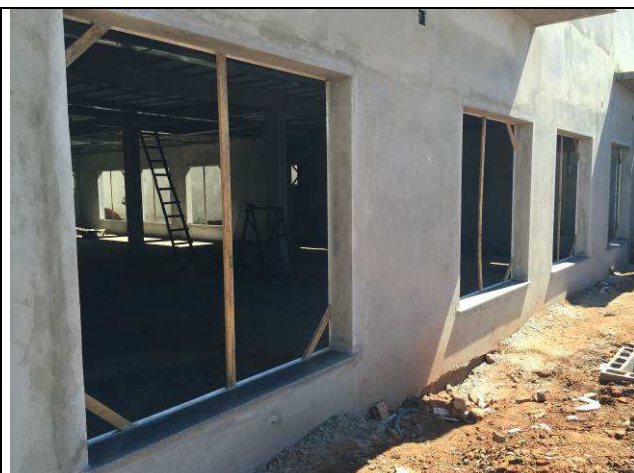
Figura 22C: Contramarcos instalados.