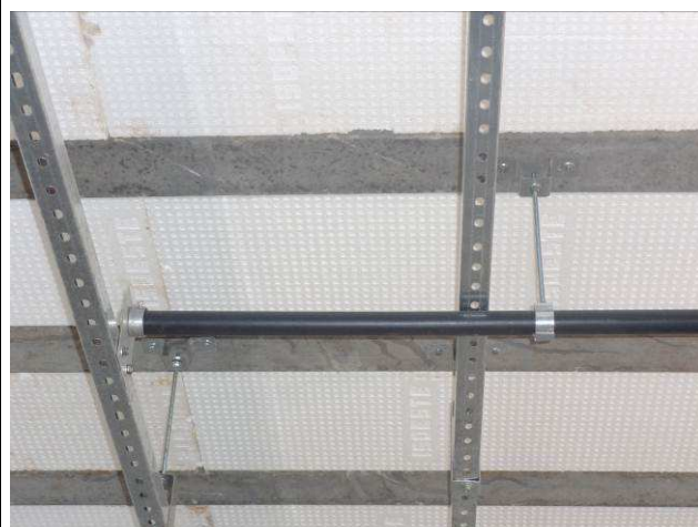
Figura 04E: perfilados OAB e arquivo.