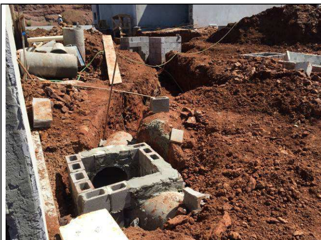
Figura 69C: Caixa de inspeção e tubulações de concreto - águas pluviais.