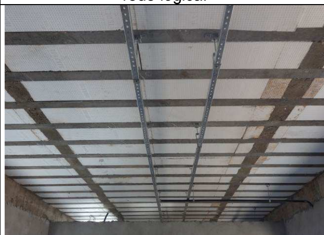
Figura 20E: perfilados, eletrodutos e caixas rede lógica.