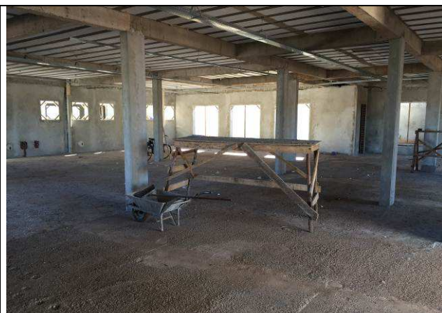
Figura 40C: Revestimento argamassado das paredes internas.