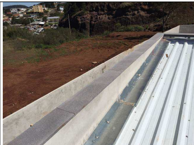
Figura 28C: Capeamento das platibandas e rufos.