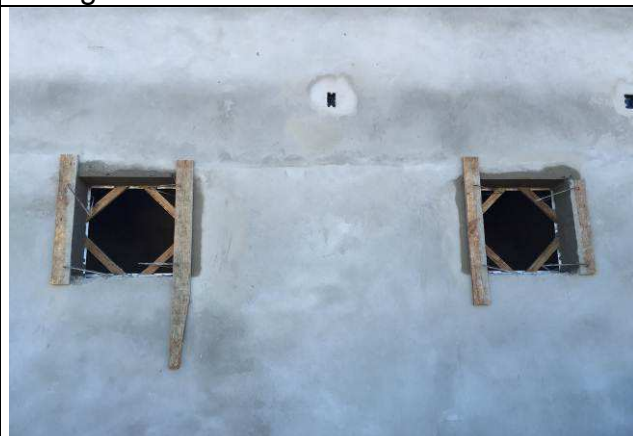
Figura 23C: Contramarcos instalados.