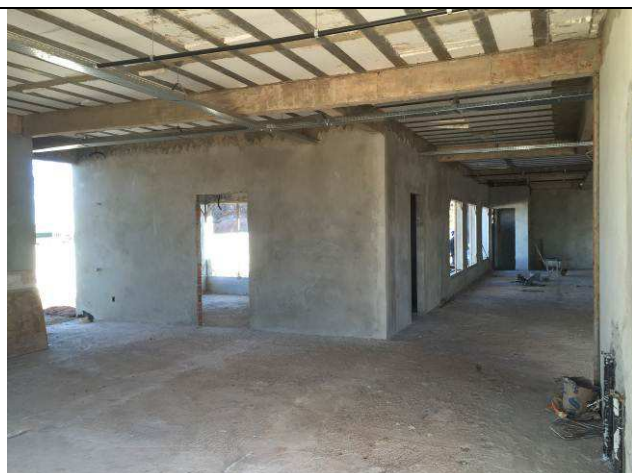
Figura 38C: Revestimento argamassado das paredes internas.