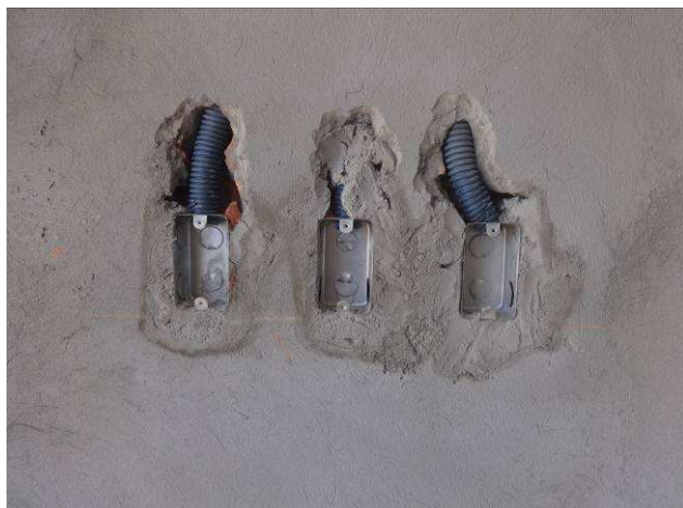
Figura 11E: caixas 2x4" embutidas em alvenaria, eletrodutos 1".