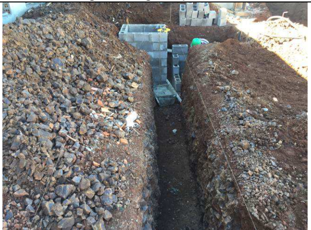
Figura 06C: Escavação de valas - redes de esgoto e águas pluviais.