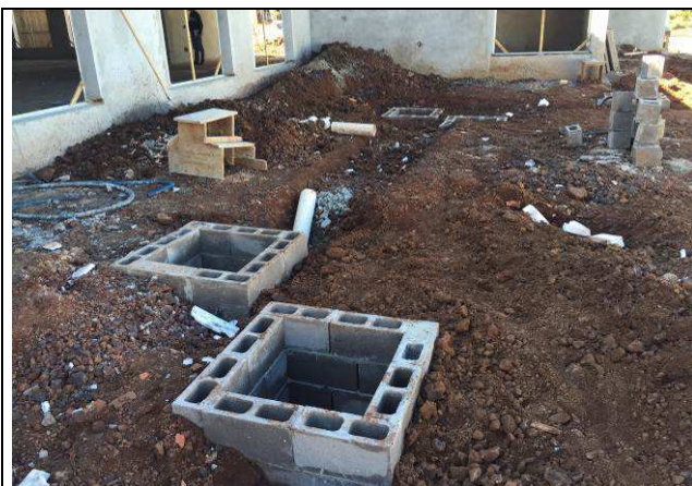
Figura 09C: Valas aterradas.