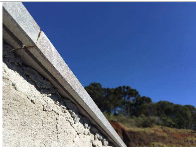
Figura 27C: Capeamento das platibandas.