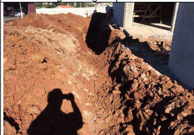
Figura 07C: Escavação de valas - redes de esgoto e águas pluviais.