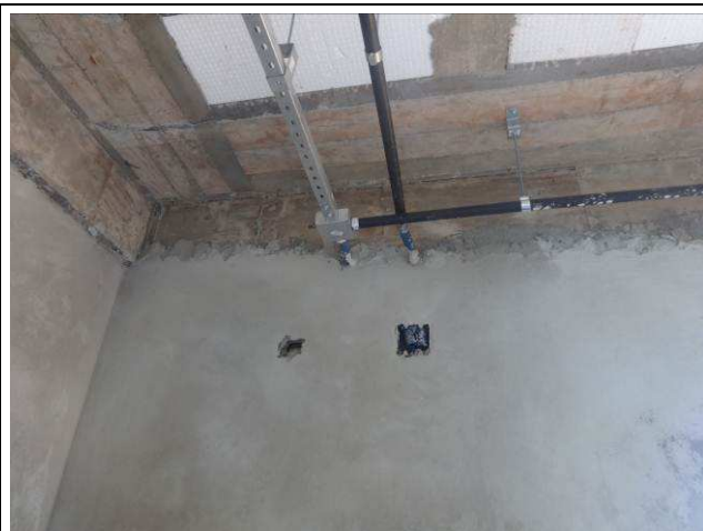
Figura 22E: perfilados, eletrodutos e caixas rede lógica (OAB).