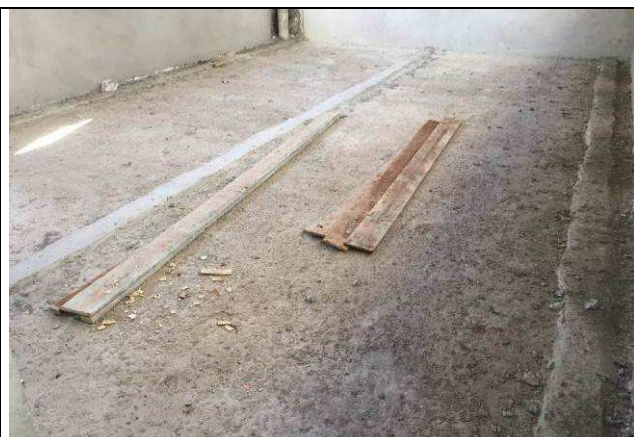
Figura 50C: Contrapiso - lastro de concreto armado com tela metálica - arquivo.