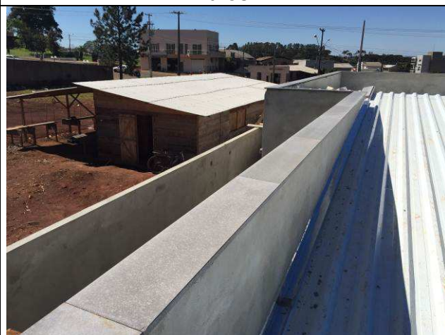
Figura 32C: Capeamento das platibandas e rufos.