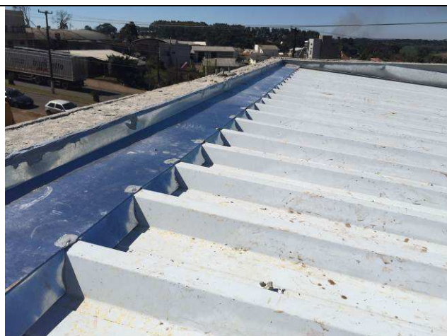
Figura 34C: Rufos.