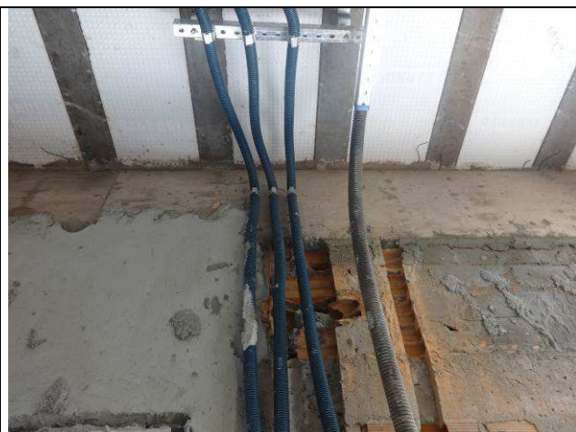
Figura 06E: eletrodutos arquivo.