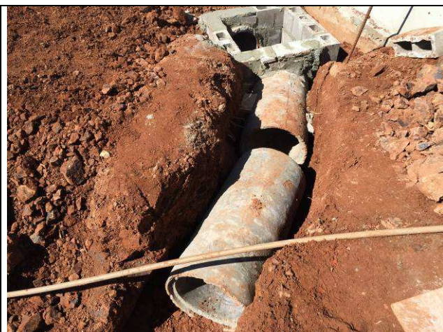
Figura 70C: Caixas de inspeção da lateral esquerda - águas pluviais e esgoto.