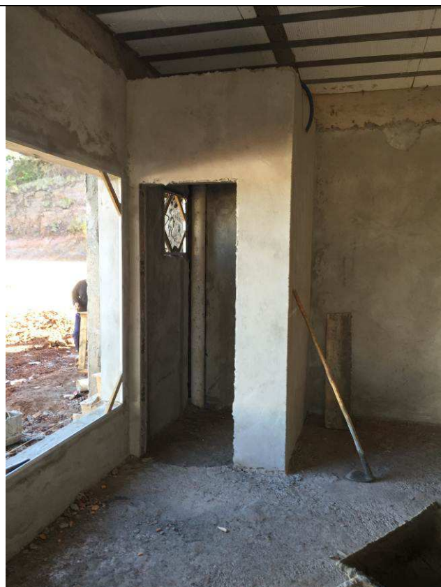
Figura 45C: Revestimento argamassado das paredes internas.