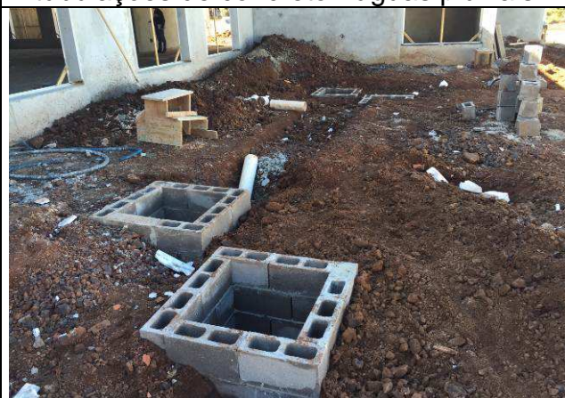
Figura 74C: Caixas de inspeção da lateral esquerda - águas pluviais e esgoto.