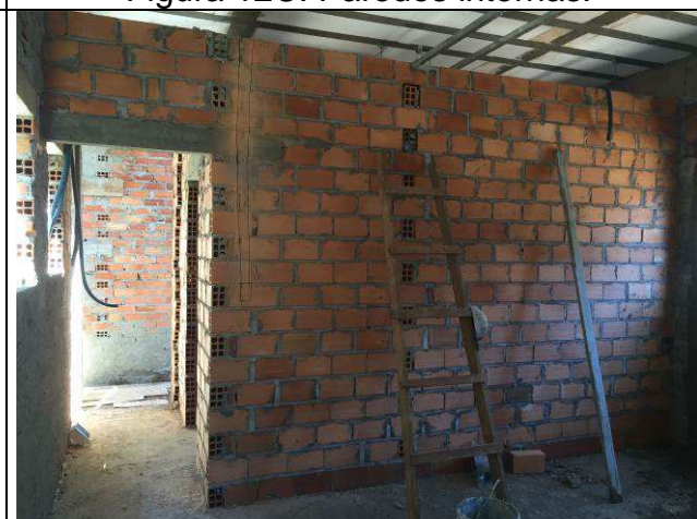
Figura 14C: Paredes internas-arquivo.