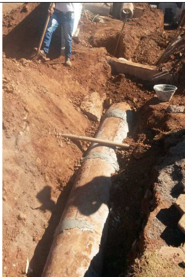
Figura 67C: Interligação da tubulação de águas pluviais na rede pública.