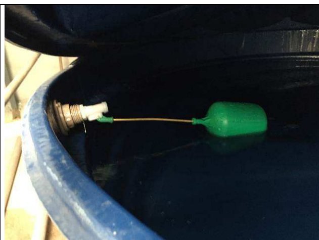
Figura 58C: Bóias - caixas d' água.