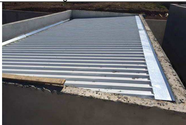
Figura 36C: Rufos.