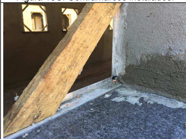
Figura 17C: Contramarcos instalados.