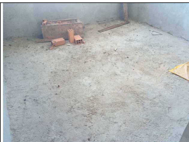
Figura 48C: Contrapiso - lastro de concreto armado com tela metálica.