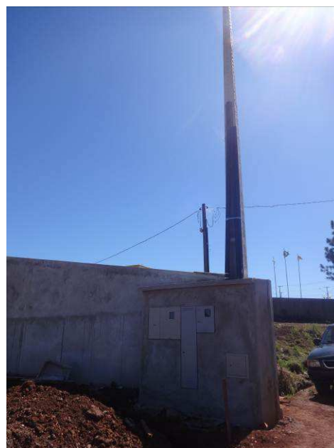
Figura 02E: eletrodutos entrada de energia e telecomunicações.