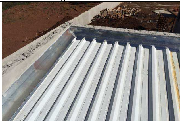
Figura 35C: Rufos.