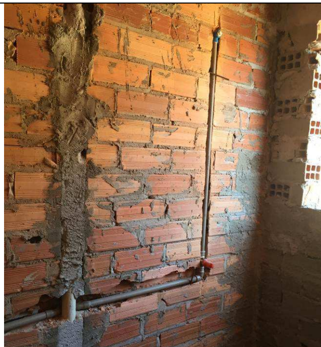
Figura 61C: Registro de pressão - banheiro do arquivo.