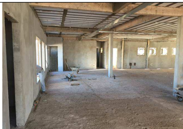
Figura 39C: Revestimento argamassado das paredes internas.