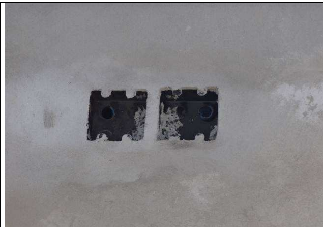
Figura 15E: caixas para CFTV e alarme patrimonial - externo.