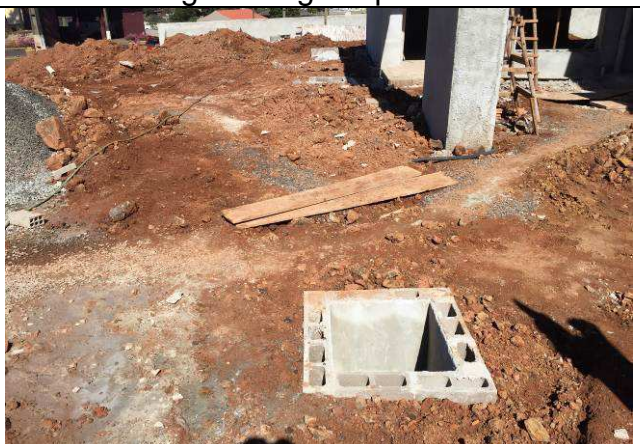
Figura 08C: Valas aterradas.