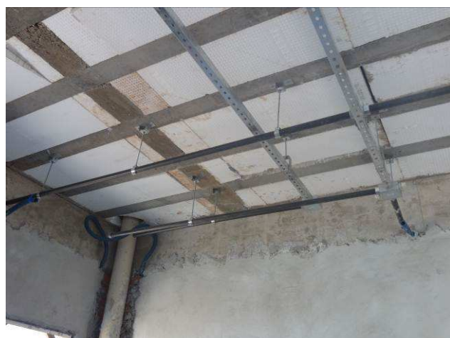
Figura 03E: perfilados OAB e arquivo.