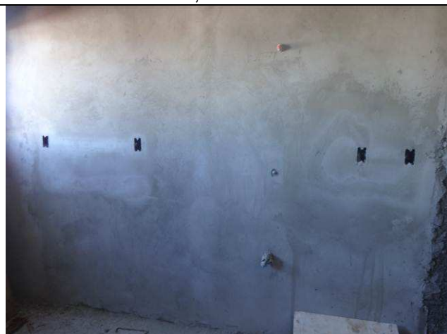
Figura 09E: caixas 2x4" embutidas em alvenaria, eletrodutos 1".