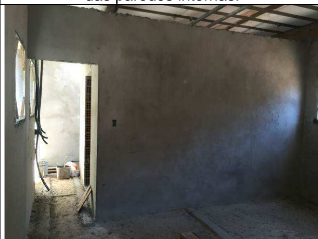
Figura 44C: Revestimento argamassado das paredes internas - arquivo.