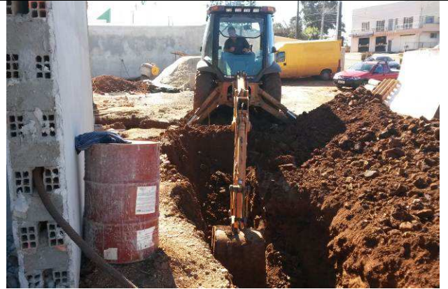
Figura 04C: Escavação de valas - redes de esgoto e águas pluviais.