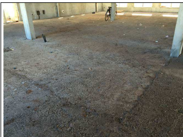
Figura 47C: Contrapiso - lastro de concreto armado com tela metálica.