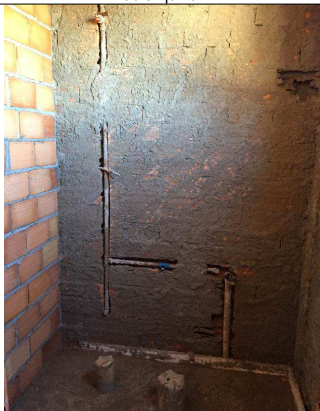
Figura 63C: Pontos de água fria - banheiros públicos.