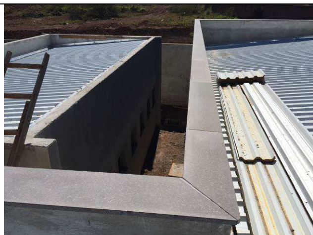
Figura 31C: Capeamento das platibandas e rufos.