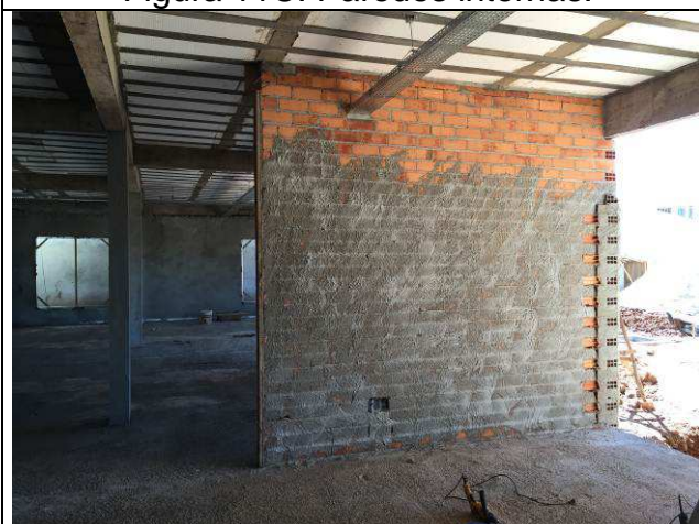
Figura 13C: Paredes internas.