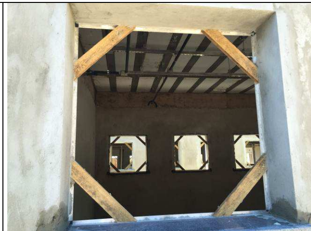
Figura 16C: Contramarcos instalados.