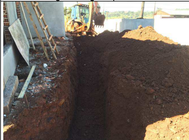
Figura 05C: Escavação de valas - redes de esgoto e águas pluviais.