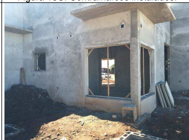
Figura 20C: Contramarcos instalados.