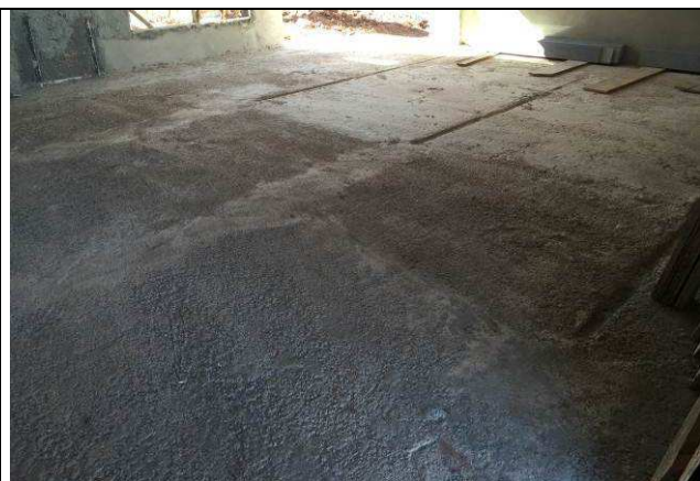
Figura 49C: Contrapiso - lastro de concreto armado com tela metálica.