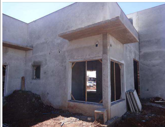
Figura 14E: caixas iluminação externa.