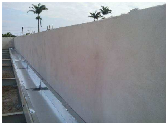
Figura 17C: Trecho de calha instalado sobre o prédio principal