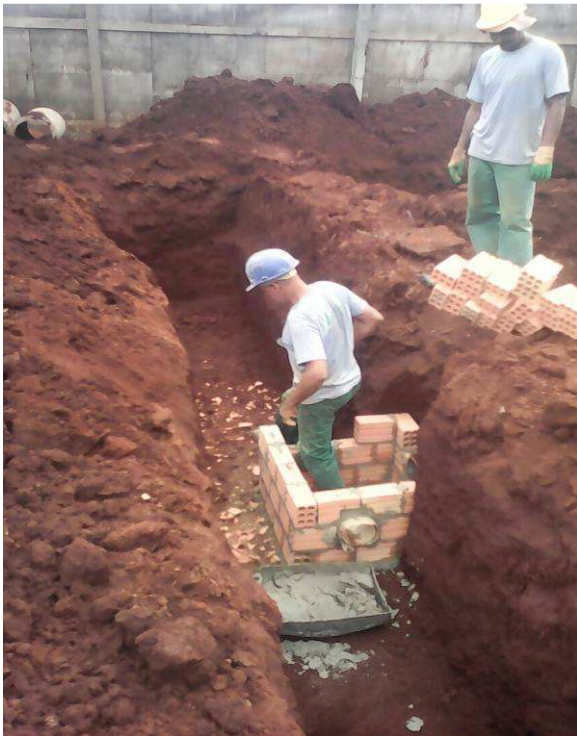
Figura 01A1: Início da execução de vala de drenagem - vala aberta