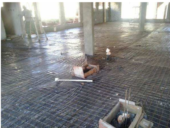
Figura 20C: Lona plástica de PVC colocada sobre a camada apoitada de brita