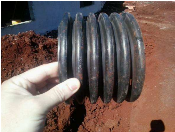
Figura 06A1: Detalhe do tubo corrugado-perfurado de 150mm, utilizado para dispersar a água