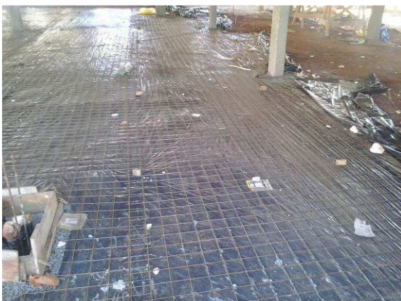
Figura 40C: No detalhe a aplicação da tela soldada no contrapiso da secretaria