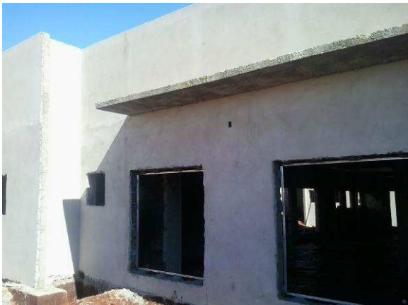
Figura 08C: Detalhe de instalação de contramarco em vão para esquadria de 180x180cm (fachada leste)