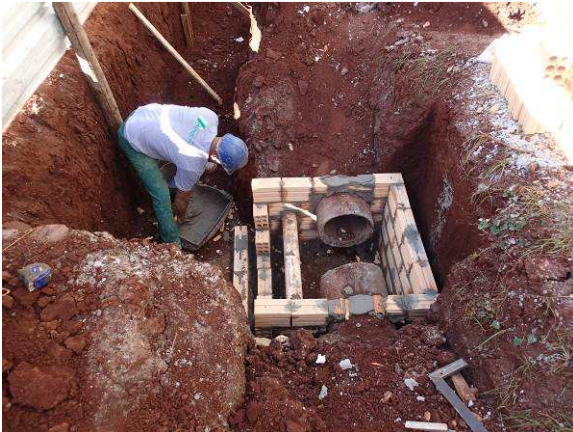
Figura 53C: Detalhe da chegada dos tubos concreto 200mm em caixa de inspeção pluvial