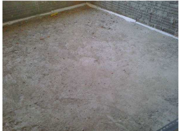
Figura 43C: Contrapiso executado na copa