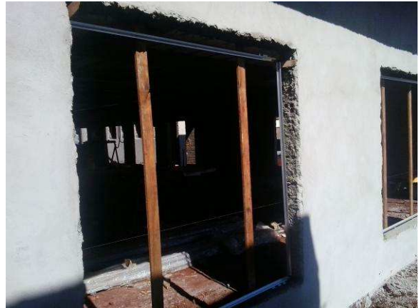
Figura 07C: Detalhe de instalação de contramarco em vão para esquadria de 180x180cm (fachada frontal)