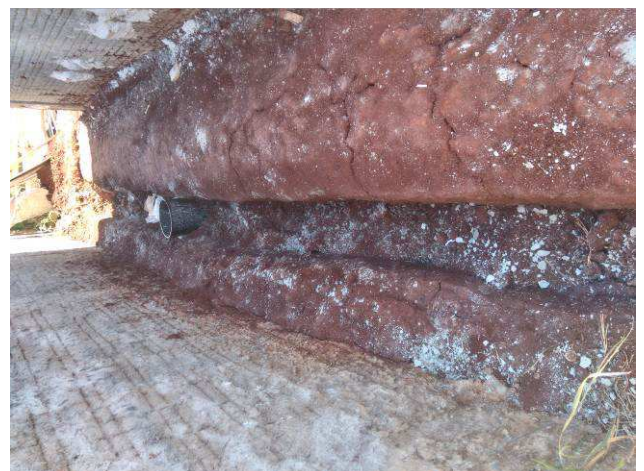
Figura 26E: SPDA - escavação para malha de aterramento.