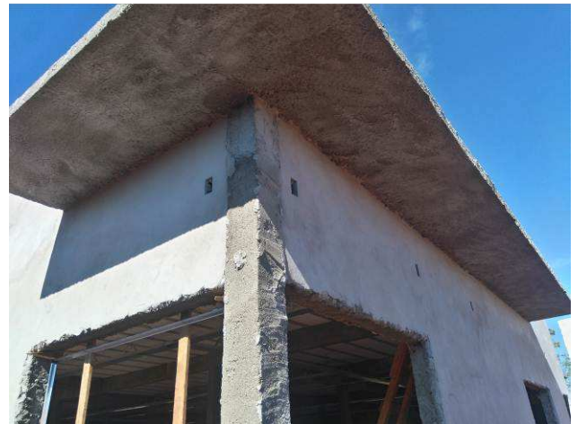
Figura 18E: infraestrutura - caixas 2x4"