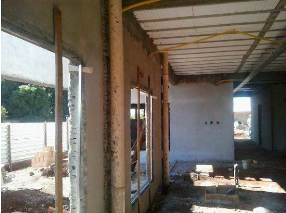
Figura 47C: Tubos de captação pluvial, no prédio principal