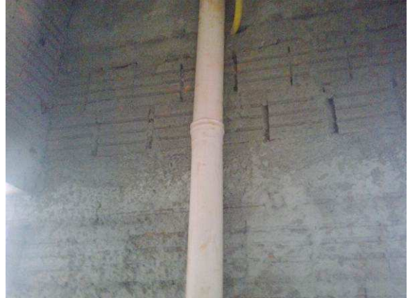
Figura 48C: Tubo de 75mm, de captação pluvial da cobertura do reservatório