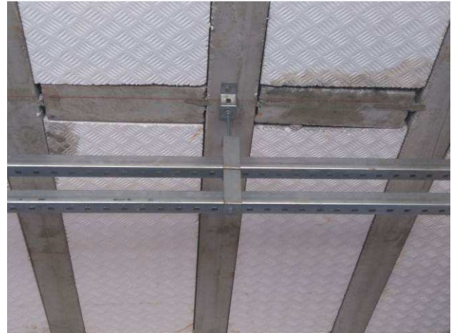
Figura 22E: infraestrutura - perfilados rede lógica.