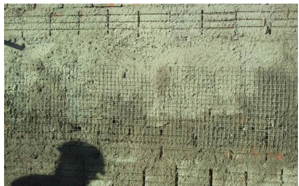
Figura 29C: Tela soldada para prevenção de trincas, após aplicação de chapisco