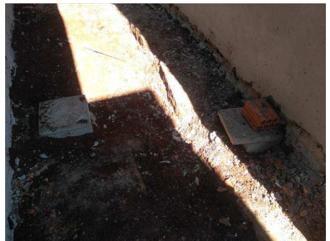
Figura 08E: infraestrutura externa - caixas 30x30 entre prédio e arquivo.