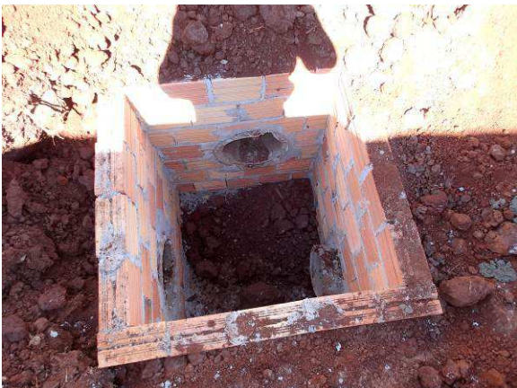
Figura 51C: Caixa de inspeção pluvial, tamanho 80x80cm