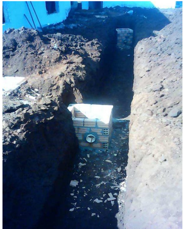
Figura 02A1: Vala de drenagem aberta e caixas prontas, aguardando instalação da manta bidim