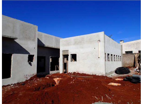
Figura 03C: Realização de remoção da camada vegetal e início da adequação do nível do terreno