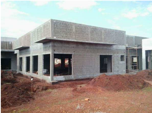
Figura 32C: Trecho das fachadas norte e oeste, com chapisco executado