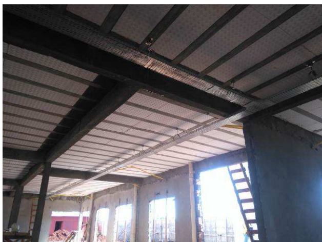
Figura 11E: infraestrutura interna - eletrocalhas, acessórios, perfilados.