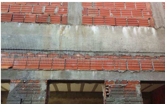
Figura 28C: Tela soldada para prevenção de trincas, fixada entre viga e alvenaria (encunhamento)