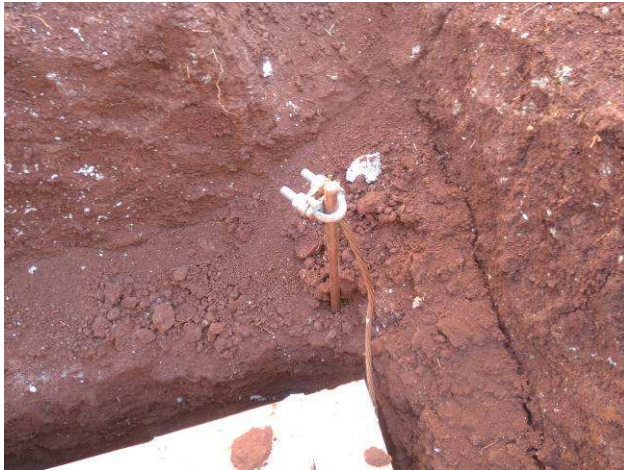
Figura 27E: SPDA - malha de aterramento, cabos #50mm 2 cobre nu, haste.