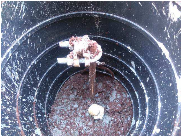
Figura 29E: SPDA - malha de aterramento, cabos #50mm 2 cobre nu, haste, caixa inspeção.