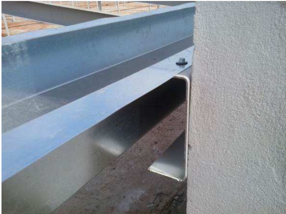
Figura 18C: Detalhe da fixação da calha na terça metálica