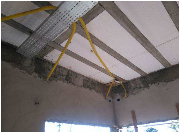
Figura 23E: infraestrutura - caixas 2x4", condutores, eletrodutos.