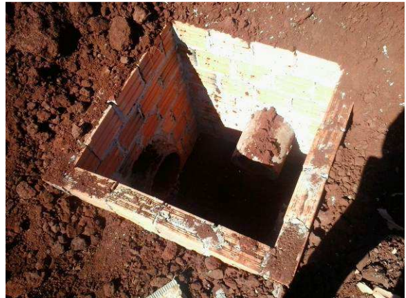
Figura 50C: Caixa de inspeção pluvial, tamanho 80x80cm