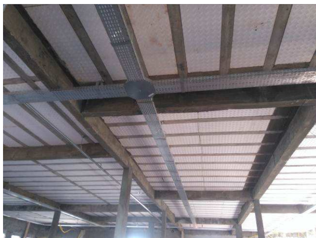
Figura 10E: infraestrutura interna - eletrocalhas, acessórios, perfilados.