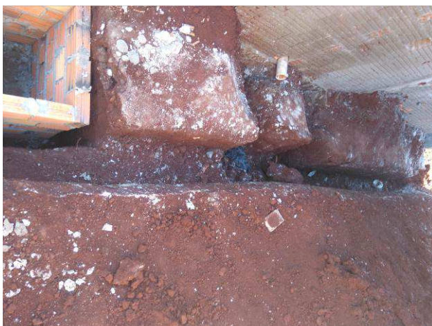
Figura 25E: SPDA - escavação para malha de aterramento.