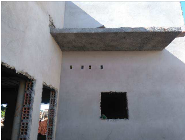
Figura 17E: infraestrutura - caixas 2x4"