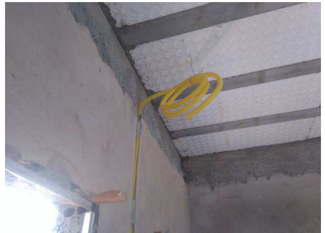
Figura 24E: infraestrutura - eletrodutos.