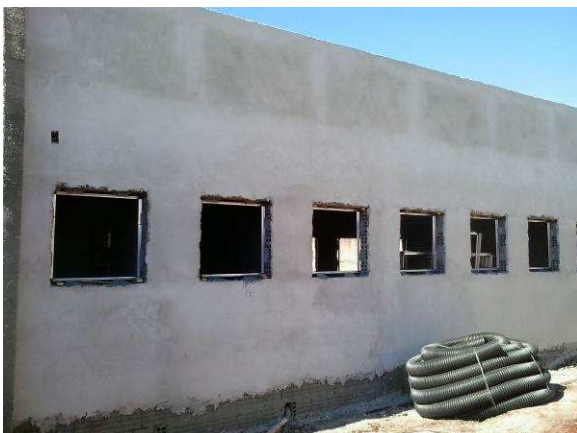
Figura 10C: Detalhe de instalação de contramarco em vão para esquadria de 80x80cm (arquivo - fachada oeste)