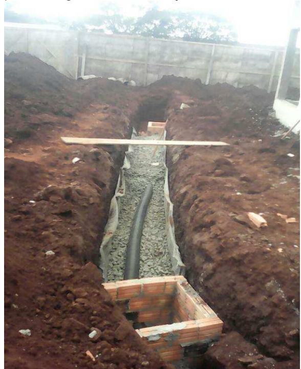
Figura 04A1: Com a manta aplicada, foi instalado tubo corrugado perfurado e o lastro de brita 2, em seguida foi fechada a parede superior da manta