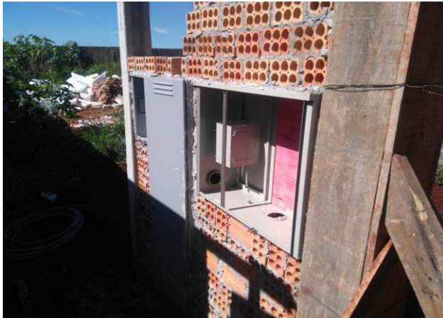
Figura 03E: entrada de energia elétrica - poste, mureta, caixas CN1, barramento e GNE.