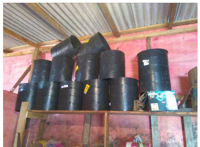
Figura 32E: SPDA - caixas de inspeção.