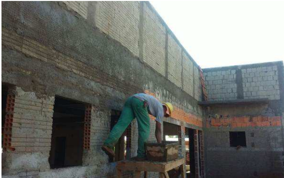
Figura 30C: Tela soldada para prevenção de trincas, recebendo chapisco