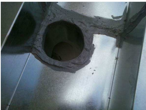
Figura 16C: Imagem de bocal de captação em calha, já com vedação finalizada