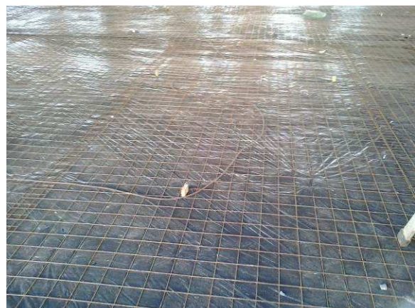
Figura 41C: Tela soldada aplicada, aguardando lançamento do concreto