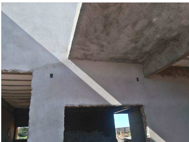
Figura 19E: infraestrutura - caixas 2x4"