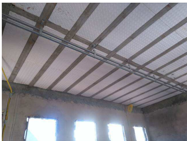
Figura 14E: infraestrutura interna - eletrocalhas, acessórios, perfilados.