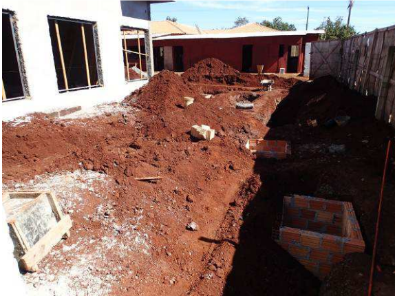
Figura 02C: Realização de remoção da camada vegetal e início da adequação do nível do terreno