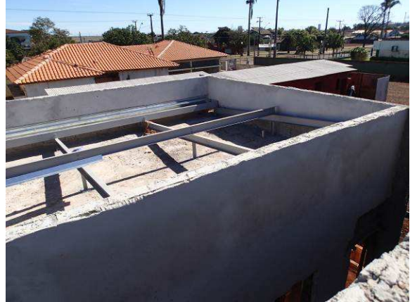
Figura 13C: Estrutura de cobertura do arquivo