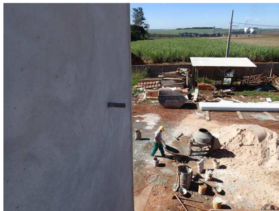
Figura 01C: vista parcial do canteiro de obras, com a caçamba de destinação de entulhos ao fundo