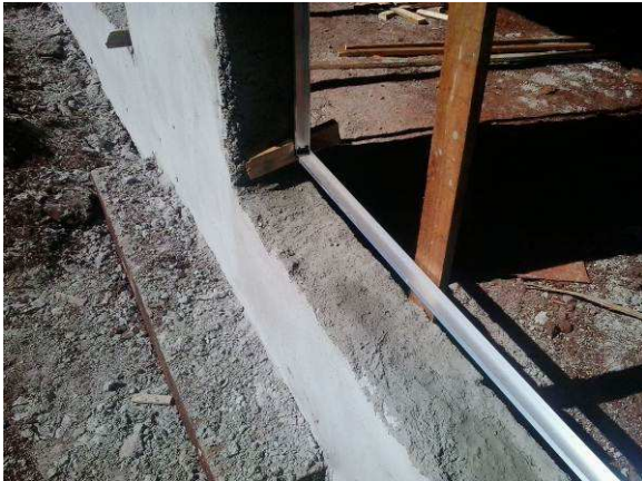
Figura 06C: Detalhe de instalação de contramarco em vão para esquadria de 180x180cm