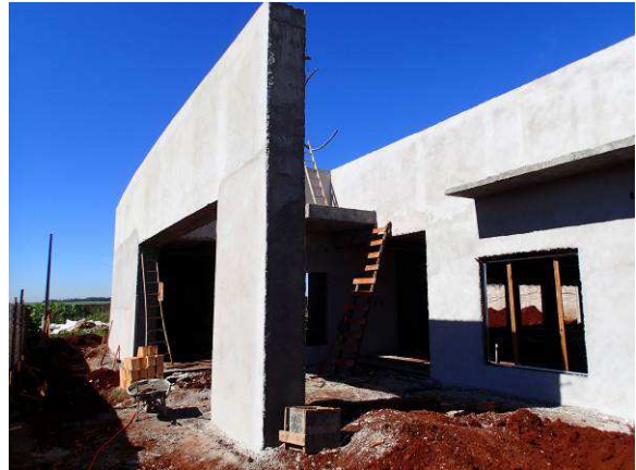
Figura 37C: Reboco do volume e demais segmentos, na fachada frontal