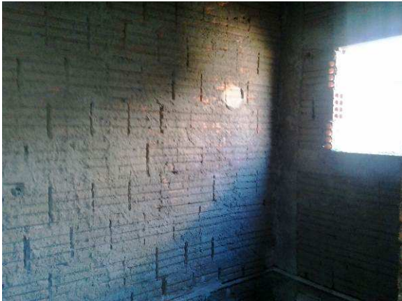
Figura 24C: Chapisco realizado em sanitário da secretaria