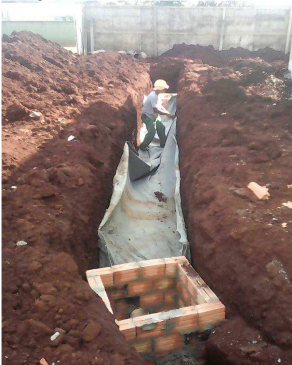
Figura 03A1: Aplicação da manta bidim