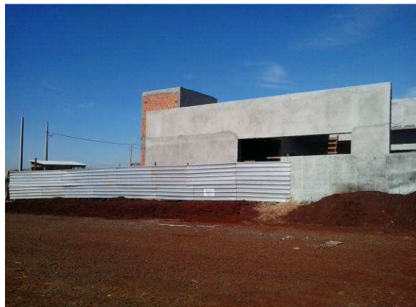
Figura 05C: Parede frontal do PAB e do volume (pórtico), já finalizadas e rebocadas