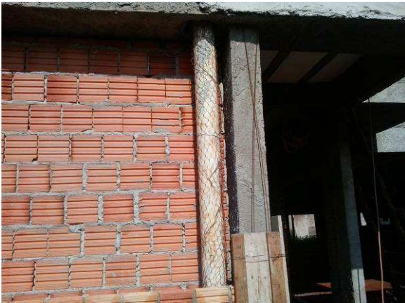
Figura 49C: Detalhe do entelamento de tubo, para evitar trincas no revestimento e melhorar a aderência do reboco