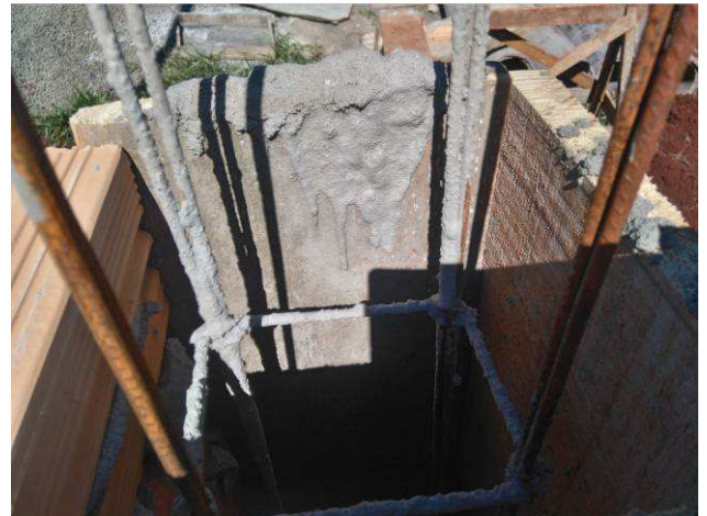
Figura 06E: entrada de energia elétrica - baldrame, estrutura mureta.