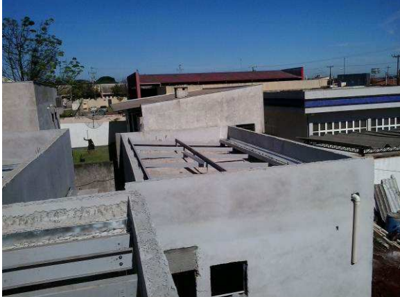
Figura 12C: Estrutura de cobertura do arquivo