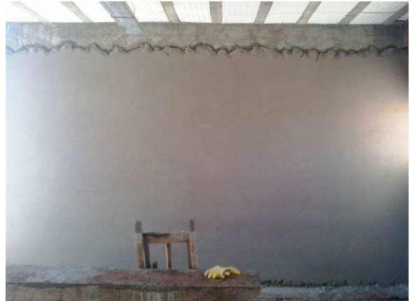
Figura 25C: Reboco realizado em parede do PAB