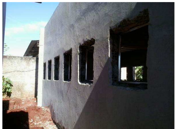
Figura 11C: Detalhe de instalação de contramarco em vão para esquadria de 80x80cm (arquivo - fachada leste)