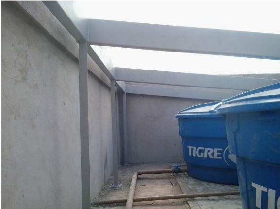
Figura 14C: Estrutura de cobertura do reservatório