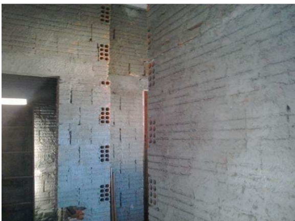
Figura 22C: Chapisco executado em parede dos sanitários públicos