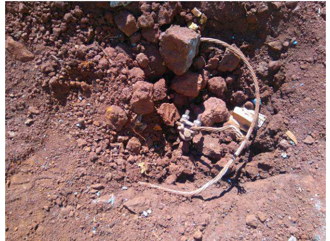
Figura 28E: SPDA - malha de aterramento, cabos #50mm 2 cobre nu, haste.