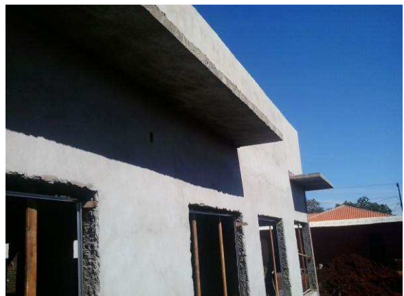
Figura 35C: Fachada frontal após o rebôco