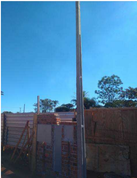
Figura 01E: entrada de energia elétrica - poste, mureta, caixas CN1, barramento e GNE.