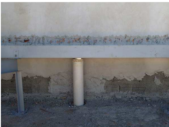
Figura 45C: Tubulação de PVC pluvial de 150mm, na descida de calha da secretaria