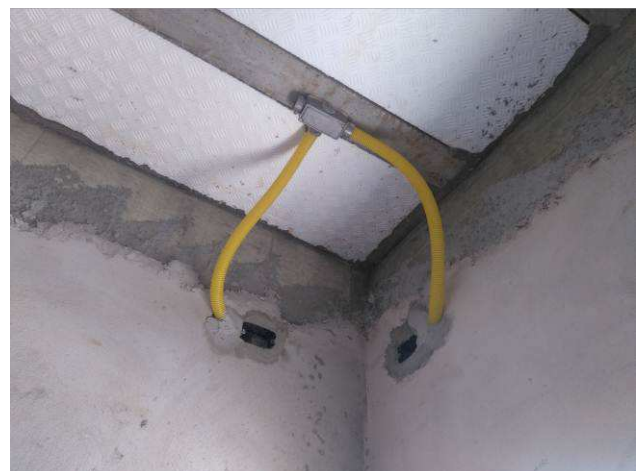
Figura 20E: infraestrutura - caixas 2x4", condutores, eletrodutos.