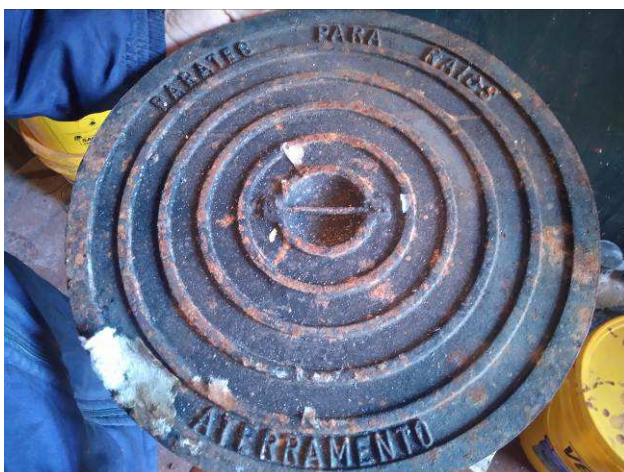
Figura 31E: SPDA - tampas para caixas de inspeção.