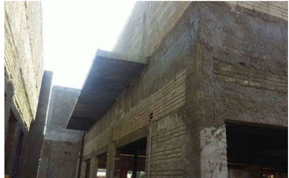
Figura 31C: Tela soldada para prevenção de trincas, após receber camada de chapisco