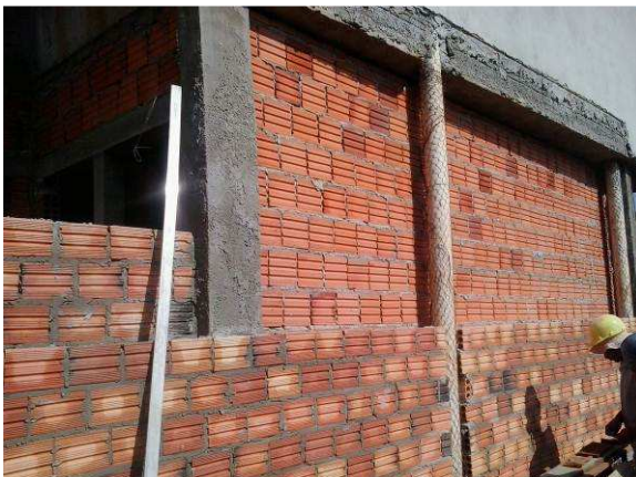
Figura 04C: Início da execução da parede dupla do PAB