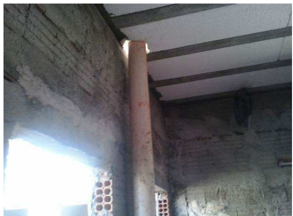
Figura 46C: Tubulação de PVC de 100mm fazendo a captação pluvial sobre a área da copa