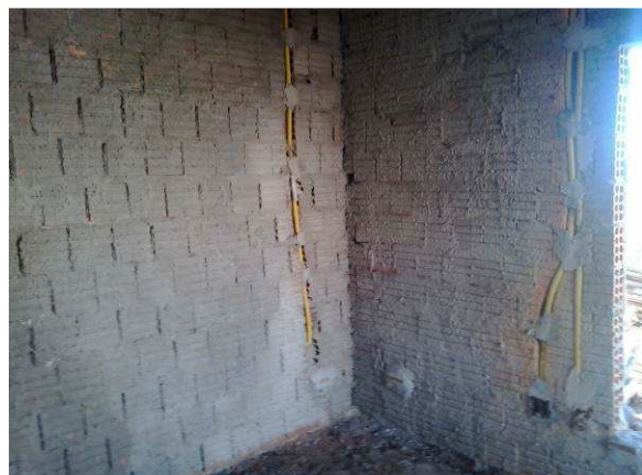
Figura 23C: Chapisco realizado em parede da sala OAB