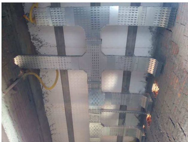
Figura 09E: infraestrutura interna - eletrocalhas, acessórios, perfilados.