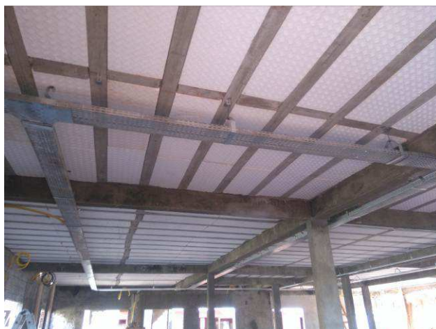
Figura 12E: infraestrutura interna - eletrocalhas, acessórios, perfilados.