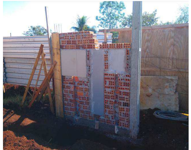
Figura 02E: entrada de energia elétrica - poste, mureta, caixas CN1, barramento e GNE.