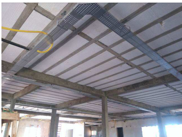
Figura 13E: infraestrutura interna - eletrocalhas, acessórios, perfilados.