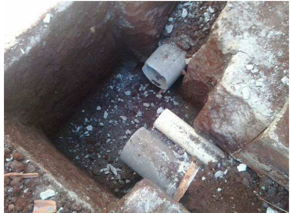
Figura 54C: Detalhe da chegada dos tubos concreto 200mm e 300mm e tubo de PVC 100mm em local previsto para execução de caixa de inspeção pluvial