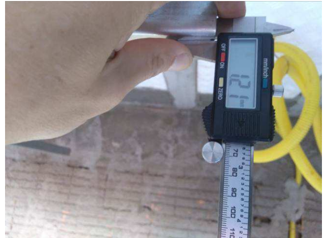
Figura 16E: infraestrutura interna - espessura perfilados chapa #18.