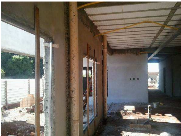
Figura 26C: Reboco realizado em face interna de parede da secretaria