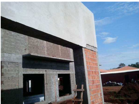
Figura 34C: Chapisco da fachada frontal