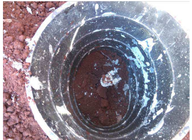
Figura 30E: SPDA - malha de aterramento, cabos #50mm 2 cobre nu, haste, caixa inspeção.