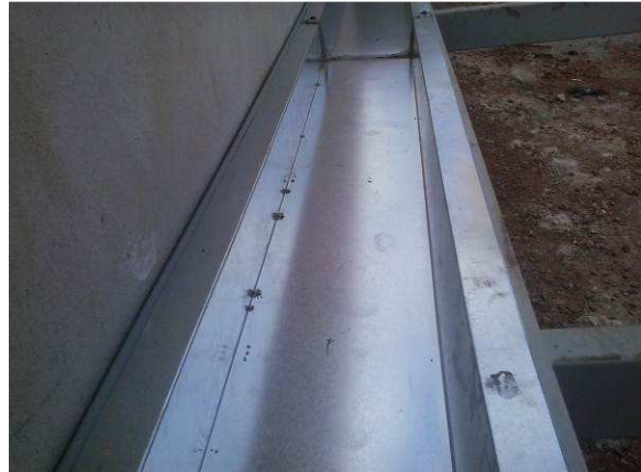
Figura 15C: No detalhe, perfil de calha instalada sobre a área da secretaria