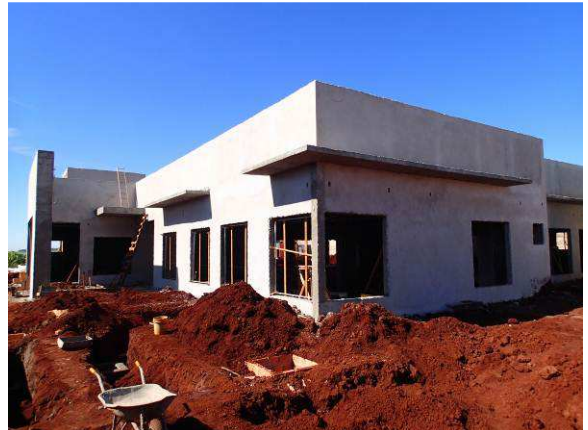
Figura 33C: Trecho das mesmas fachadas da imagem anterior, após a aplicação do rebôco