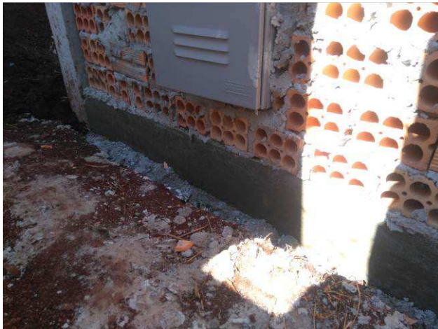
Figura 05E: entrada de energia elétrica - baldrame, estrutura mureta.