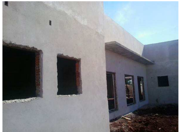
Figura 09C: Detalhe de instalação de contramarco em vão para esquadria de 180x180cm (fachada dos fundos)