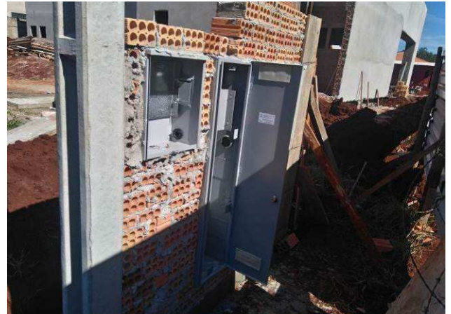
Figura 04E: entrada de energia elétrica - poste, mureta, caixas CN1, barramento e GNE.