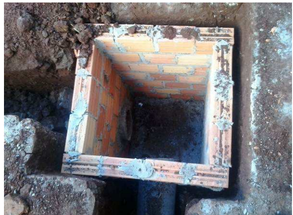
Figura 52C: Caixa de inspeção pluvial, tamanho 60x60cm