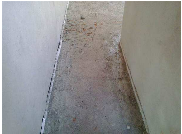
Figura 44C: Contrapiso executado na copa e sanitários