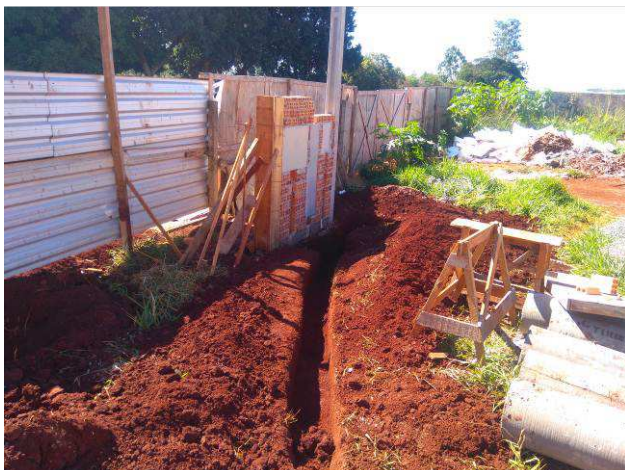
Figura 07E: infraestrutura externa - escavação para caixa e dutos enterrados.