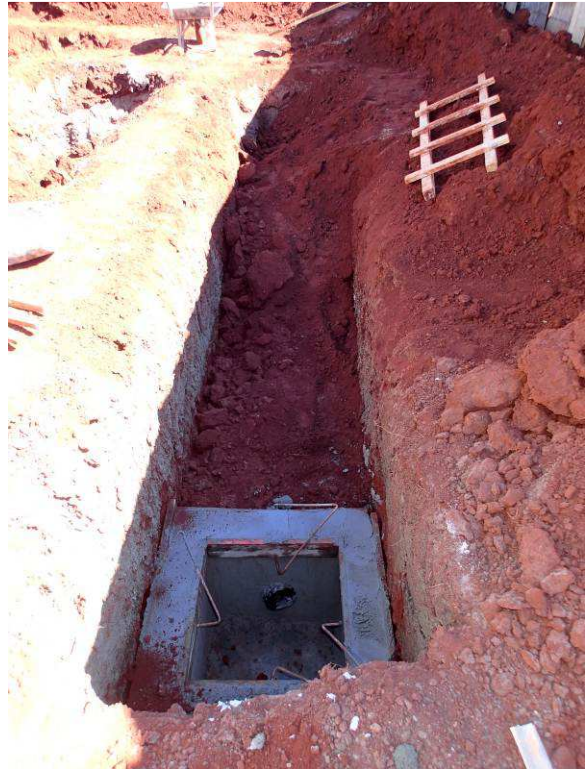
Figura 07A1: Vala de drenagem sendo fechada