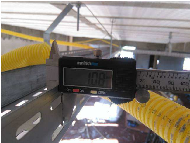
Figura 15E: infraestrutura interna - espessura eletrocalhas chapa #20.