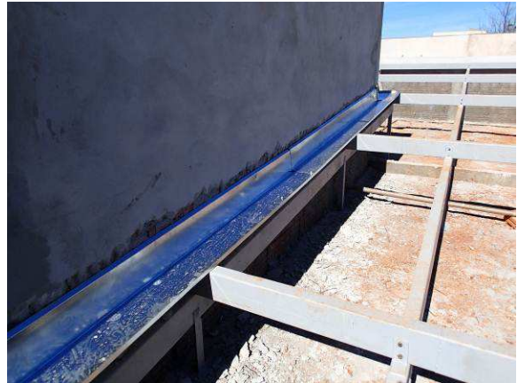
Figura 19C: Rufo instalado no pé do reservatório