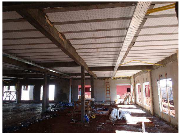
Figura 27C: Reboco realizado em face interna de parede da secretaria