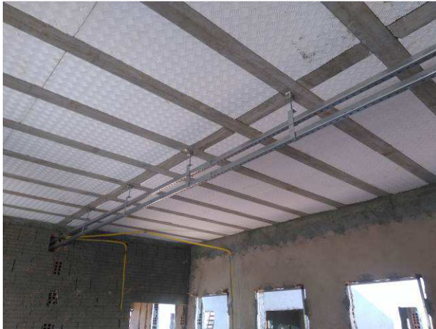
Figura 21E: infraestrutura - perfilados rede lógica.