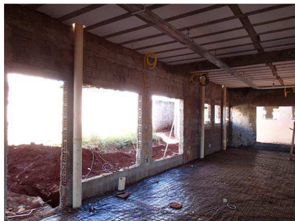
Figura 21C: No detalhe da imagem, a camada de lona plástica foi aplicada e, na sequência, executado contrapiso