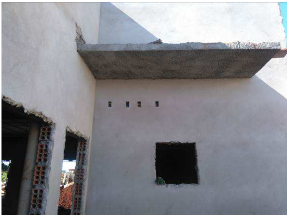
Figura 38C: Reboco executado na fachada sul (fundos)