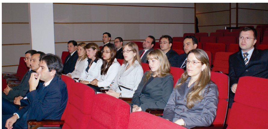
Os juízes substitutos, empossados no dia 18 de abril, acompanham a abertura do Módulo Regional da Formação Inicial dos Magistrados do Trabalho, em 26 de maio

Após a conclusão do curso, os juízes deverão cumprir, no mínimo, carga semestral de 40 horas-aula e carga anual de 80 horas-aula de atividades de formação inicial até o vitaliciamento, conjugadas entre aulas teóricas e práticas, sob a supervisão da Escola de Administração Judiciária do Tribunal Regional do Trabalho do Paraná. ■