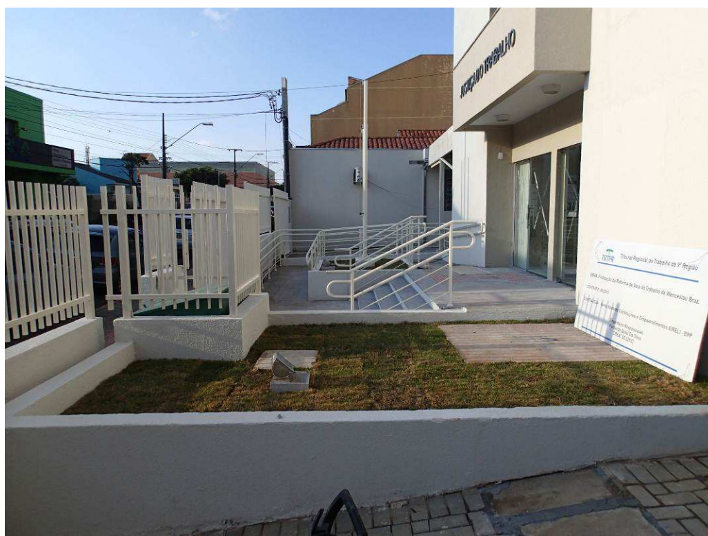
Figura 3 – Vista externa.