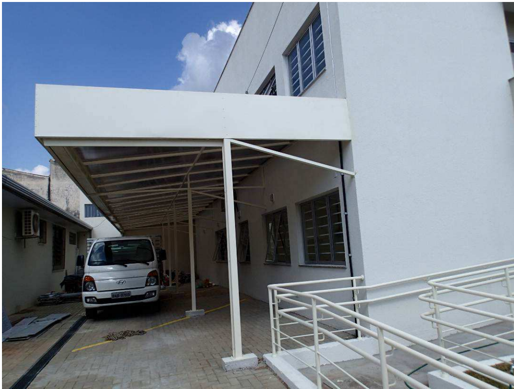
Figura 4 – Vista externa.