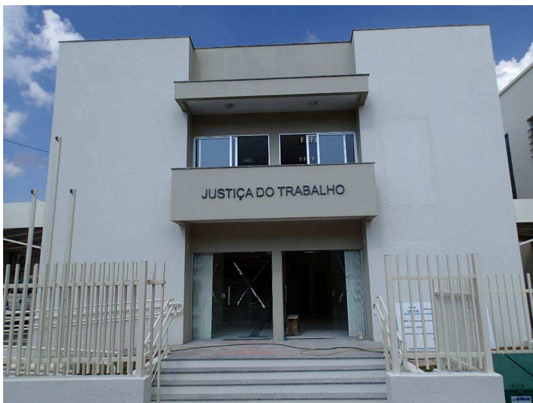
Figura 2 – Vista externa.

TRIBUNAL REGIONAL DO TRABALHO 9ª REGIÃO Secretaria de Engenharia e Arquitetura Serviço de Administração de Obras