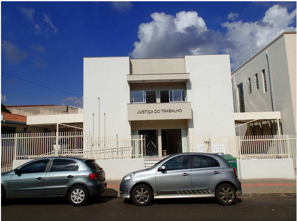
Figura 1 – Vista externa.

item 15 (Pinturas), 11,36% do item 16 (Serviços Complementares), 100% do item 17 (Limpeza da Obra), 32,73% do item 19 (Instalações Elétricas), 36,06% do item 20 (Instalações Lógicas, CFTV, Telefonia, Alarme), 95,17% do item 21 (Sistema de Proteção Contra Descargas Atmosféricas) e 0,00% do item 22 (1º Termo Aditivo - Fechamento das Aberturas da Plataforma Elevatória). A contratada executou 47,53% do valor previsto para o item 01, 17,61% do item 02, 15,01% do item 03, 11,91% do item 04, 35,28% do item 05, 0,00% do item 06, 34,17% do item 07, 84,80% do item 08, 7,50% do item 09, 10,76% do item 10, 66,61% do item 11, 3,03% do item 12, 100% do item 13, 36,47% do item 14, 54,36% do item 15, 11,36% do item 16, 100% do item 17, 32,73% do item 19, 36,06% do item 20, 95,17% do item 21 e 100% do item 22.