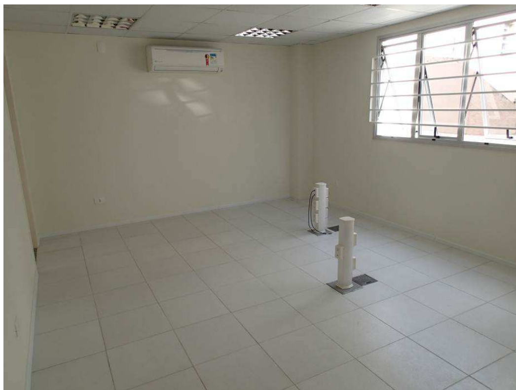
Figura 6 – Vista interna - secretaria.