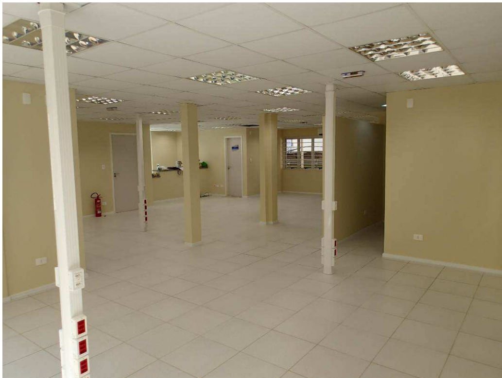
Figura 5 – Vista interna - secretaria.