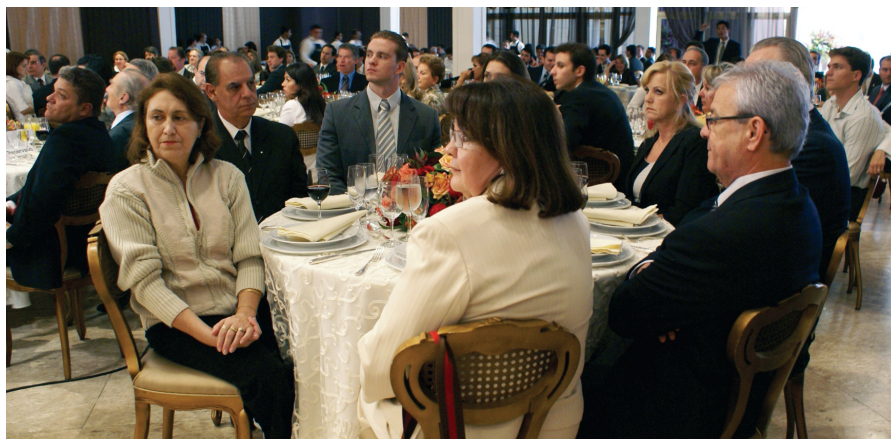
Autoridades presentes à solenidade em homenagem ao ministro Gilmar Mendes, realizada no dia 30 de março

Ao abordar a Constituição de 1988, disse que ela muitas vezes tem sido criticada, mas tem propiciado ao Brasil o