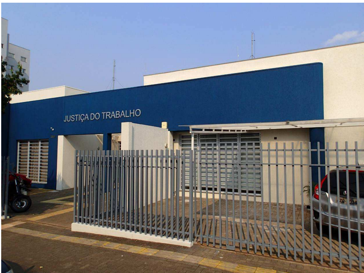
Figura 2 – Vista externa.