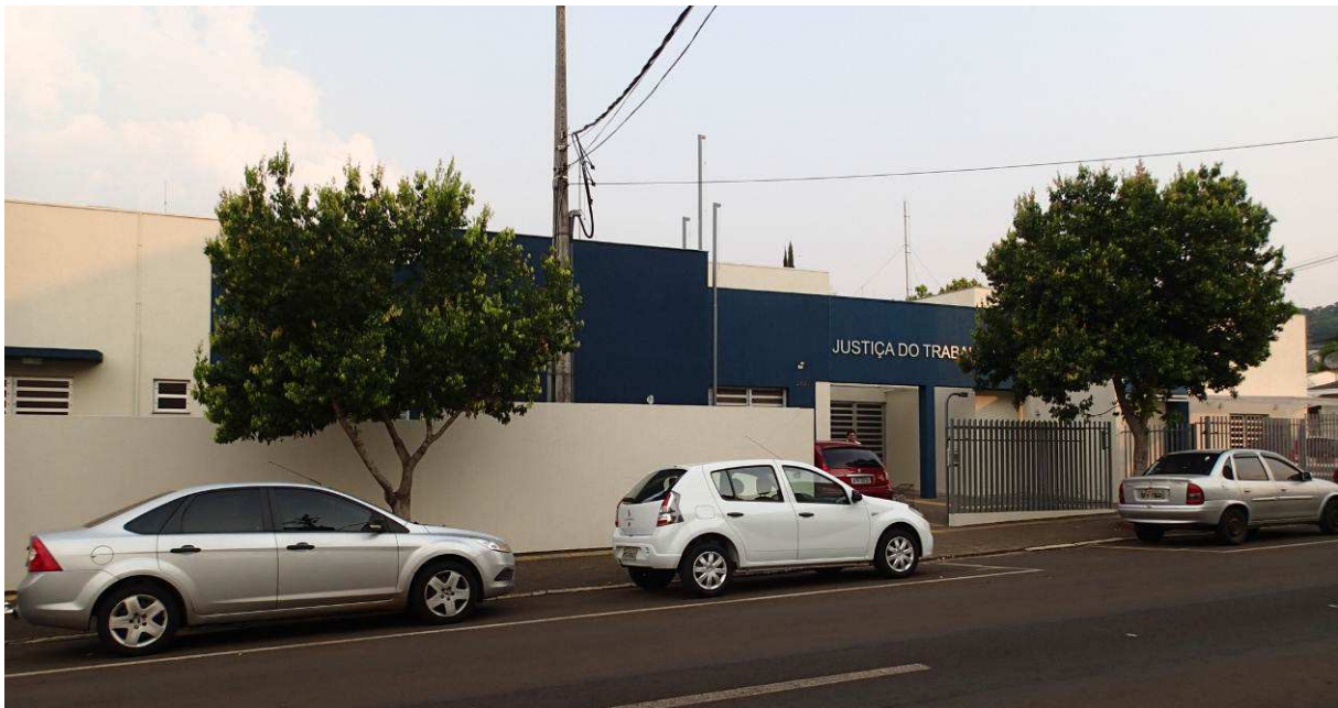
Figura 1 – Vista externa.

TRIBUNAL REGIONAL DO TRABALHO 9ª REGIÃO Secretaria de Engenharia e Arquitetura Serviço de Administração de Obras