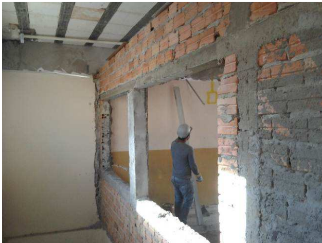
Figura 11C: Vergas e contravergas instaladas no primeiro pavimento