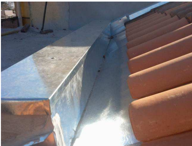
Figura 23C: Calhas instaladas na cobertura