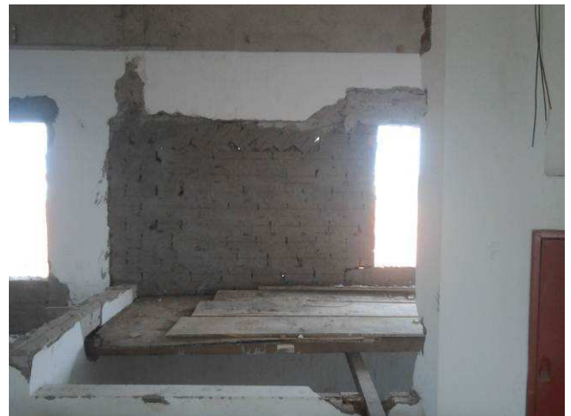
Figura 18C: Adaptações nos vãos de janelas do segundo pavimento