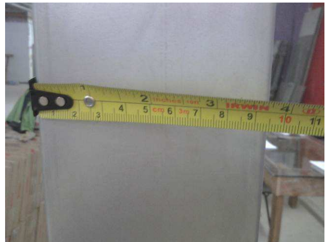
Figura 12E: Aferição das dimensões de eletrocalha lisa #200x100