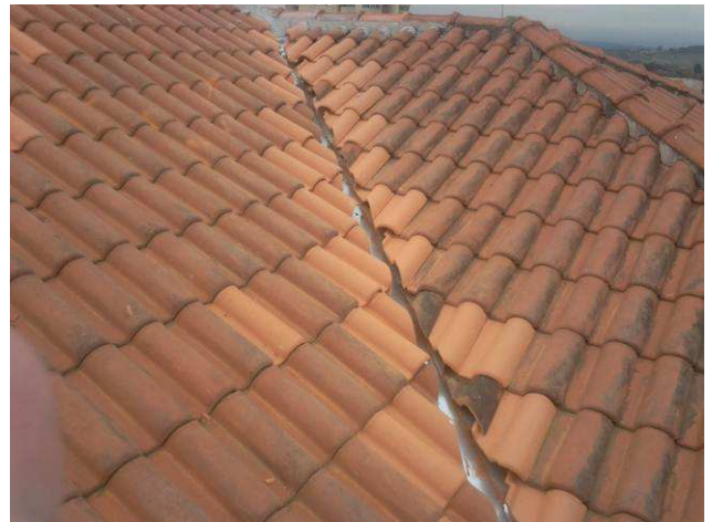
Figura 28C: Telhas substituídas por novas, na cobertura