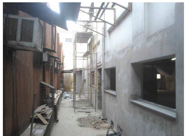
Figura 42C: Detalhe de peitoril instalado no térreo