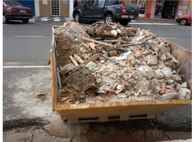
Figura 04C: Caçamba utilizada na remoção de entulhos, no estacionamento à frente do imóvel