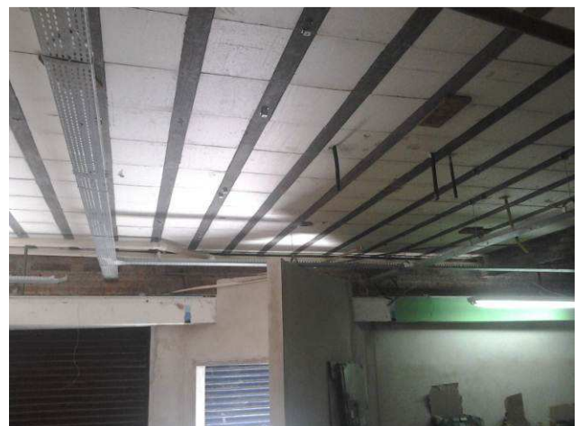
Figura 02E: Eletrocalhas #200x50 instaladas no pavimento térreo