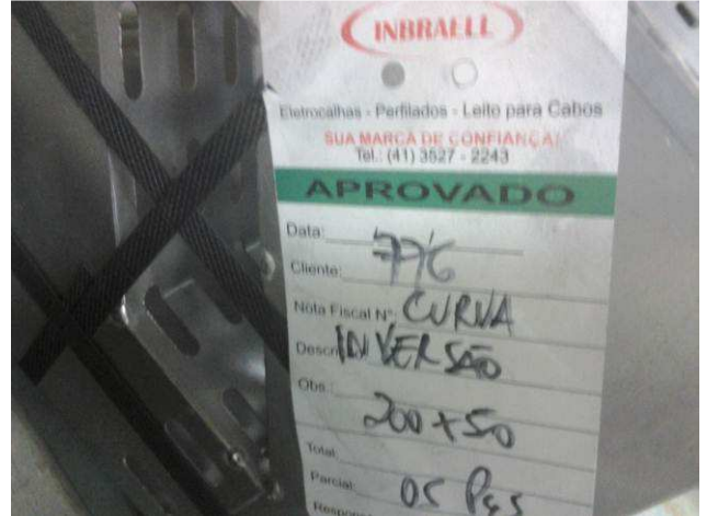
Figura 10E: Fornecedor do material elétrico (eletrocalhas e perfilados)