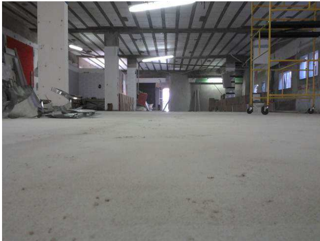
Figura 37C: Contrapiso executado no pavimento térreo