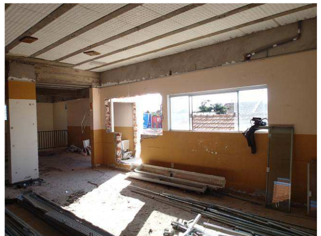
Figura 08C: Região de parede após a demolição da portinhola metálica