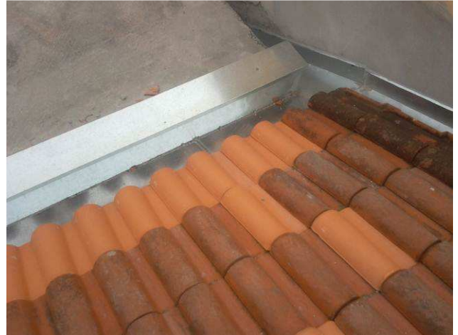
Figura 26C: Telhas substituídas por novas, na cobertura