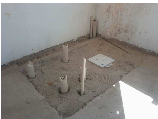
Figura 47C: Chegada de pontos de esgoto primário e secundário no primeiro pavimento