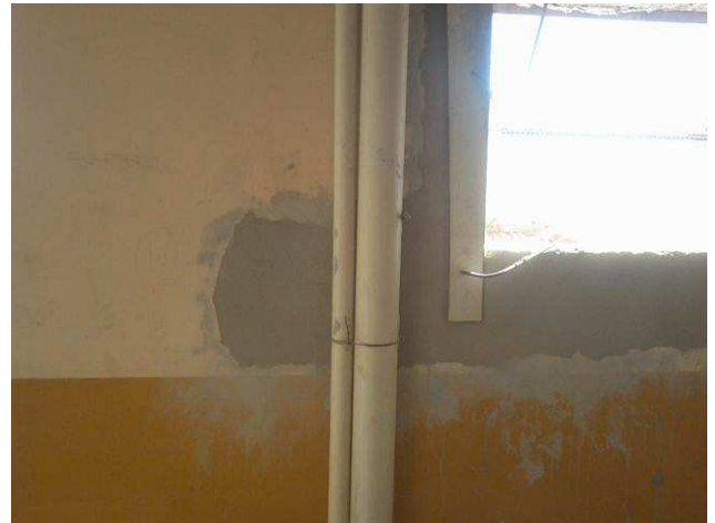
Figura 52C: Detalhe de prumada de esgoto primário