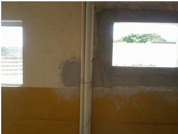
Figura 33C: Emboço junto às adaptações das janelas do primeiro pavimento