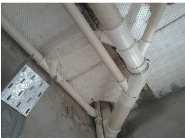
Figura 45C: Pontos de esgoto primário e secundário ligando-se à prumada