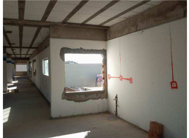
Figura 16C: Vergas e contravergas instaladas no segundo pavimento