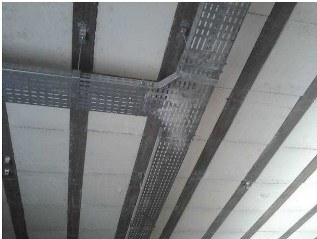
Figura 05E: Tê #200x50