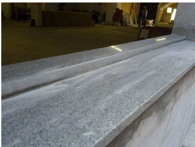
Figura 41C: Detalhe de peitoril instalado no térreo