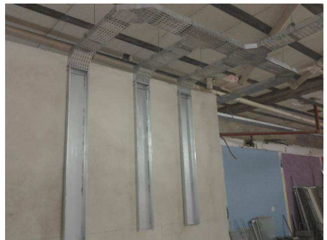
Figura 14E: Eletrocalhas lisas #200x50 instaladas no térreo