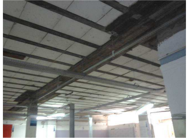
Figura 04E: Perfilado #38x38, instalado no térreo