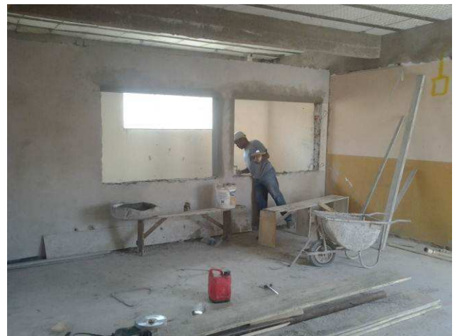
Figura 36C: Serviço de requadro sendo executado