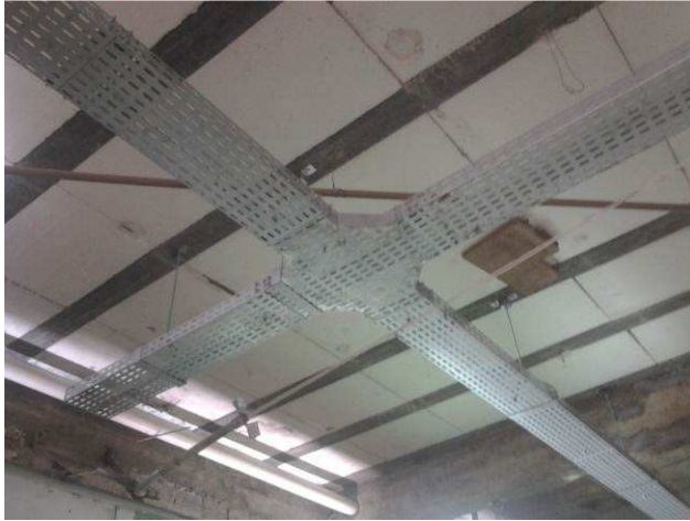
Figura 03E: Cruzeta 90° #200x50