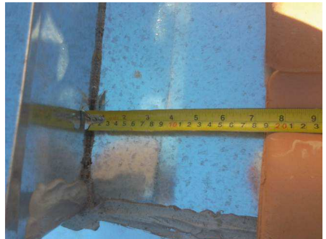
Figura 22C: Calhas instaladas na cobertura