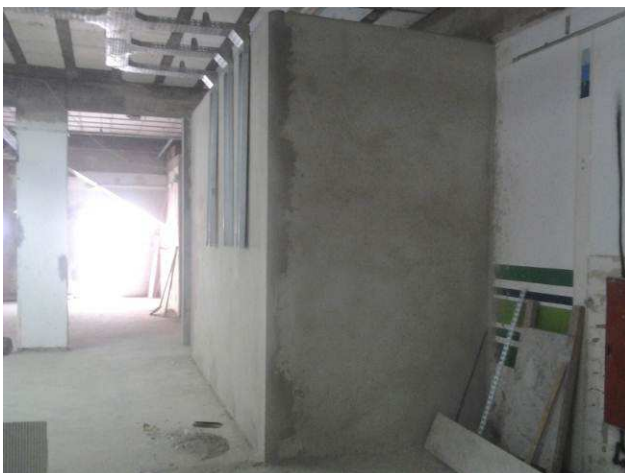
Figura 29C: Chapisco e emboço das paredes dos PAB