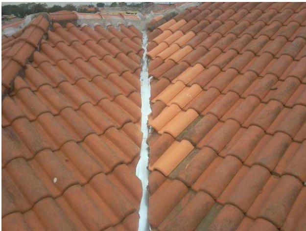
Figura 27C: Telhas substituídas por novas, na cobertura