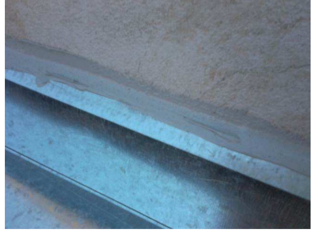
Figura 20C: Calhas instaladas na cobertura