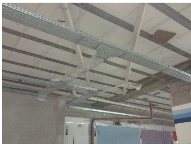
Figura 46C: Pontos de esgoto primário e secundário executados no primeiro pavimento