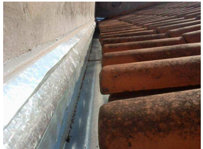
Figura 24C: Calhas instaladas na cobertura