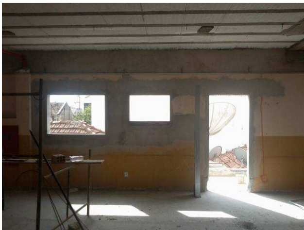
Figura 35C: Janelas e portas do primeiro pavimento requadradas