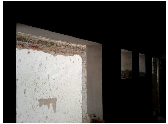
Figura 32C: Requadro de portas e janelas no pavimento térreo