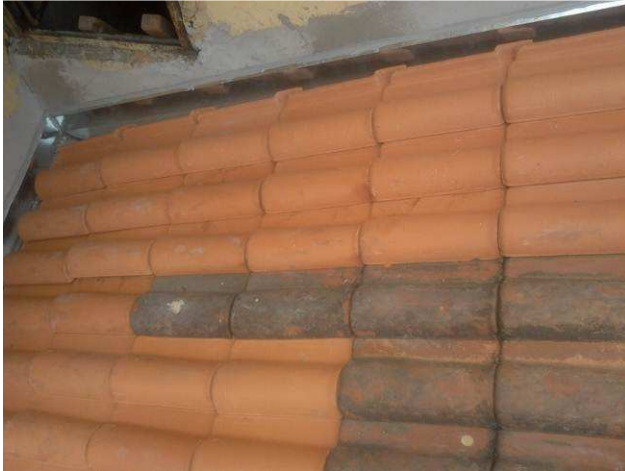
Figura 25C: Telhas substituídas por novas, na cobertura