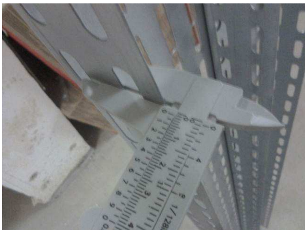
Figura 07E: aferição da espessura da chapa de eletrocalha #200x100