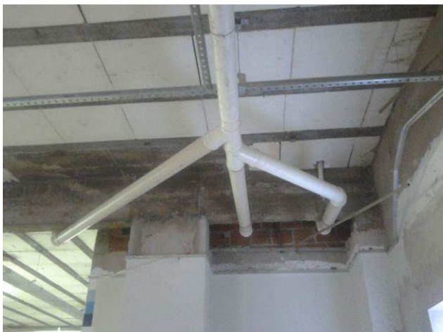
Figura 43C: Pontos de esgoto primário, executados no primeiro pavimento