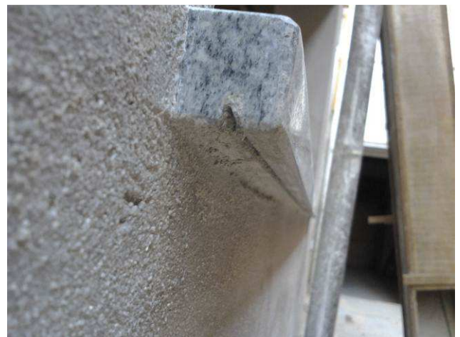
Figura 40C: Detalhe da pingadeira abaixo de um peitoril