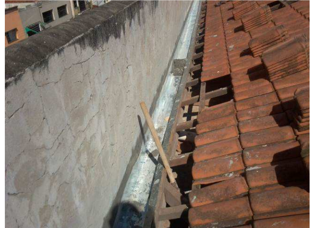
Figura 10C: Início da remoção das calhas e rufos