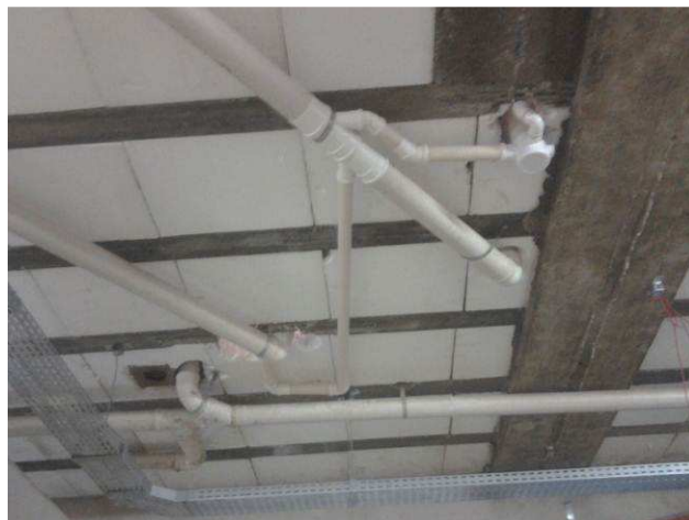
Figura 44C: Pontos de esgoto primário e secundário executados no segundo pavimento