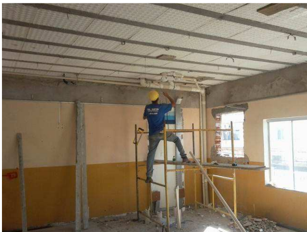
Figura 01C: uso de andaime na execução das instalações sanitárias