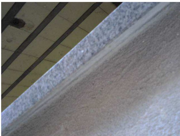
Figura 39C: Detalhe da pingadeira abaixo de um peitoril