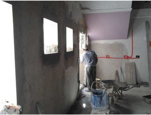
Figura 31C: Requadro de janelas no pavimento térreo