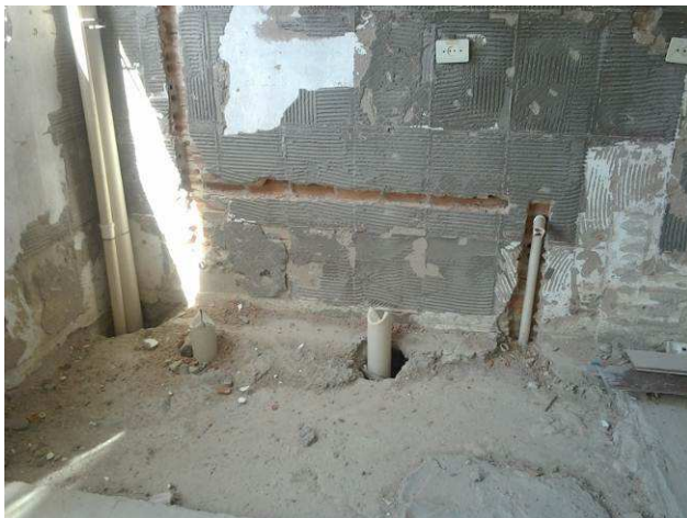
Figura 05C: Furos em laje, para passagem de tubulações de esgoto