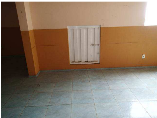
Figura 07C: portinhola metálica, antes da demolição