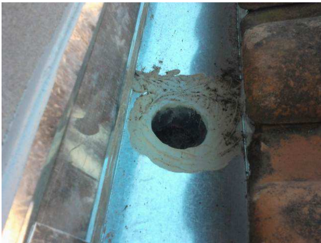
Figura 21C: Calhas instaladas na cobertura