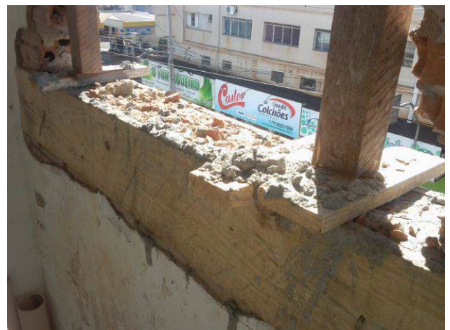
Figura 14C: Vergas e contravergas instaladas no segundo pavimento