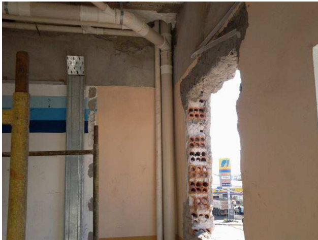
Figura 49C: Detalhe de prumada de esgoto primário no primeiro pavimento