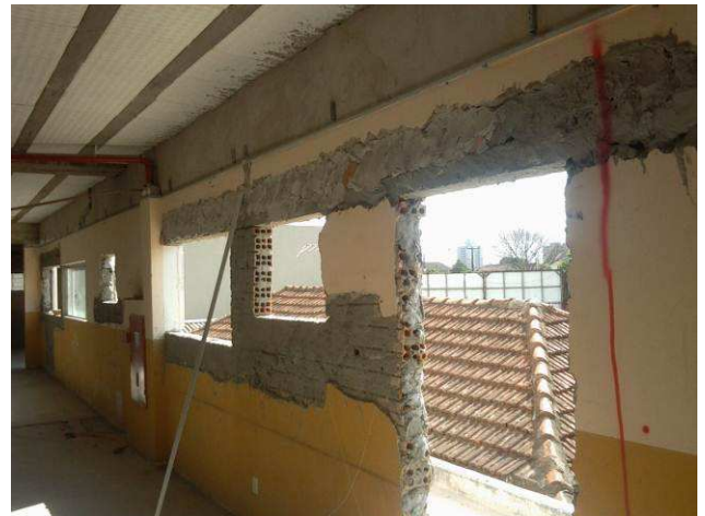
Figura 12C: Vergas e contravergas instaladas no primeiro pavimento