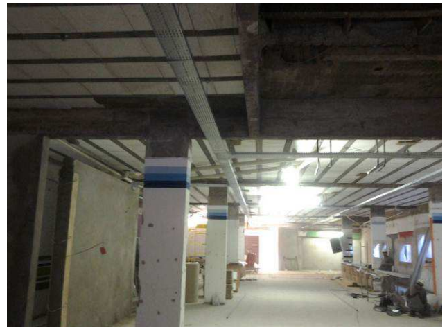
Figura 06E: vista das eletrocalhas no térreo