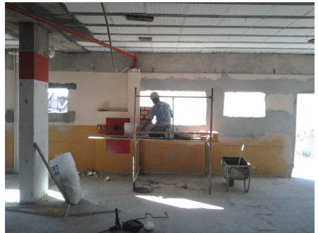
Figura 34C: Emboço junto às adaptações das janelas do primeiro pavimento