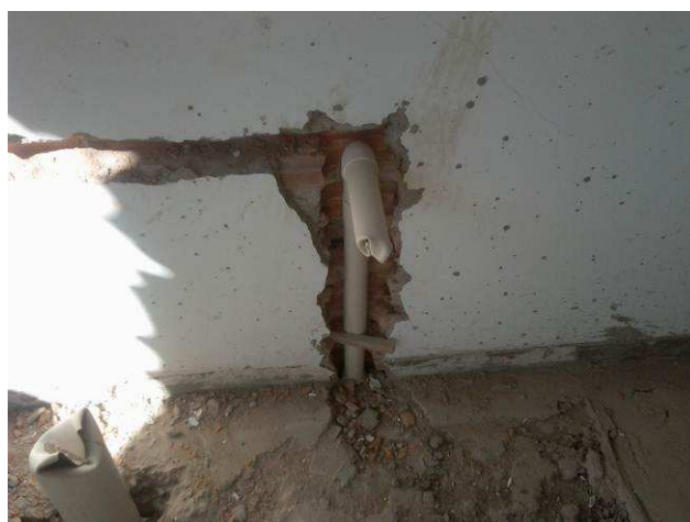
Figura 48C: Chegada de pontos de esgoto secundário no segundo pavimento