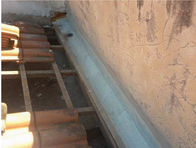
Figura 09C: Início da remoção das calhas e rufos