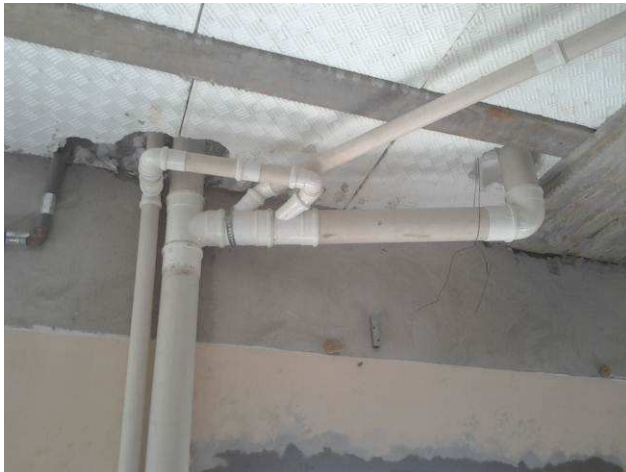
Figura 51C: Detalhe de prumada de esgoto primário