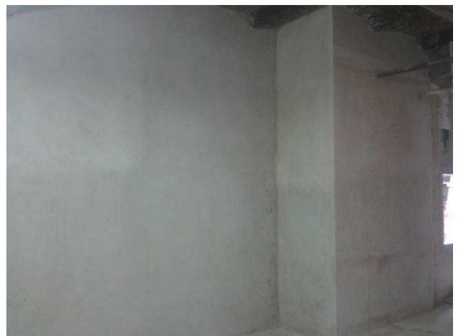
Figura 30C: Chapisco e emboço das paredes dos PAB