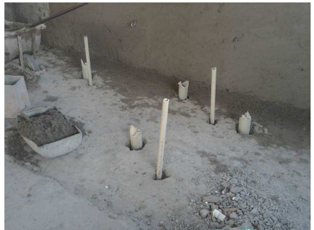
Figura 06C: Furos em laje, para passagem de tubulações de esgoto