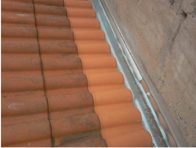
Figura 19C: Calhas instaladas na cobertura