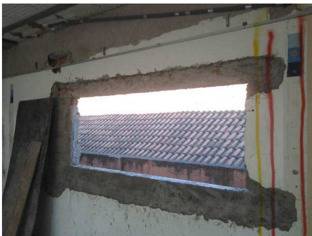
Figura 13C: Vergas e contravergas instaladas no primeiro pavimento