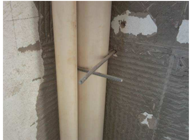
Figura 50C: Detalhe de prumada de esgoto primário no segundo pavimento