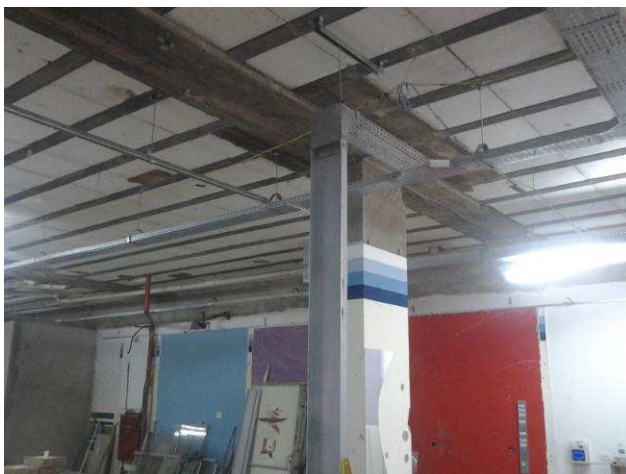
Figura 13E: Eletrocalha lisa #200x50 instalada no térreo