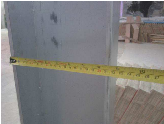
Figura 11E: Aferição das dimensões de eletrocalha lisa #200x100