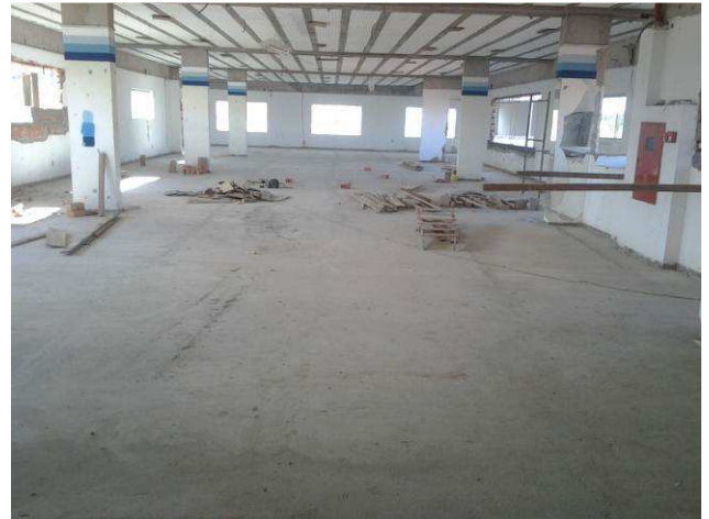
Figura 38C: Contrapiso executado no segundo pavimento