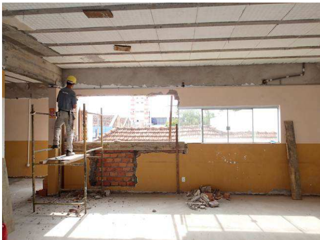
Figura 17C: Alvenaria de fechamento da portinhola metálica