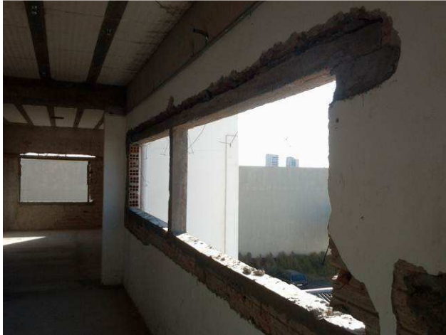
Figura 15C: Vergas e contravergas instaladas no segundo pavimento