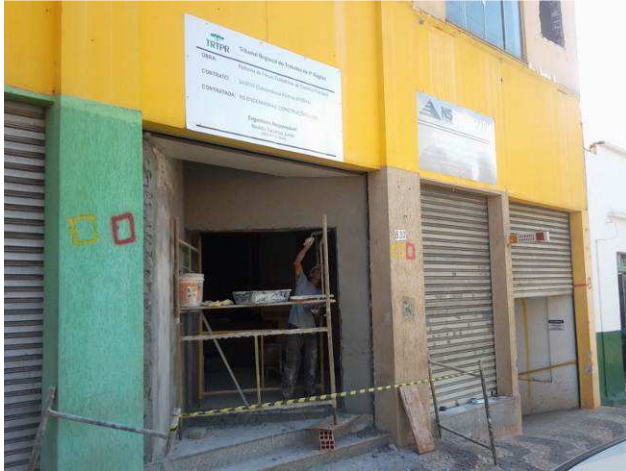
Figura 03C: Andaime sendo utilizado para execução de emboço