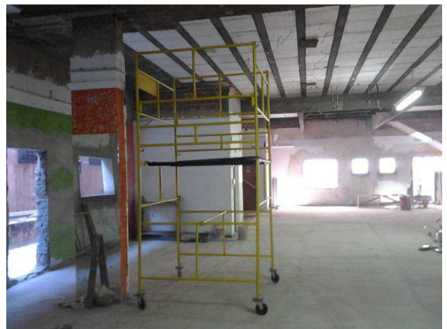
Figura 02C: uso de andaime na instalação das eletrocalhas, no térreo