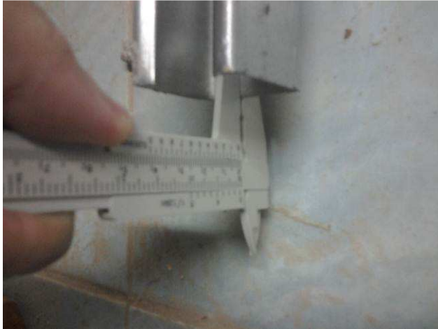
Figura 09E: Aferição da espessura de perfilado #38x38