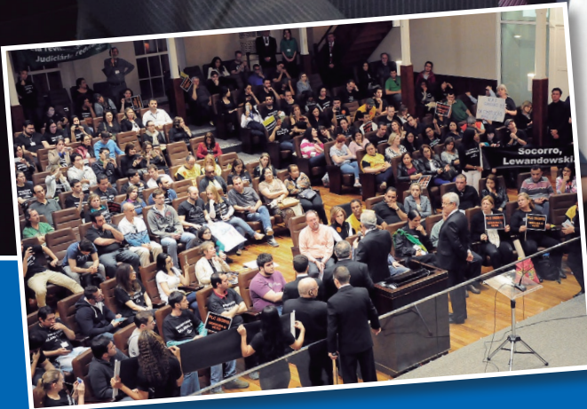
Presidente do Supremo Tribunal Federal faz visita histórica ao TRT-PR, recebe condecoração e dialoga com servidores em greve. Páginas 4 e 5