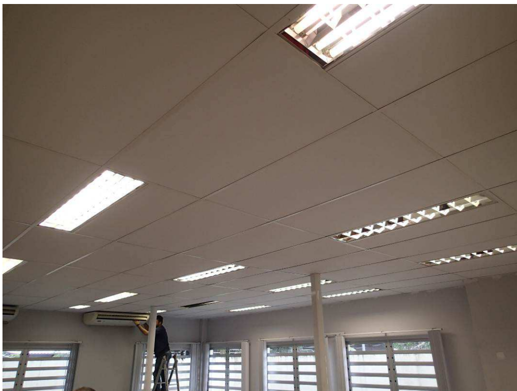
Figura 3 – Vista interna - forro novo na secretaria da 1ª Vara.