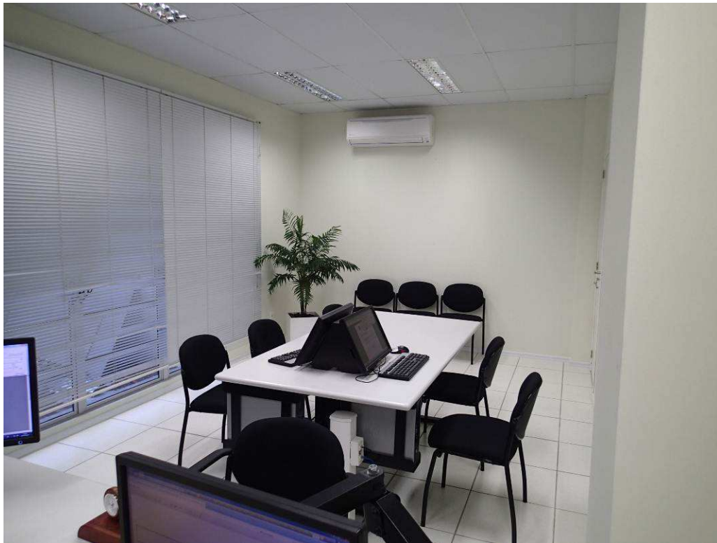
Figura 2 – Vista interna - sala de audiências da 2ª Vara.