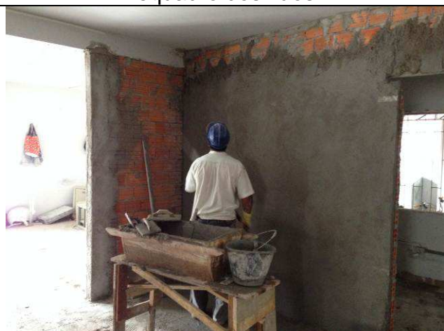
Figura 47C: Revestimentos internos – paredes de alvenaria.