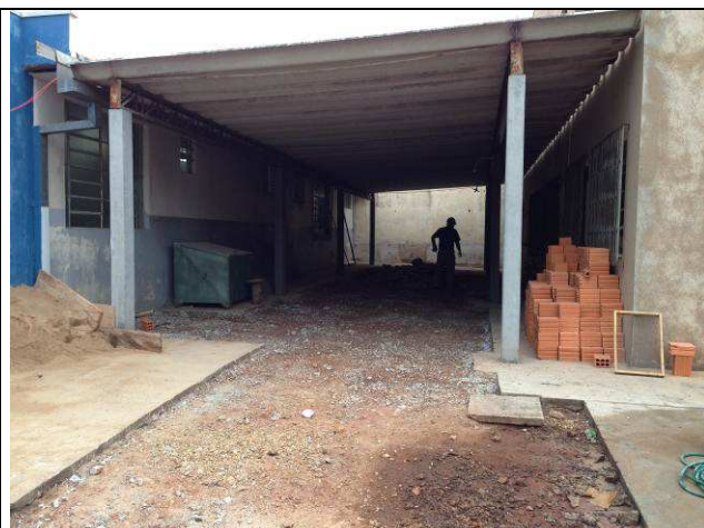
Figura 20C: Remoção do piso da área de estacionamento – lateral esquerda.