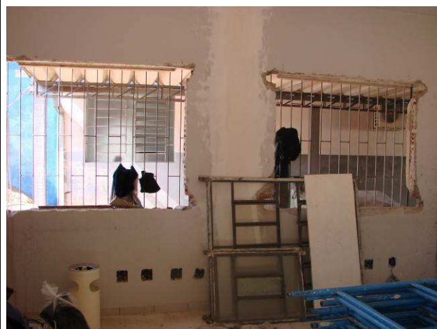
Figura 18C: Janelas removidas na reserva PAB.