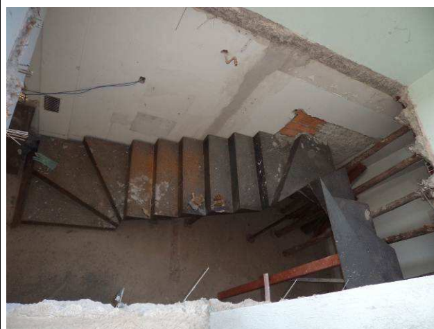
Figura 54C: Montagem da escada metálica com degraus em chapa xadrez de aço.