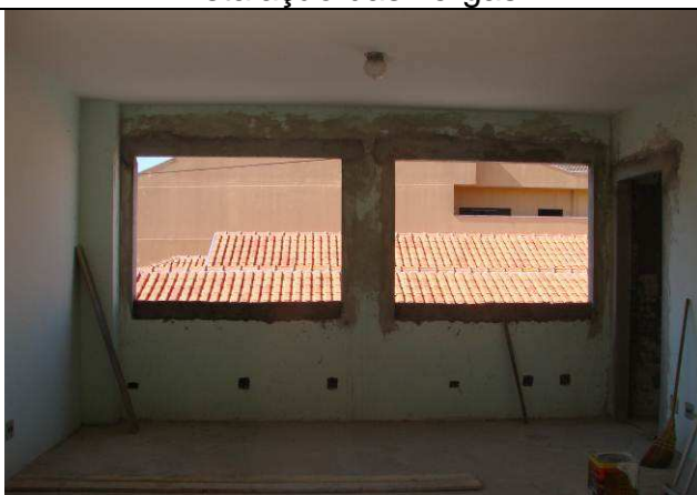
Figura 38C: Vergas instaladas sobre os novos vãos abertos.