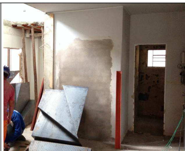
Figura 44C: Revestimentos internos – chapisco/emboço dos vãos fechados.