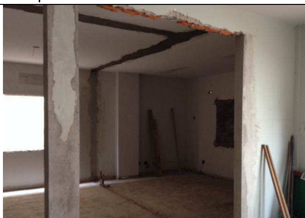
Figura 07C: Demolição de alvenaria – paredes da Secretaria removidas.