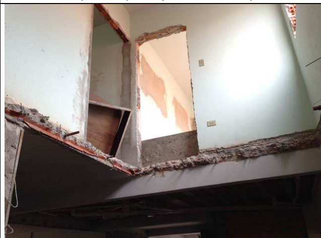
Figura 12C: Conclusão da demolição da laje pré-moldada.