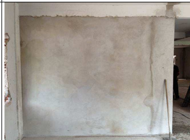
Figura 30C Parede de alvenaria da sala técnica / balcão de atendimento.