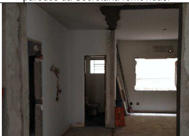
Figura 08C: Demolição de alvenaria – paredes da Secretaria removidas.