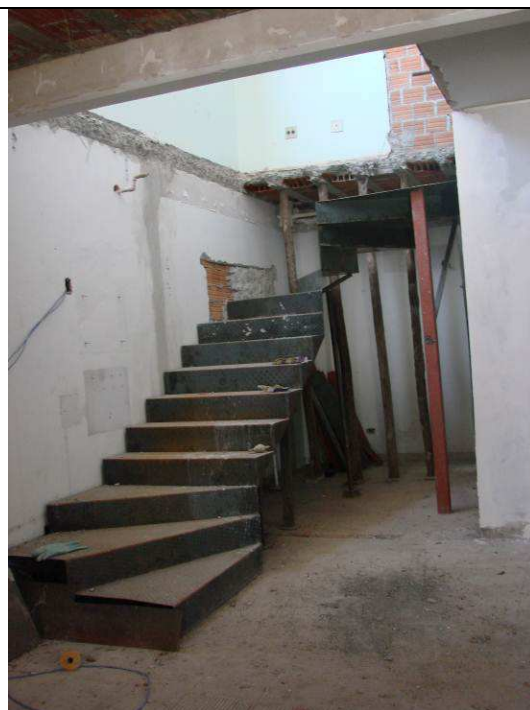
Figura 56C: Montagem da escada metálica com degraus em chapa xadrez de aço.