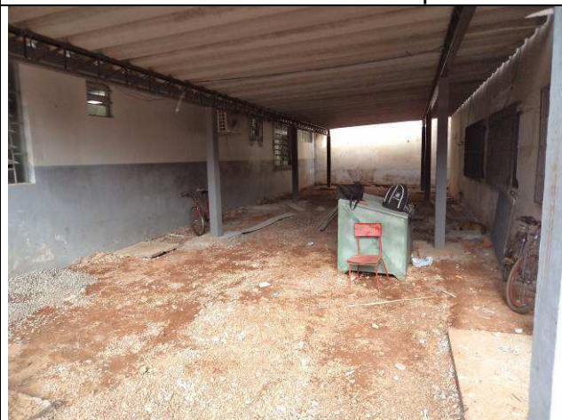
Figura 22C: Remoção do piso da área de estacionamento – lateral esquerda.