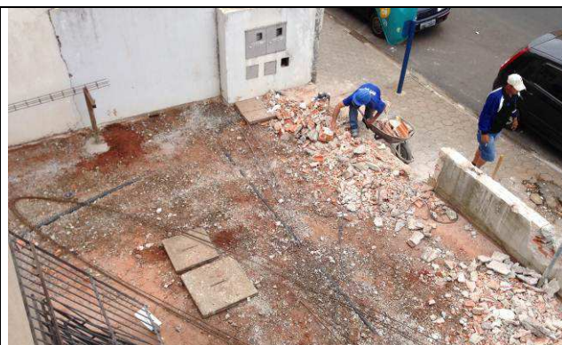
Figura 25C: Demolição do muro frontal.