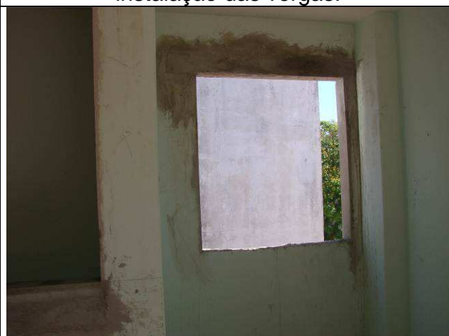
Figura 39C: Vergas instaladas sobre os novos vãos abertos.