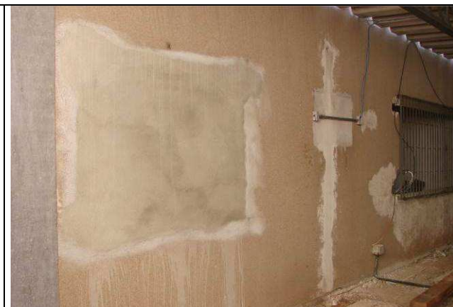
Figura 28C: Vão de janela fechado abaixo da escada metálica – vista externa.