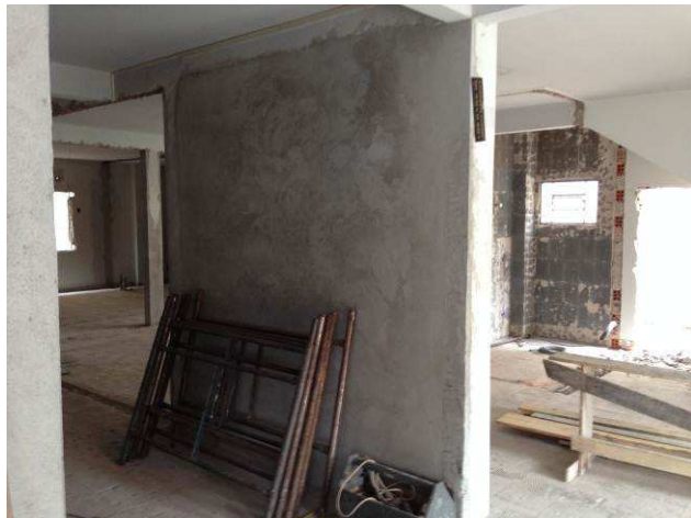
Figura 31C: Paredes de alvenaria do balcão de atendimento - térreo.