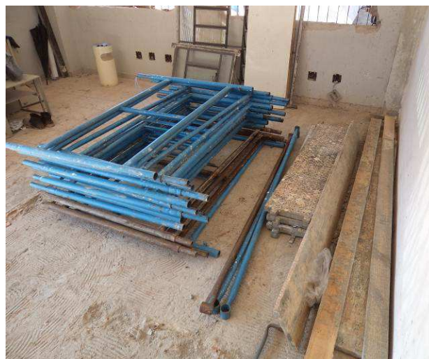
Figura 02C: Andaimos armazenados no interior da obra.