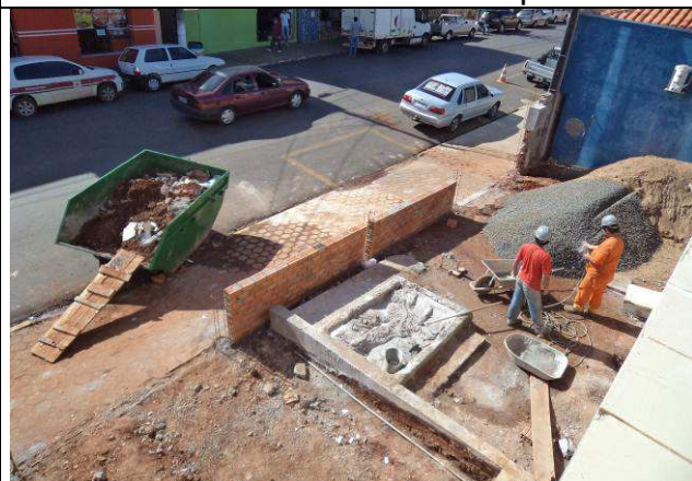
Figura 24C: Remoção do piso da área de acesso de pedestres.