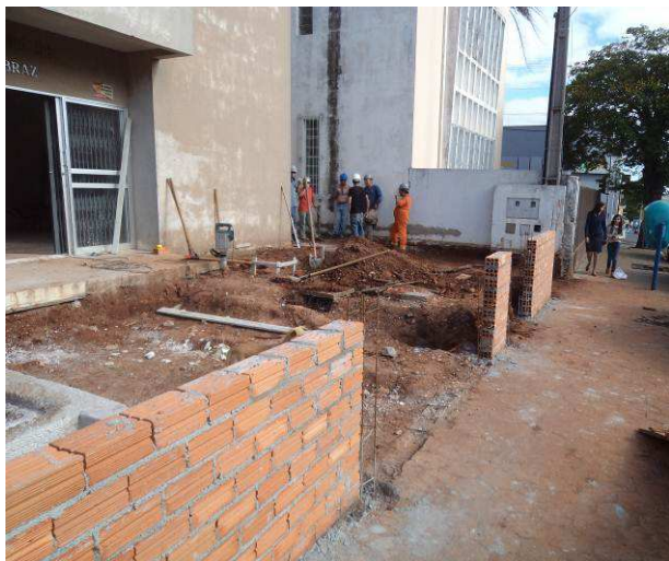
Figura 51C: Muro Frontal - executadas as alvenarias em blocos cerâmicos do muro frontal.