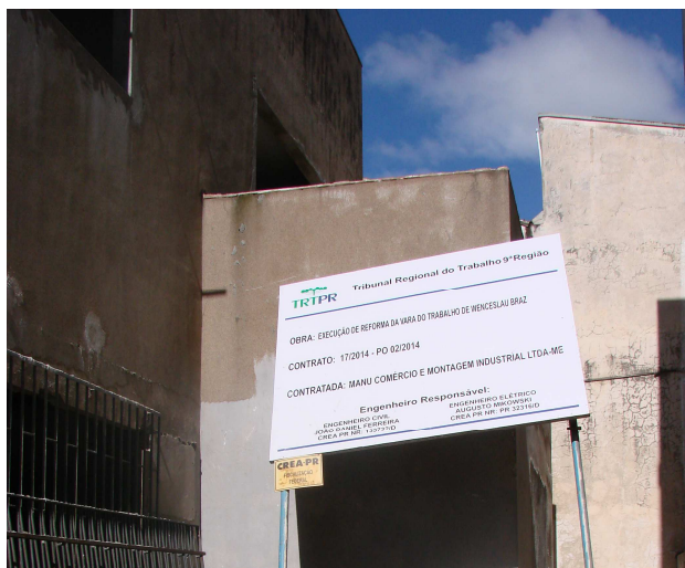
Figura 01C: Placa da obra foi deslocada para execução do muro frontal.