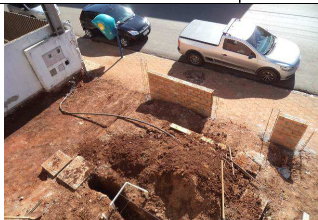
Figura 23C: Remoção do piso da área de acesso de pedestres.