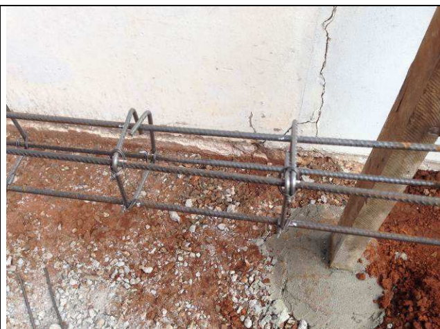
Figura 35C: Montagem das armaduras das vergas.