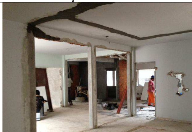
Figura 05C: Demolição de alvenaria – paredes da Secretaria removidas.