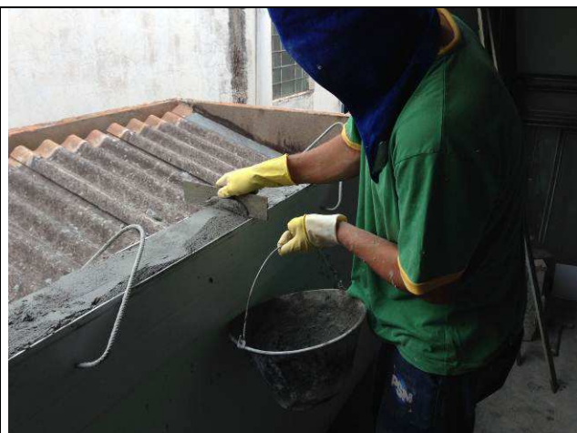
Figura 46C: Revestimentos internos – requadro dos vãos.