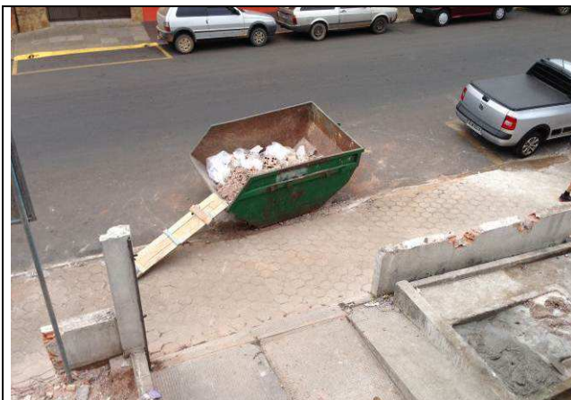
Figura 03C: Caçamba utilizada para remoção dos entulhos.