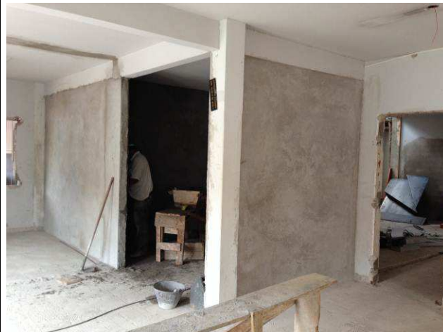
Figura 32C: Paredes de alvenaria do balcão de atendimento - térreo.