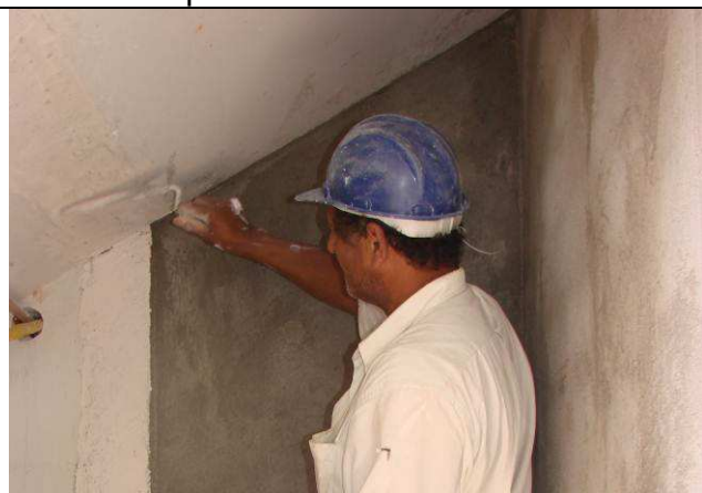
Figura 49C: Revestimentos internos – paredes de alvenaria.