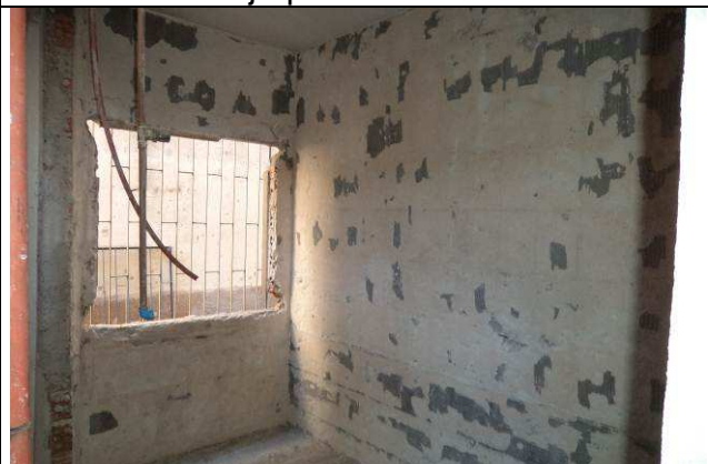
Figura 14C: Azulejo da copa da Secretaria removido.