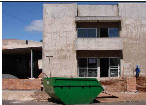
Figura 04C: Caçamba utilizada para remoção dos entulhos.