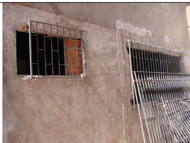
Figura 19C: Janela removida no banheiro PNE do piso térreo – grades mantidas.