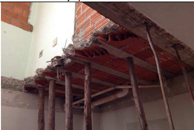
Figura 13C: Escoras mantidas para execução da demolição.