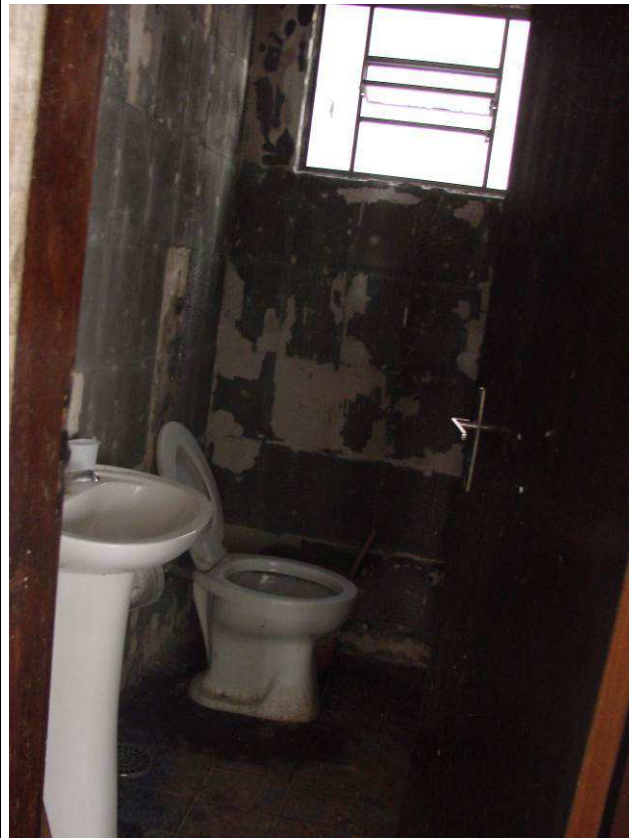
Figura 16C: Azulejo da parede de banheiro da Secretaria removido.