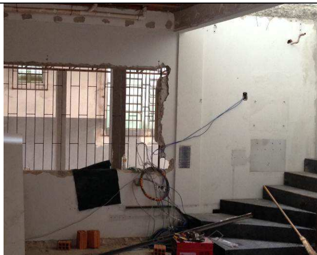
Figura 09C: Acima da escada, local onde seria aberta janela J01.