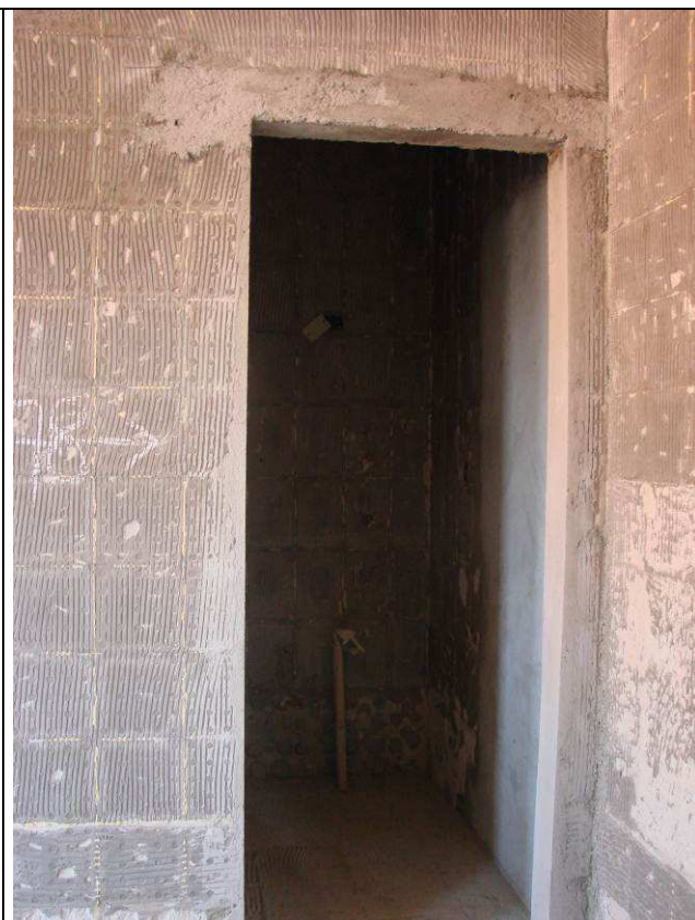
Figura 42C: Vergas instaladas sobre os novos vãos abertos.