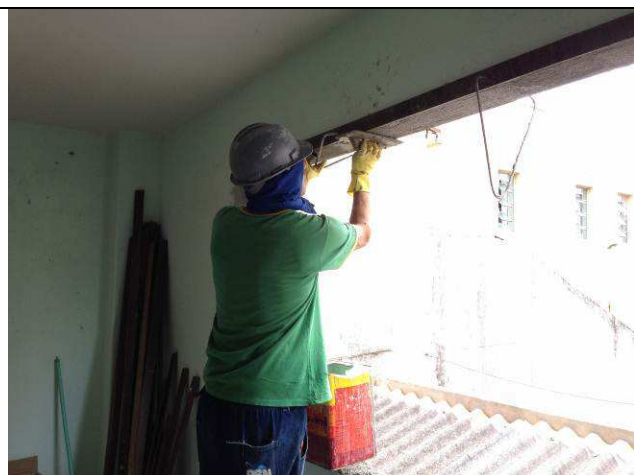
Figura 45C: Revestimentos internos – requadro dos vãos.