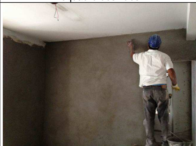
Figura 48C: Revestimentos internos – paredes de alvenaria.