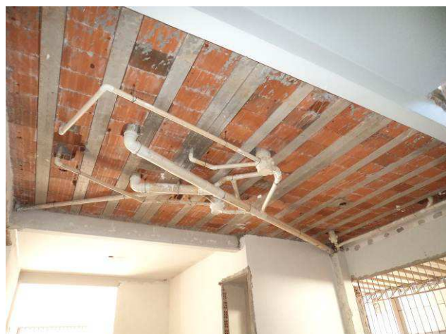
Figura 17C: Forro de gesso removido em área da Secretaria.