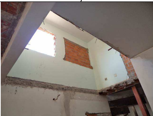
Figura 11C: Conclusão da demolição da laje pré-moldada.