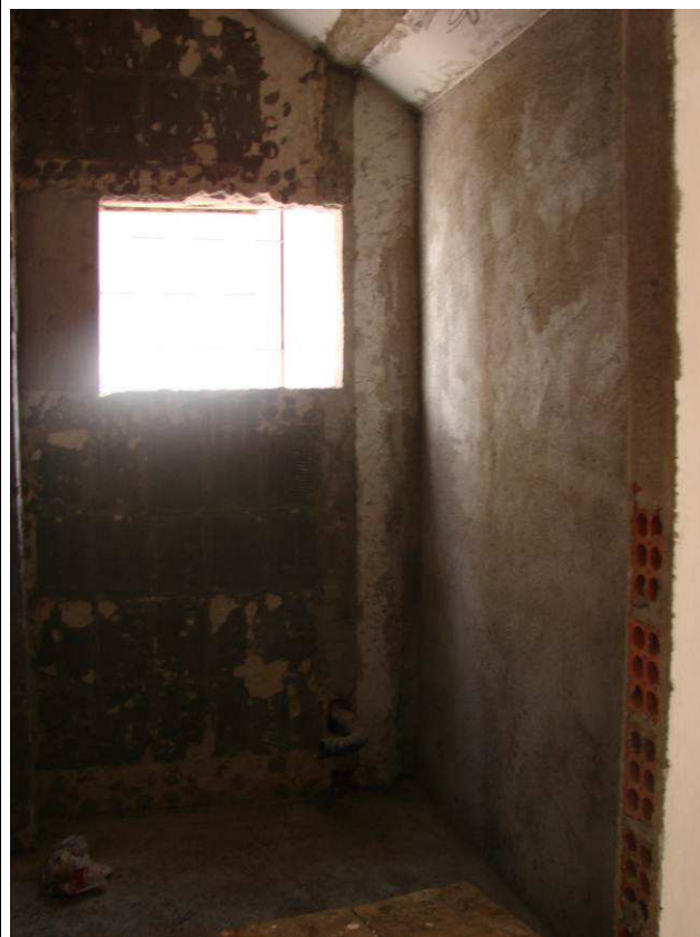
Figura 34C: Paredes de alvenaria do banheiro PNE - térreo.