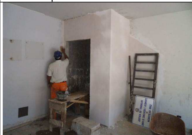
Figura 50C: Revestimentos internos – paredes de alvenaria.