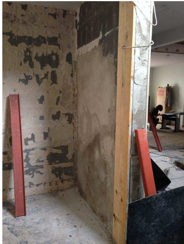
Figura 15C: Azulejo da copa da Secretaria removido.