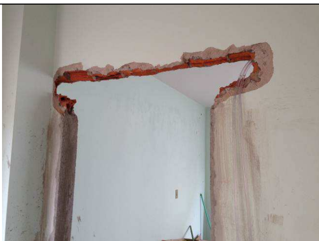
Figura 36C: Recortes na alvenaria para instalação das vergas.