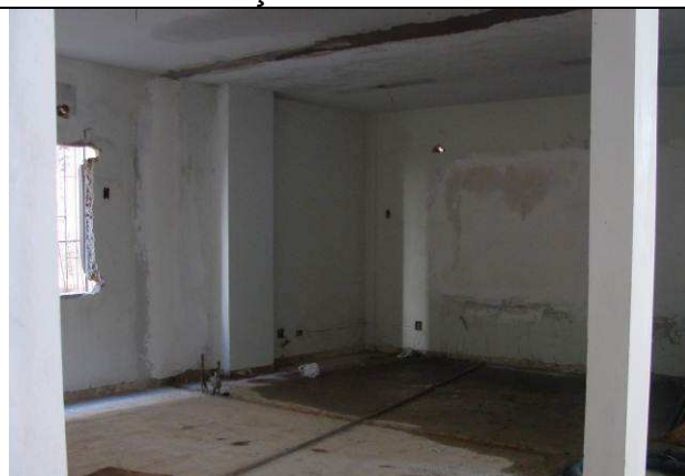
Figura 06C: Demolição de alvenaria – paredes da Secretaria removidas.