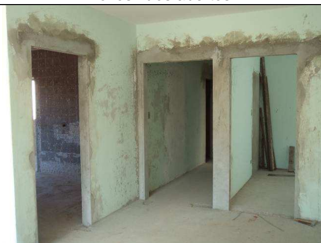
Figura 40C: Vergas instaladas sobre os novos vãos abertos.