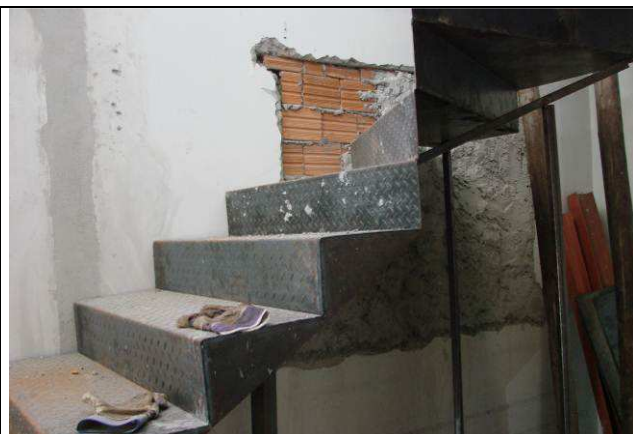
Figura 27C: Vão de janela fechado abaixo da escada metálica – vista interna.