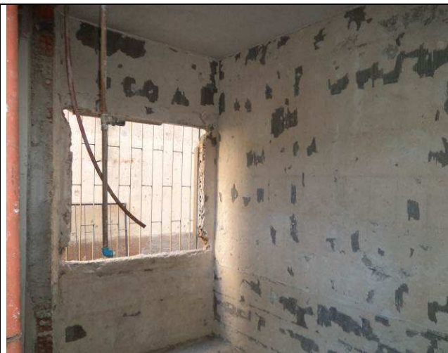
Figura 10C: Vão existente que será adaptado para janela da copa.