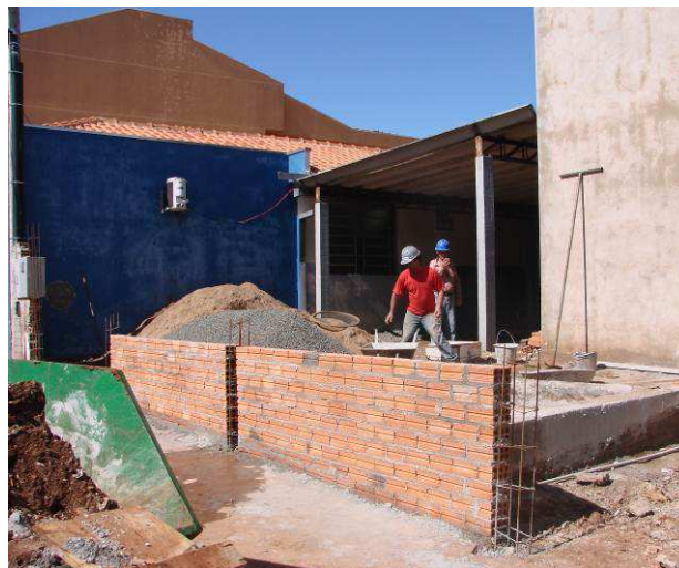
Figura 52C: Muro Frontal - executadas as alvenarias em blocos cerâmicos do muro frontal.