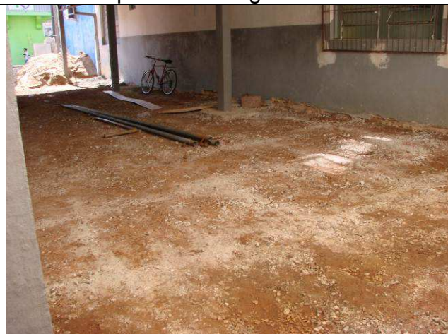
Figura 21C: Remoção do piso da área de estacionamento – lateral esquerda.