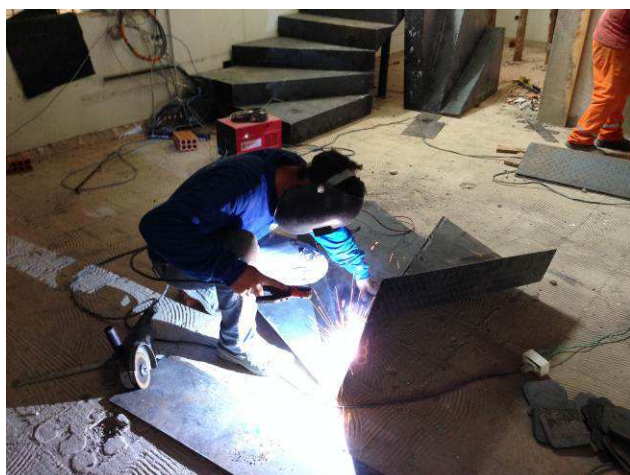
Figura 53C: Montagem da escada metálica com degraus em chapa xadrez de aço.