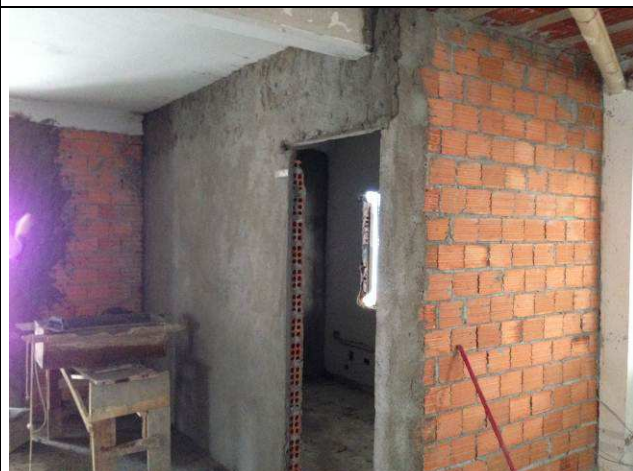
Figura 29C: Paredes de alvenaria da sala técnica - térreo.