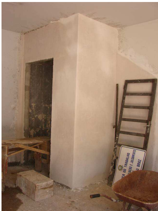
Figura 33C: Paredes de alvenaria do banheiro PNE - térreo.