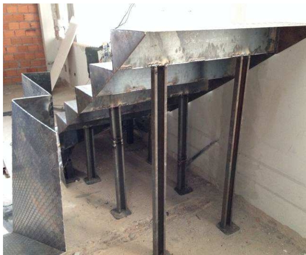
Figura 55C: Montagem da escada metálica - perfis de aço, tipo "C" enrijecido, para os apoios intermediários.