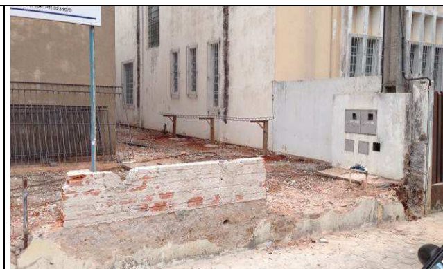
Figura 26C: Demolição do muro frontal.