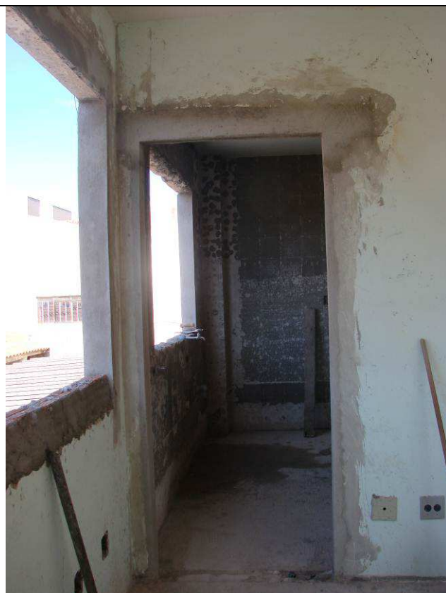
Figura 41C: Vergas instaladas sobre os novos vãos abertos.