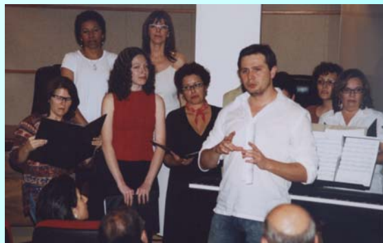
Grupo Vocal do Sinjutra interpretou sucessos da MPB durante o Auto de Natal