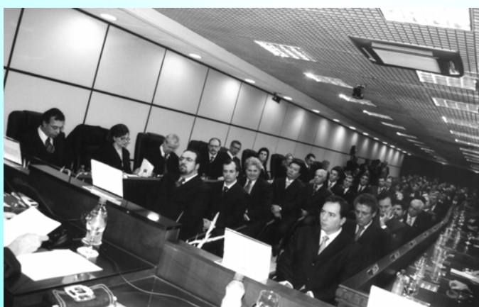
Desembargadores do TRT e autoridades acompanham a sessão solene de posse dos novos dirigentes da Corte