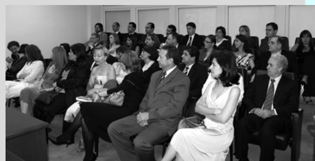
Juízes, advogados, servidores da Justiça do Trabalho, convidados e familiares dos empossados durante a sessão solene