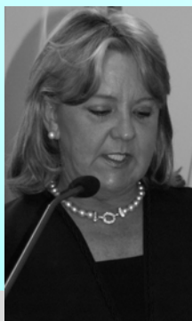
Desembargadora Rosemarie Pimpão: “Tríade de vencedores”