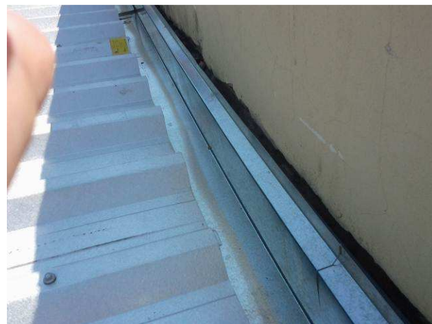
Figura 14C: Calhas instaladas