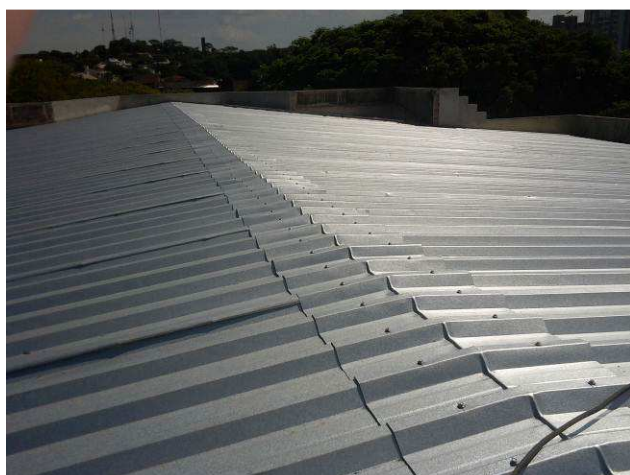
Figura 09C: Detalhe da cumeeira metálica