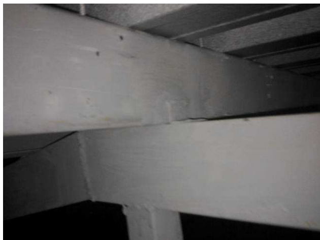
Figura 05C: Detalhe da estrutura metálica – tesoura e terça