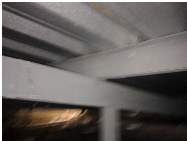
Figura 06C: Apoio de terça (perfil U) em tesoura (perfil caixão 2U)