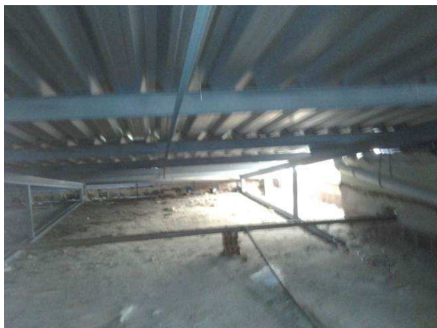
Figura 07C: visão geral da estrutura de cobertura – com agulha rígida no meio do vão das terças