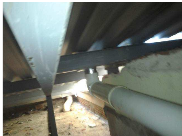
Figura 08C: Detalhe de tesoura, terças e sistema de captação pluvial