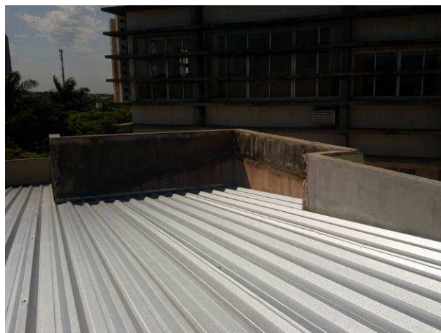
Figura 02C: Detalhe da demolição da platibanda do sanitário do gabinete