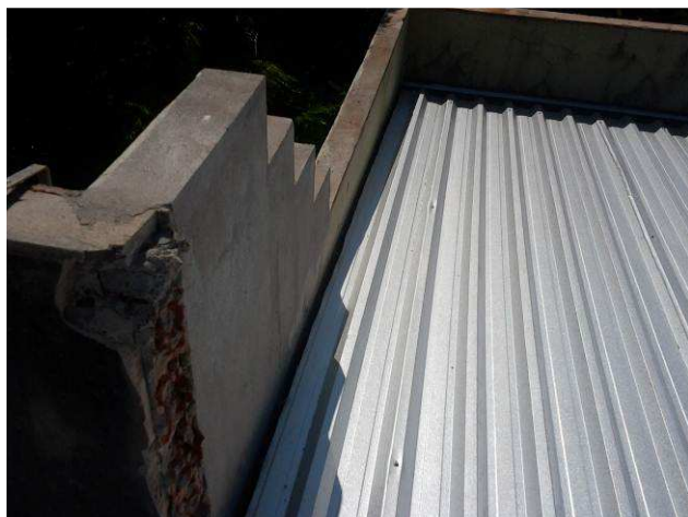
Figura 01C: Detalhe da demolição da platibanda da cobertura do sanitário público