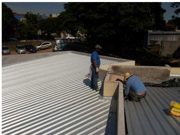
Figura 03C: Detalhe da demolição da platibanda dos sanitários dos servidores