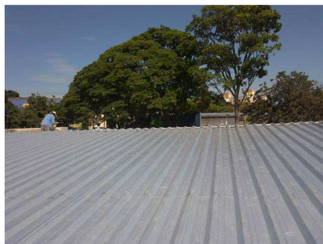
Figura 10C: Vista longitudinal da cobertura