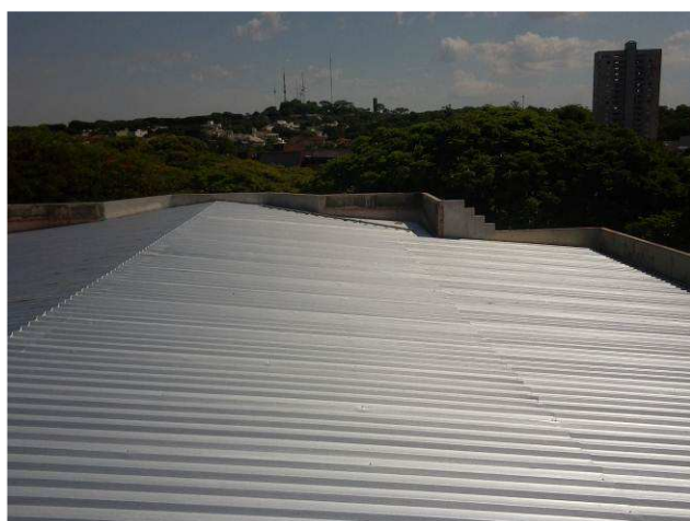
Figura 11C: Vista transversal da cobertura