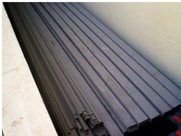
Figura 14C: Terças, diagonais e contraventamentos utilizados na estrutura de cobertura