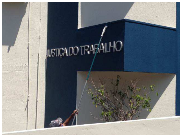
Figura 17C: Fachada direita do imóvel, recebendo a segunda demão de pintura