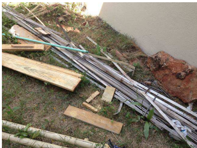
Figura 01E: Perfis em barra chata de alumínio removidas da cobertura.