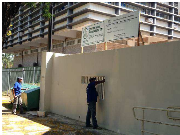
Figura 19C: Operário realizando recorte de pintura no muro frontal do imóvel