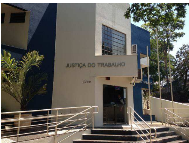
Figura 15C: Fachada frontal com pinturas em Doric White e Nocturne Blue (Metalatex, da Sherwin Williams)