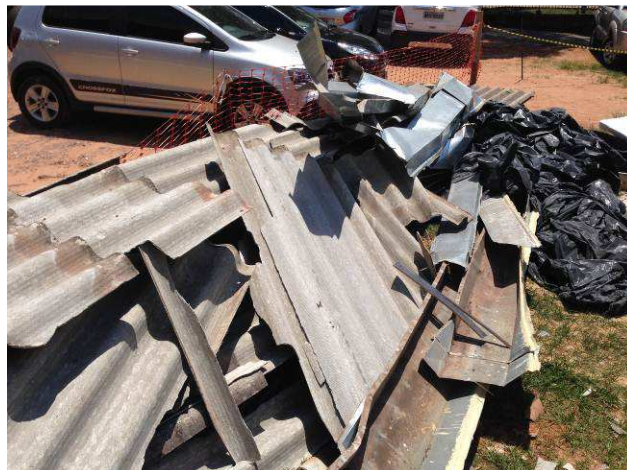
Figura 06C: Telhas removidas, encontravam-se em péssimo estado, muito fragilizadas, quase sempre quebravam na remoção.