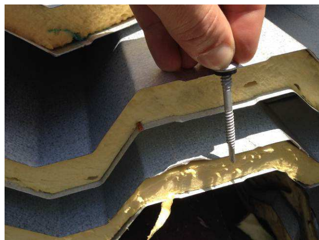
Figura 10C: detalhe da telha sanduíche (injeção de poliuretano expandido)