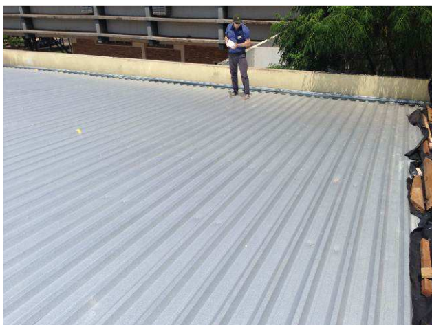
Figura 09C: visão geral da cobertura do antigo arquivo.