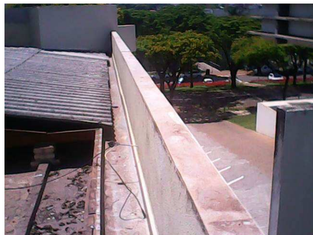
Figura 02E: Platibandas já com o SPDA removido