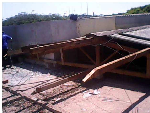
Figura 02C: Detalhe da demolição da cobertura (estrutura em madeira e telhas) sobre o antigo arquivo