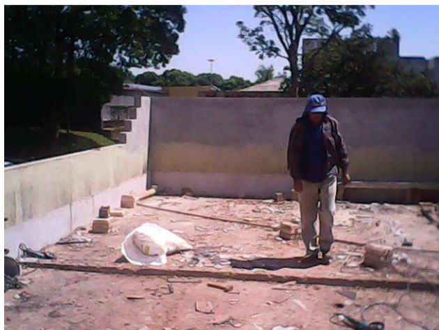
Figura 03C: Estrutura e telhas de cobertura removidas do antigo arquivo.