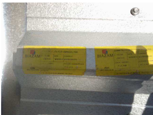
Figura 11C: Detalhe do fornecedor da telha