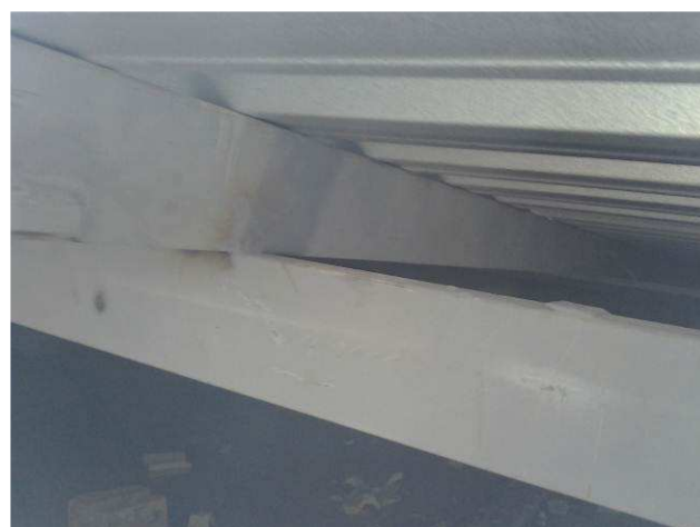
Figura 12C: Estrutura instalada