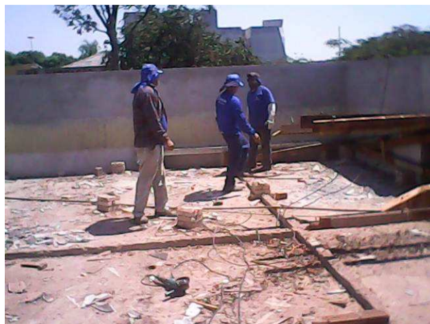
Figura 04C: Detalhe da demolição da cobertura (estrutura em madeira e telhas) sobre o antigo arquivo