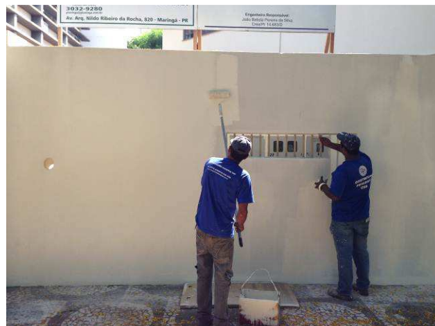
Figura 18C: Operários iniciando a segunda demão de pintura dos muros