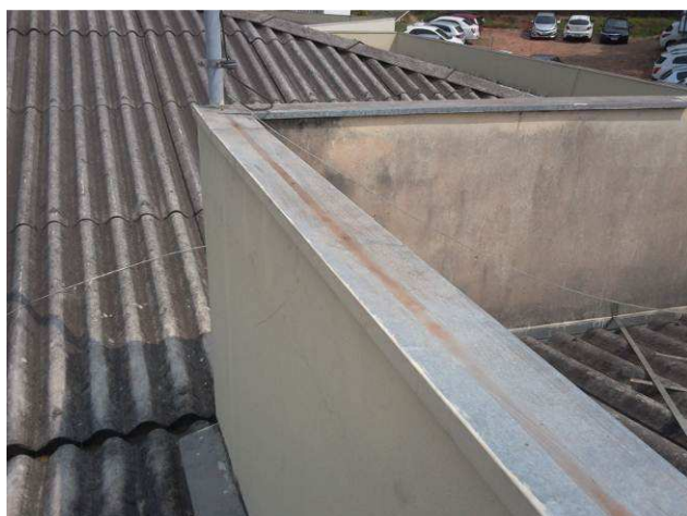
Figura 03E: Platibandas já com o SPDA removido