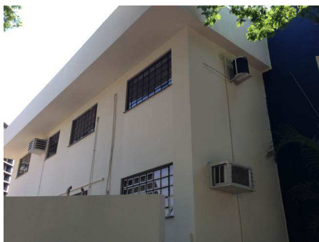
Figura 16C: Fachada esquerda do imóvel, com uma demão de pintura