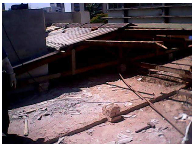
Figura 01C: Detalhe da demolição da cobertura (estrutura em madeira e telhas) sobre o antigo arquivo