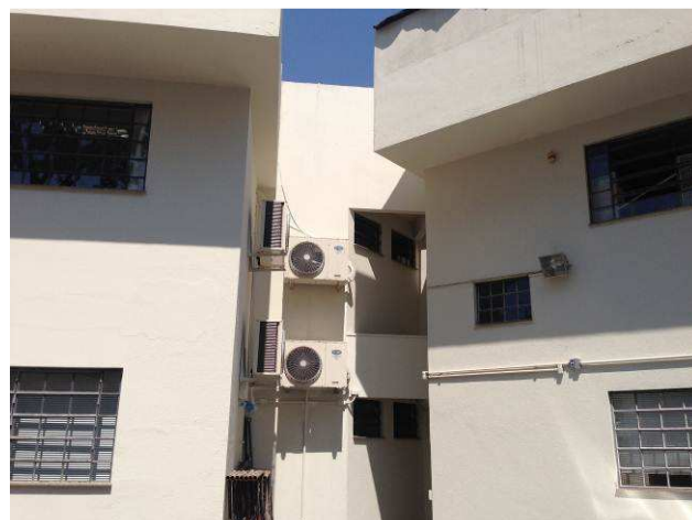
Figura 20C: Primeira demão de pintura executada na fachada dos fundos do imóvel