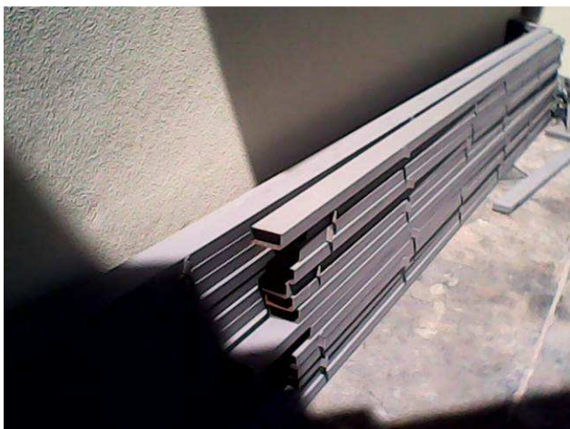
Figura 13C: Estrutura fabricada, antes da montagem e instalação