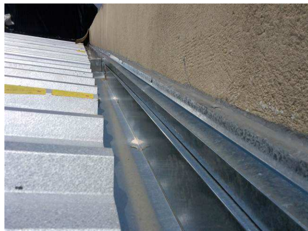
Figura 08C: Detalhe da calha instalada