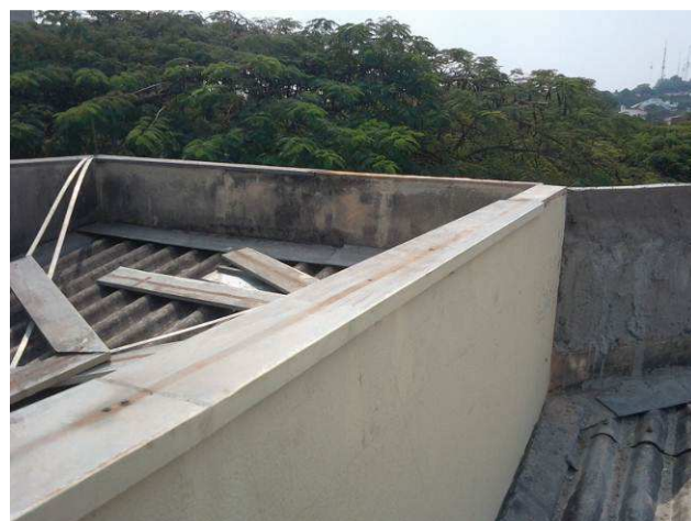
Figura 04E: Platibandas já com o SPDA removido