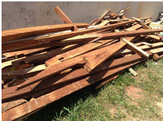
Figura 05C: Madeiramento removido da cobertura do antigo arquivo, foi disponibilizado à setorial Maringá, para que seja verificado seu aproveitamento em manutenções diversas