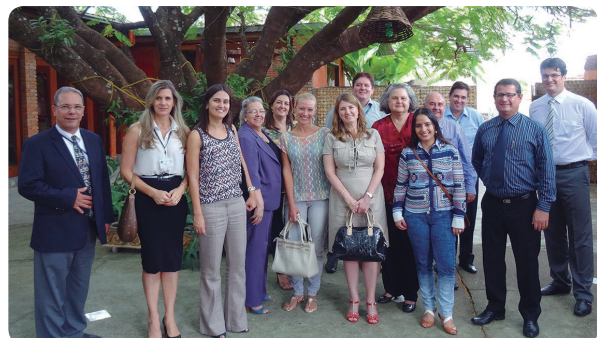
Correição na Vara do Trabalho de Santo Antônio da Platina

Conforme o Regimento Interno do TRT-PR, cabe ao corregedor, entre outras atribuições, "velar pelo funcionamento regular dos serviços judiciários do primeiro grau, expedindo os provimentos, ordens de serviço e recomendações que entender convenientes" e "exercer vigilância sobre a atuação e o funcionamento dos órgãos da Justiça do Trabalho da 9ª Região, quanto à omissão de deveres ou à prática de abusos".