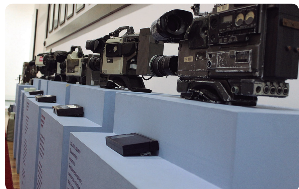
Evolução da arte de filmar pode ser vista em linha cronológica