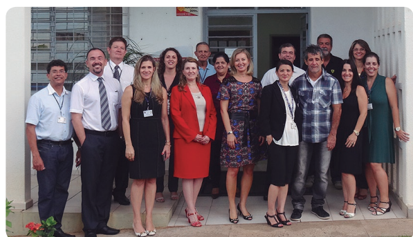
Correição na Vara do Trabalho de Jacarezinho