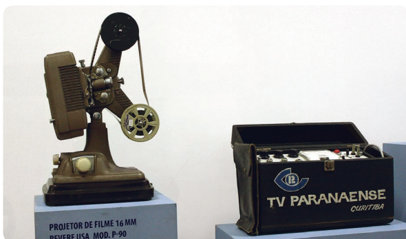
Projektor de filme da década de 1930 e "caixa de sapato" usada para transmissões de futebol e eventos