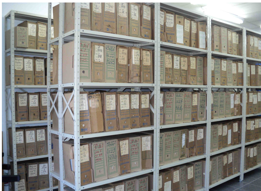
Autos recebidos pelo Centro de Memória, em fase de inventário

A cedência para a UEM visou, também, à preservação dos autos trabalhistas, tendo em vista que a Lei 7.627, de 10 de novembro de 1987, permitiu a eliminação de autos findos há mais de cinco anos, contado o prazo da data do arquivamento do processo. Outro fator que pesou para a cessão foi que, à época, o Tribunal não possuía espaço físico adequado para guarda dos processos findos e o Arquivo Público do Paraná, que poderia armazenar os autos, tinha sido parcialmente destruído em 1989, em razão de incêndio.