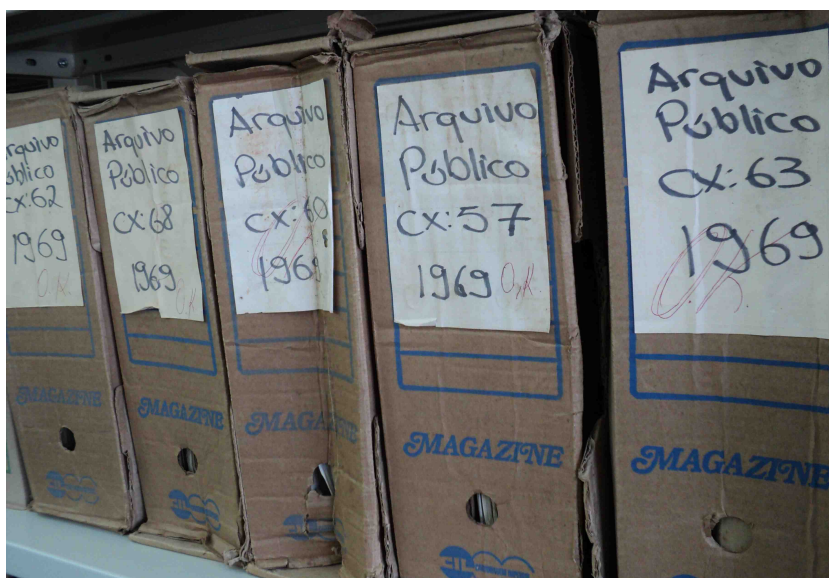
Autos recebidos pelo Centro de Memória em suas caixas originais

No início deste ano, o TRT do Paraná firmou acordo com a Universidade Estadual de Maringá (UEM) para o repatriamento de 134 mil autos findos transferidos àquela instituição (RA 65/90), com a finalidade de estudos e pesquisas. São processos trabalhistas que tramitaram no período de 1938 a 1984, nas então Juntas de Conciliação e Julgamento de Curitiba, Ponta Grossa, Paranaguá e Londrina.