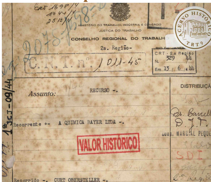
Capa dos autos 009/44 da 1ª JCJ

O Centro de Memória da Justiça do Trabalho do Paraná conta com vários processos da década de 1940 – época em que o mundo vivia sua II Grande Guerra.