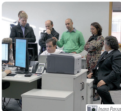
O juiz auxiliar conhece o sistema e-GAB, desenvolvido pelo TRT-PR