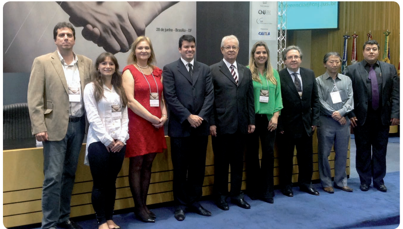
Servidores e magistrados representaram o TRT-PR na I Conferência Nacional de Conciliação e Mediação, realizada em Brasília

O presidente do Tribunal Superior do Trabalho (TST), ministro Carlos Alberto Reis de Paula, enfatizou a importância da conciliação para as partes em um processo: "Nada melhor do que conciliação e negociação, quando os protagonistas do conflito encontram a solução. É como dizem os italianos: é a sentença tecida e acordada pelas próprias partes".