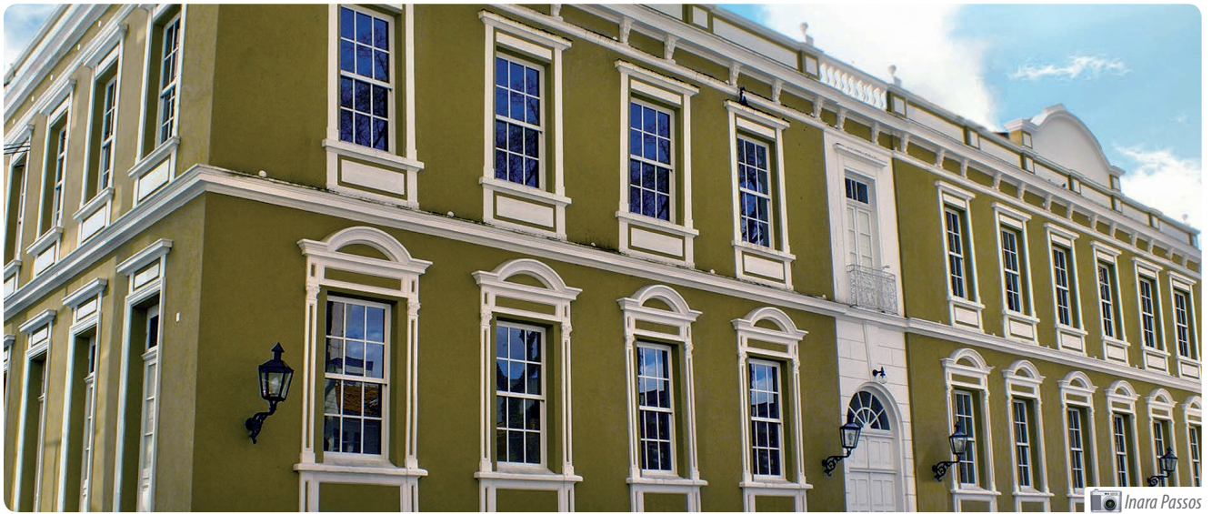
O Centro de Memória está localizado no prédio histórico do TRT-PR, situado à Alameda Dr. Carlos de Carvalho, 528