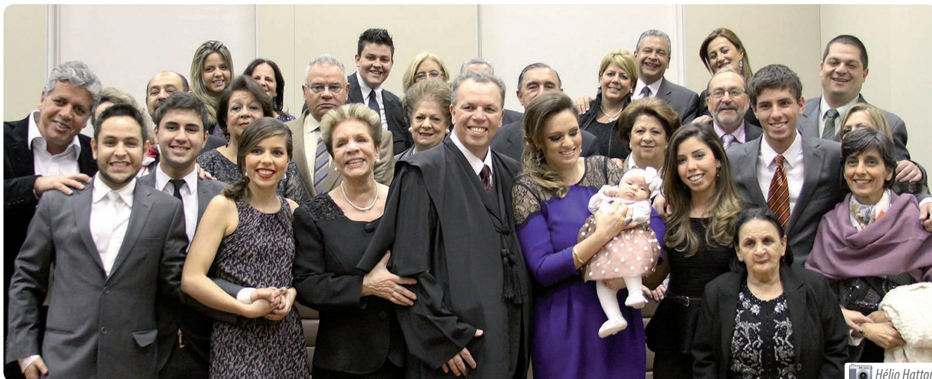
Familiares e amigos do desembargador Cássio Colombo Filho prestigiaram a solenidade