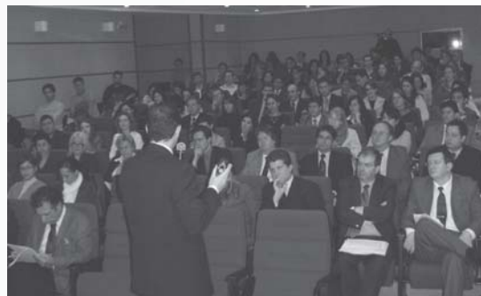
Juizes e servidores durante o III Seminário da EAJ

O magistrado do TRT gaúcho dirigiu a segunda parte de sua palestra aos efeitos específicos da falência no direito do trabalhador (inclusive quanto à exigibilidade das multas da CLT) e no processo, destacando a despersonalização da pessoa jurídica, as obrigações de coobrigados solventes e