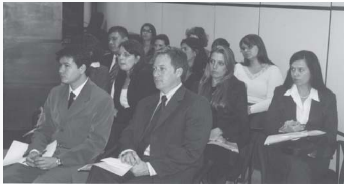
Juízes substitutos acompanhando sessão de julgamento da Seção Especializada do TRT

Em 10 de maio, houve visita à sede da OAB-PR. Acompanhados dos juízes