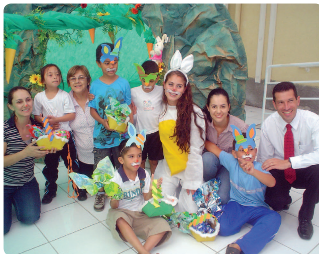
Servidores entregam ovos de Páscoa em Curitiba

Na campanha do Fórum da Justiça do Trabalho de Araucária, foram recebidos 51 kits contendo um ovo de 240g e um urso de pelúcia. Todos os kits arrecadados foram doados para as crianças cadastradas na Casa da Criança na Lagoa Grande. A instituição foi inaugurada em 2009 e atende crianças de 6 a 14 anos, nos períodos da manhã e da tarde, da área rural de Araucária. A entrega ocorreu no dia 2 de abril, em um evento que contou com apresentações de dança e teatro, organizada pelas crianças da instituição.