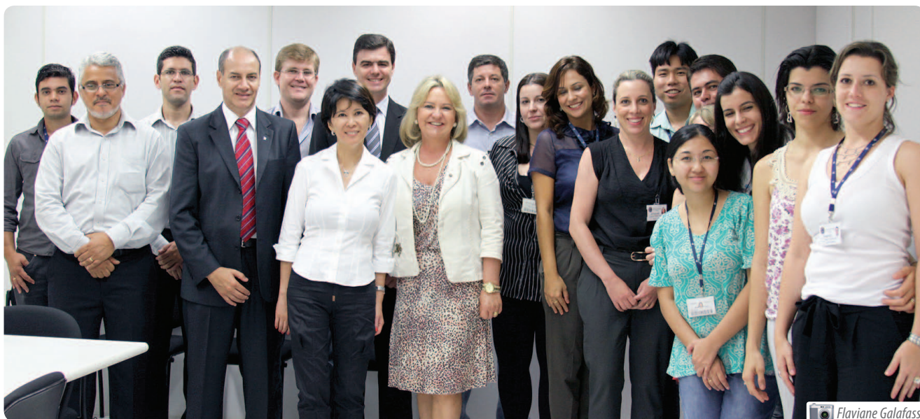
Magistrados e servidores da Vara do Trabalho de Porecatu