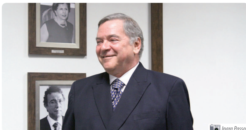
Desembargador Tobias: "Dedicação, desde 1976, em prol desta Corte"