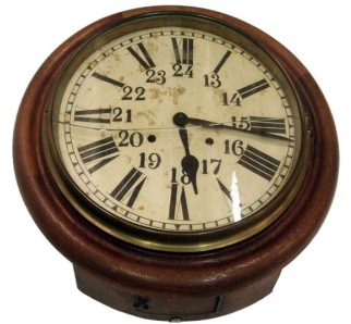
Relógio de estação ferroviária

quatro são muito importantes porque são de autoria de um fotógrafo oficial do império brasileiro chamado Marc Ferrez e datam de 1885, época da construção da ferrovia Paranaguá-Curitiba”, contou. O Iphan é o instituto responsável pela guarda desse material histórico.