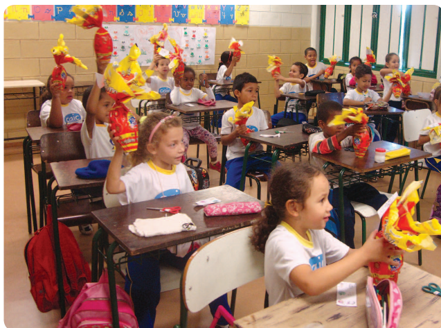
Crianças de escola pública de Cornélio Procópio

A Campanha de Páscoa da Vara do Trabalho de Cornélio Procópio, que recebeu doações de advogados, empresas, sindicatos, instituições bancárias, peritos, jurisdicionados, servidores e magistrados, arrecadou 1.553 ovos de chocolate. As doações beneficiaram crianças de nove creches públicas da cidade, sete escolas Municipais e três entidades assistenciais. Foram doados também 33 ovos para as crianças das famílias atendidas mensalmente pela campanha permanente de cestas básicas realizada pela VT.