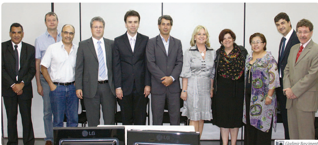
Magistrados do Fórum Trabalhista de Londrina