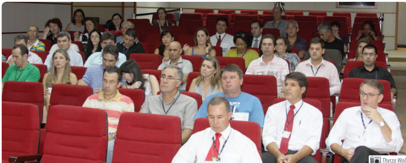
Servidores da Secretaria Administrativa durante encontro no Tribunal Regional do Trabalho