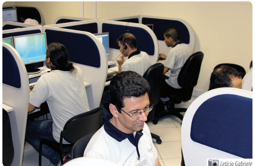
Equipe da Central de Serviços de Tecnologia da Informação