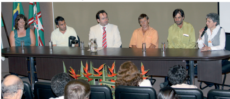
O encontro reuniu especialistas, autoridades e representantes sindicais, na Procuradoria Regional do Trabalho

Os riscos de um trabalhador fumante e os perigos enfrentados pelos trabalhadores da Fumicultura foram debatidos no seminário Tabaco e Relações de Trabalho - Protegendo a saúde do trabalhador na cidade e no campo , no dia 11 de dezembro, na Procuradoria Regional do Trabalho da 9ª Região. Foram relatados casos de agricultores que sofreram danos irreversíveis à saúde, na cultura do fumo. O curso teve apoio da Associação Médica do Paraná, da Ordem dos Advogados do Brasil, da Associação dos Advogados Trabalhistas do Paraná e da Federação dos Trabalhadores na Agricultura Familiar da Região Sul do Brasil. ■