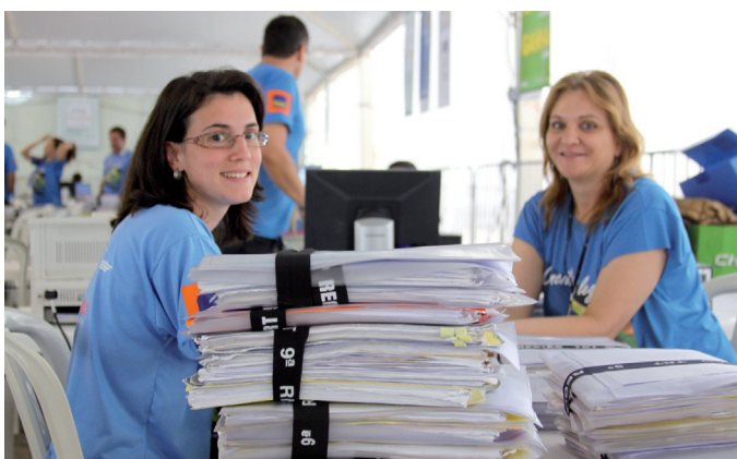
Servidoras do TRT se empenham no mutirão da Semana da Conciliação, em Curitiba