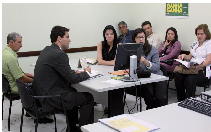
Audiência de conciliação na 8ª Vara do Trabalho de Curitiba