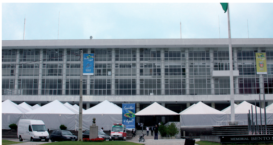
A estrutura foi montada em frente ao Palácio Iguazu, sede do Governo do Paraná

O êxito obtido em 45% das audiências foi considerado positivo pelo