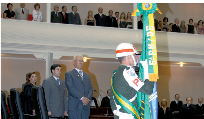
O ato solene de entronização da bandeira nacional - sua entrada e instalação perpétua no plenário do TRT-PR - foi realizado por oficiais da 5ª Região Militar.