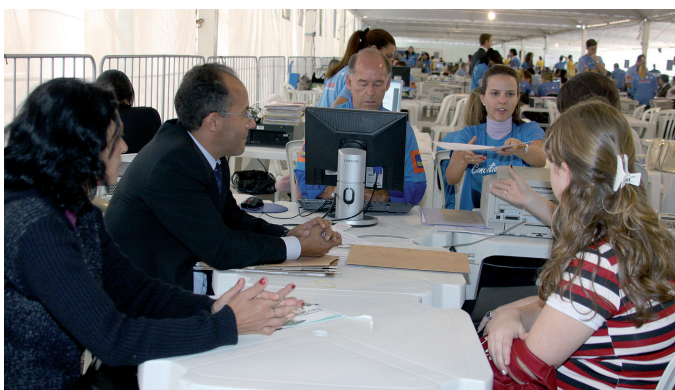
Trabalhadores e empregadores buscam acordo durante o mutirão da Semana da Conciliação, em Curitiba