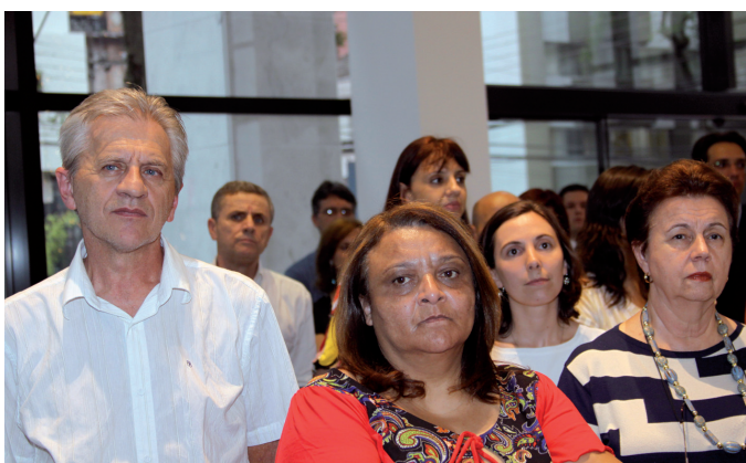
Magistrados e servidores prestigiaram o evento