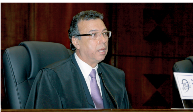
O desembargador Ney José de Freitas no posto da Presidência, no plenário