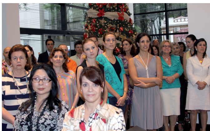
O repertório de canções natalinas sensibilizou a platéia no hall de entrada da sede do TRT