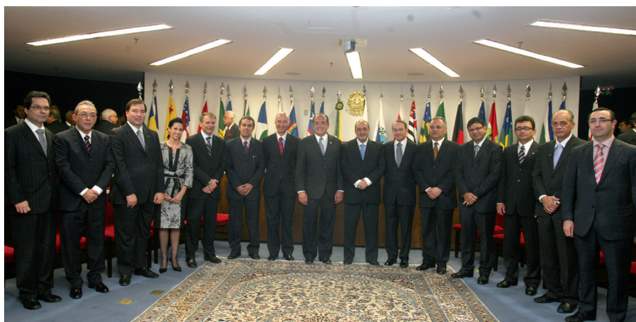
Registro fotográfico dos 15 membros do Conselho para o biênio 2009-2011