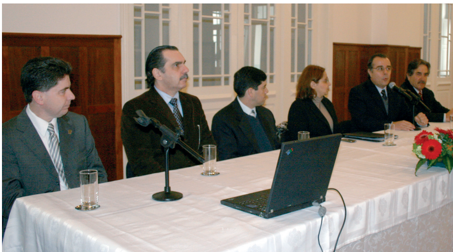
Solenidade, em 24 de julho, alusiva à assinatura de acordo de cooperação que permitirá aos advogados o acesso aos arquivos em vídeo e áudio de audiências trabalhistas