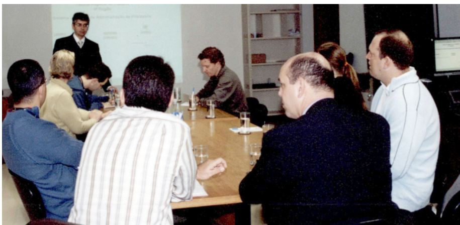
Workshop, realizado de 22 a 24 de julho, sobre o tema "Varas Digitais e o Processo Judicial Eletrônico"

A reunião envolveu discussão e avaliação crítica da atual etapa do projeto, que contempla a forma de trabalho a ser adotada nas Varas digitais da 9ª Região. Na base do método de gestão está o conceito de fila de trabalho - workflow -, que não obedece à forma linear adotada no tipo de trabalho clássico das secretarias de Varas do Trabalho, porque