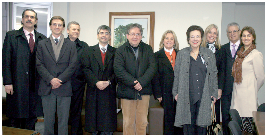
Magistrados e servidora durante a apresentação, em 27 de julho, das novas instalações da EJ, no prédio 147 da Vicente Machado

O alcance da efetiva prestação jurisdicional com qualidade, por meio da formação e o aprimoramento profissional contínuo dos magistrados e servidores na EJ, norteou o cronograma de atividades no âmbito regional, inclusive para 2010. Entre outros assuntos de relevância, nessa reunião foram analisadas a elaboração da proposta prévia de verba de capacitação para o orçamento do ano de 2010; proposição dos pré-projetos de Educação Continuada para servidores e magistrados para 2010; proposição para a elaboração das diretrizes do programa do 3º Curso de Formação Inicial para Magistrados do Trabalho – Módulo Regional; análise e aprovação do